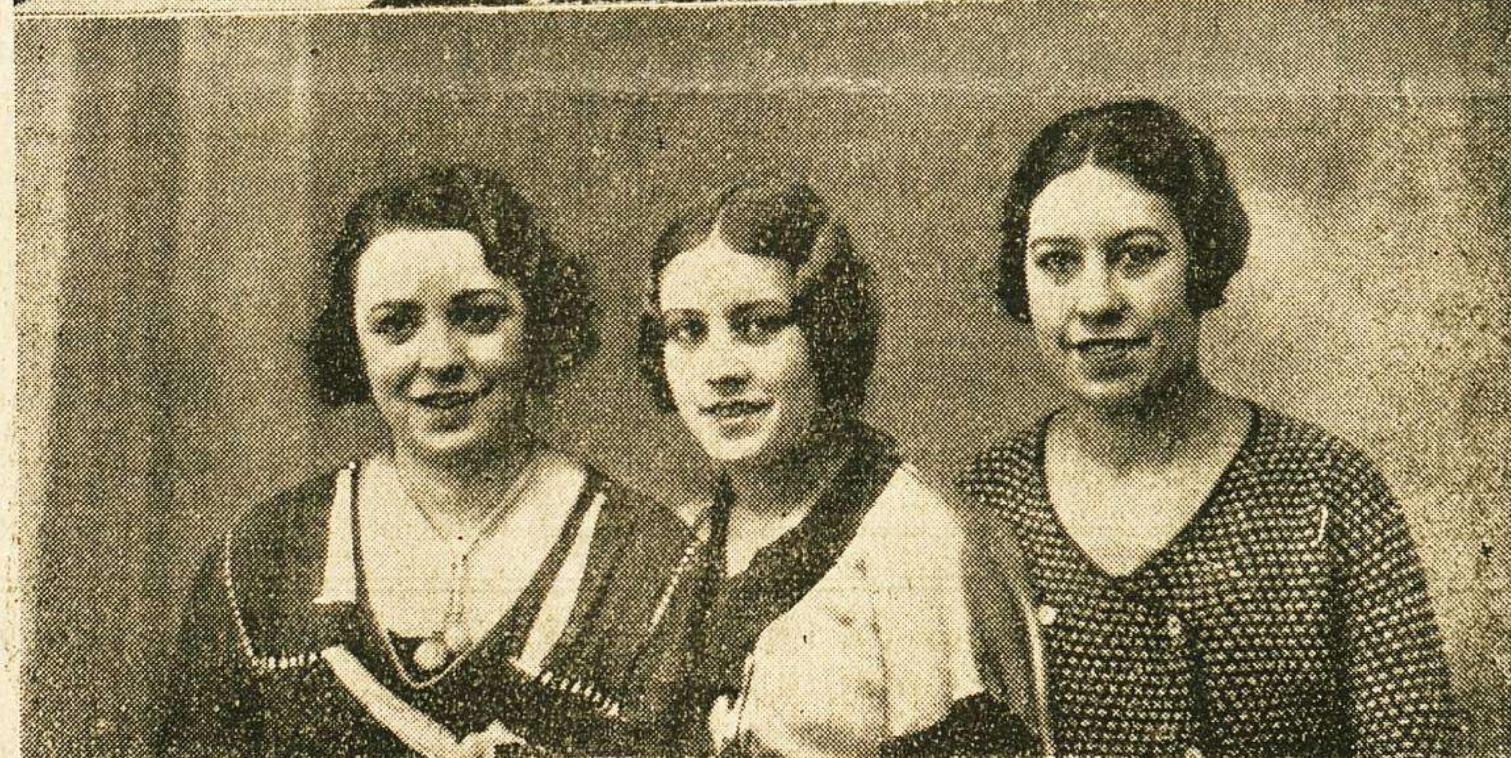
Salon de planta baja del Café Astoria, donde actúa el Trio Ron