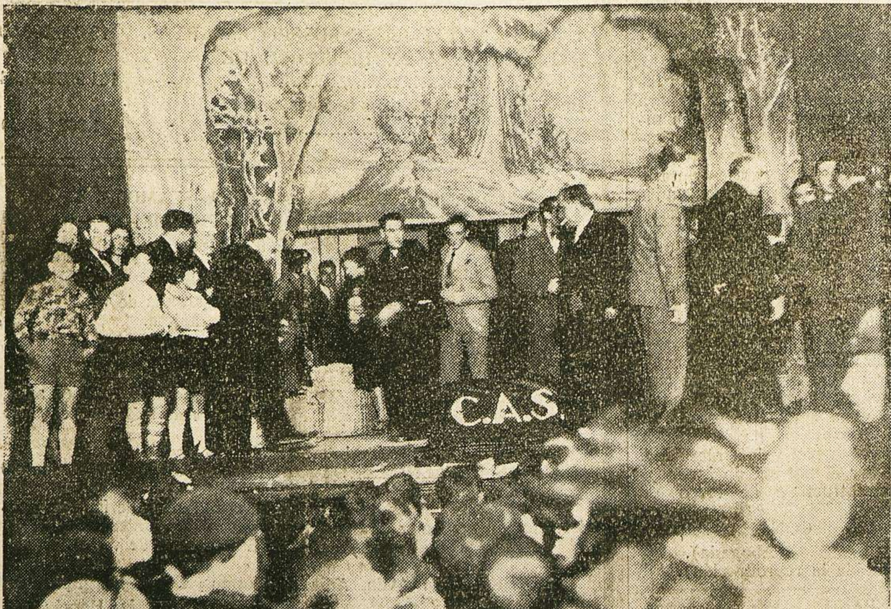
El reparto de Juguetes en el escenario del Teatro Moderno

Debido a las obras que se están efectuando en la casa número 28 de la Plazuela del Corriolo, donde estaba instalado nuestro buzón para la recogida de anuncios y originales, lo hemos trasladado a la fachada de nuestra Administración, Librería de Niñez, García Barrado, 25.