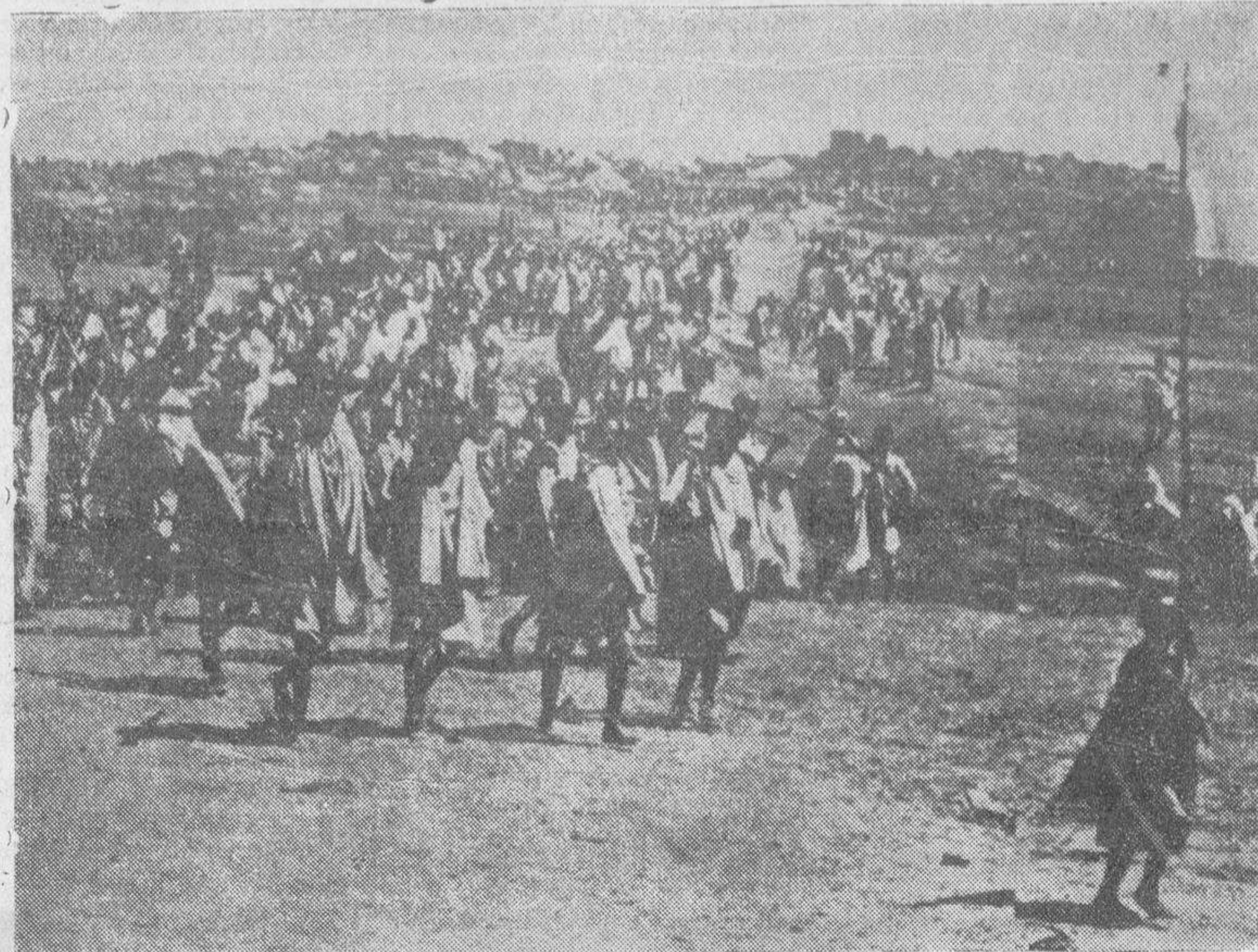
Durante los choques habidos en la región de T... en Abisinia, un numeroso grupo de soldados etiopes, precedidos de una gran bandera blanca se entregan prisioneros a los italianos