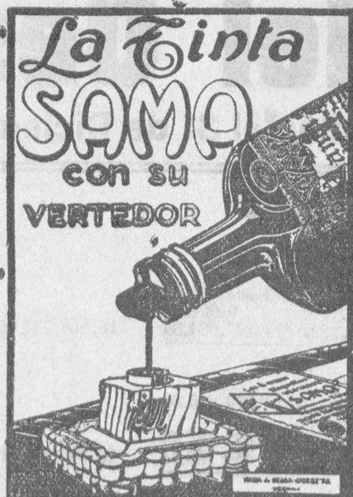
DE VENTA EN LAS BUENAS PAPELERIAS