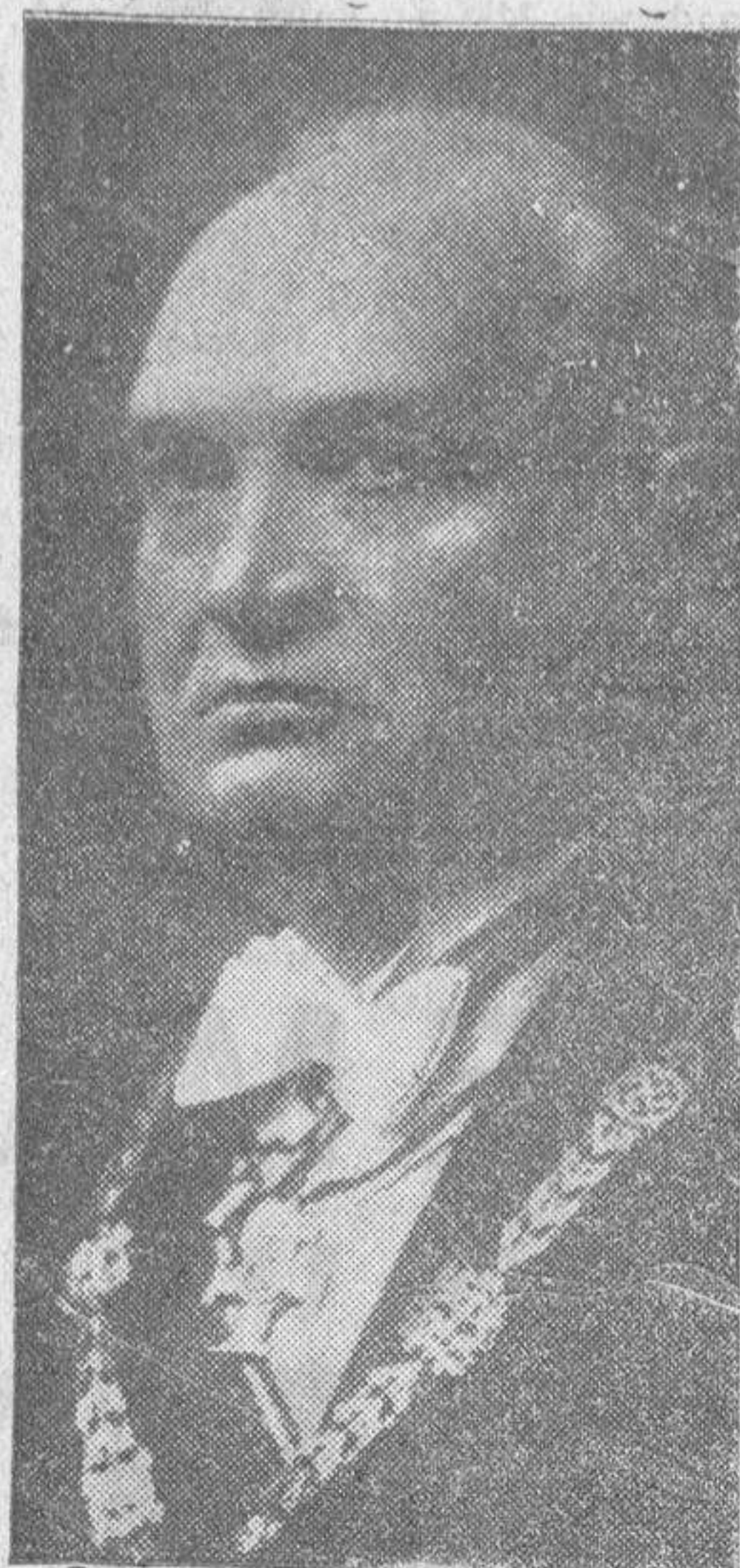
El señor K. Pats, presidente de Estonia, en donde se celebra estos días el aniversario de la independencia del país