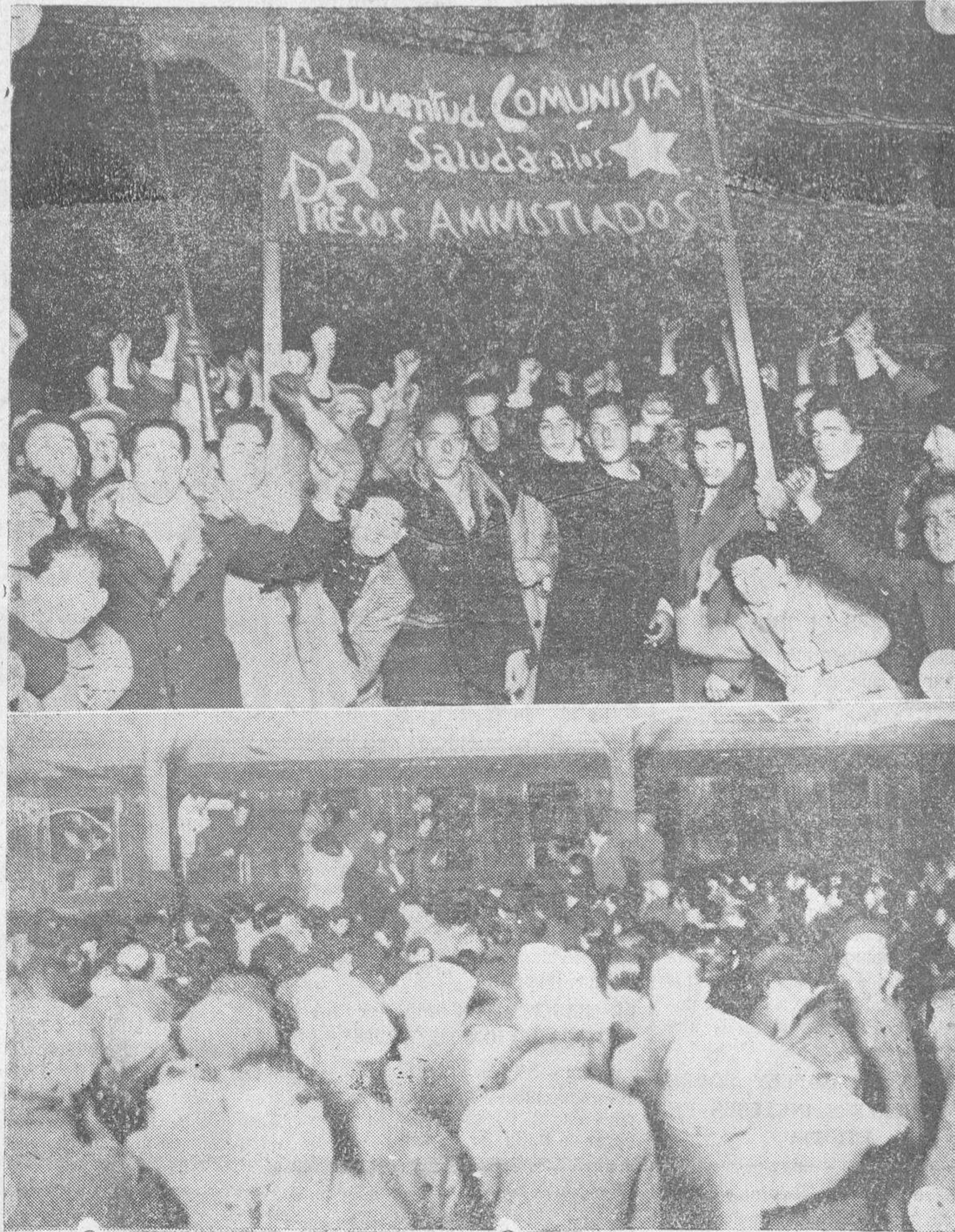
Arriba: Los amnistiados saludando, nuño en alto, a la numerosa concurrencia que se hallaba en la estación.—Abajo: Aspecto que ofrecía el andén de la estación, a la llegada del tren que conducía a los cuatro amnistiados.

me multitud, que les daba la bienvenida. Seguidamente se organizó una gran manifestación, que rodeó a los amnistiados, haciéndose la marcha con grandes dificultades, hasta la Casa del Pueblo, a donde había acudido también numeroso público.