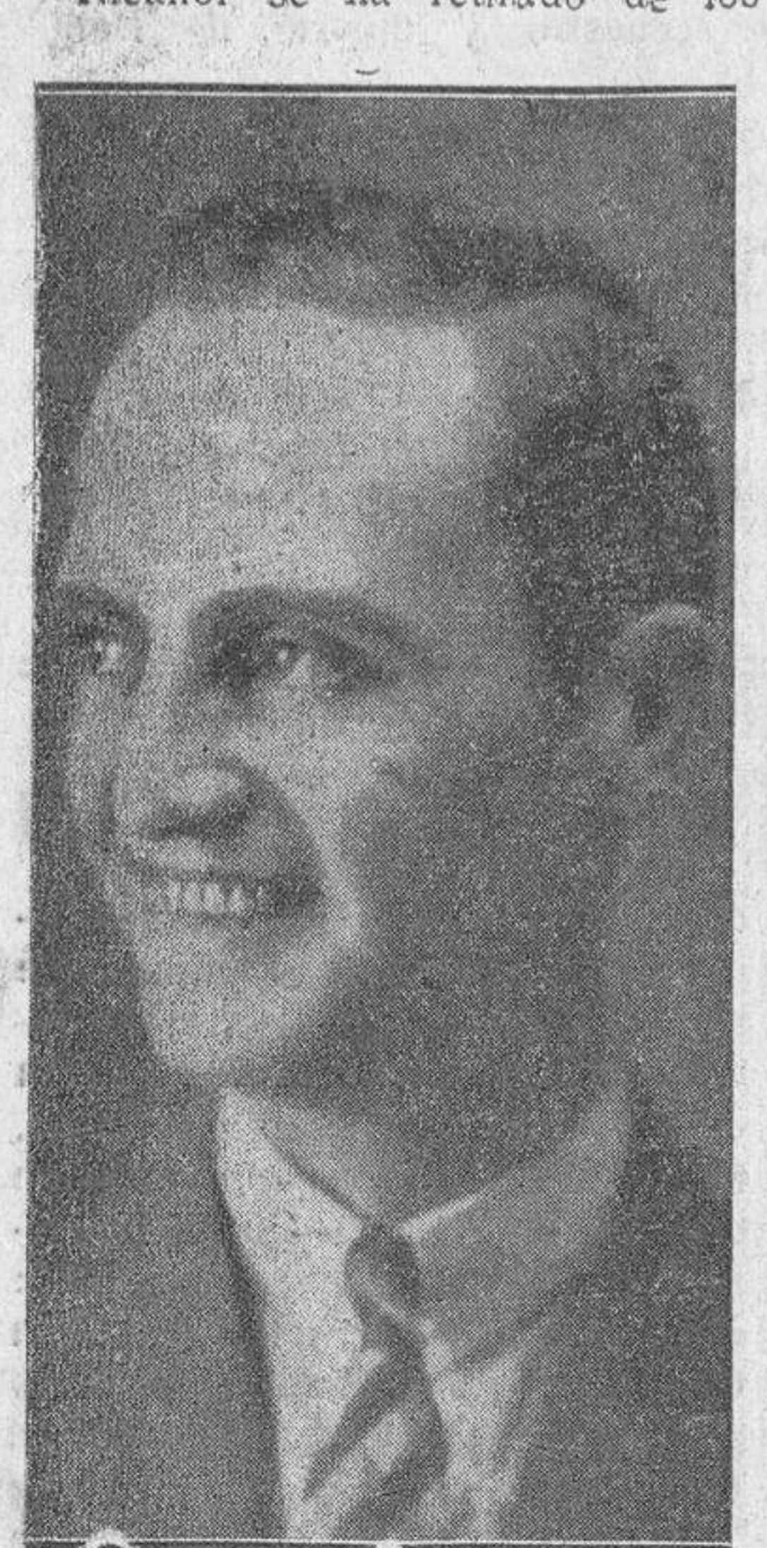
El ya veterano matador de toros Nicanor Villalta, que se ha retirado de su profesión de torero.