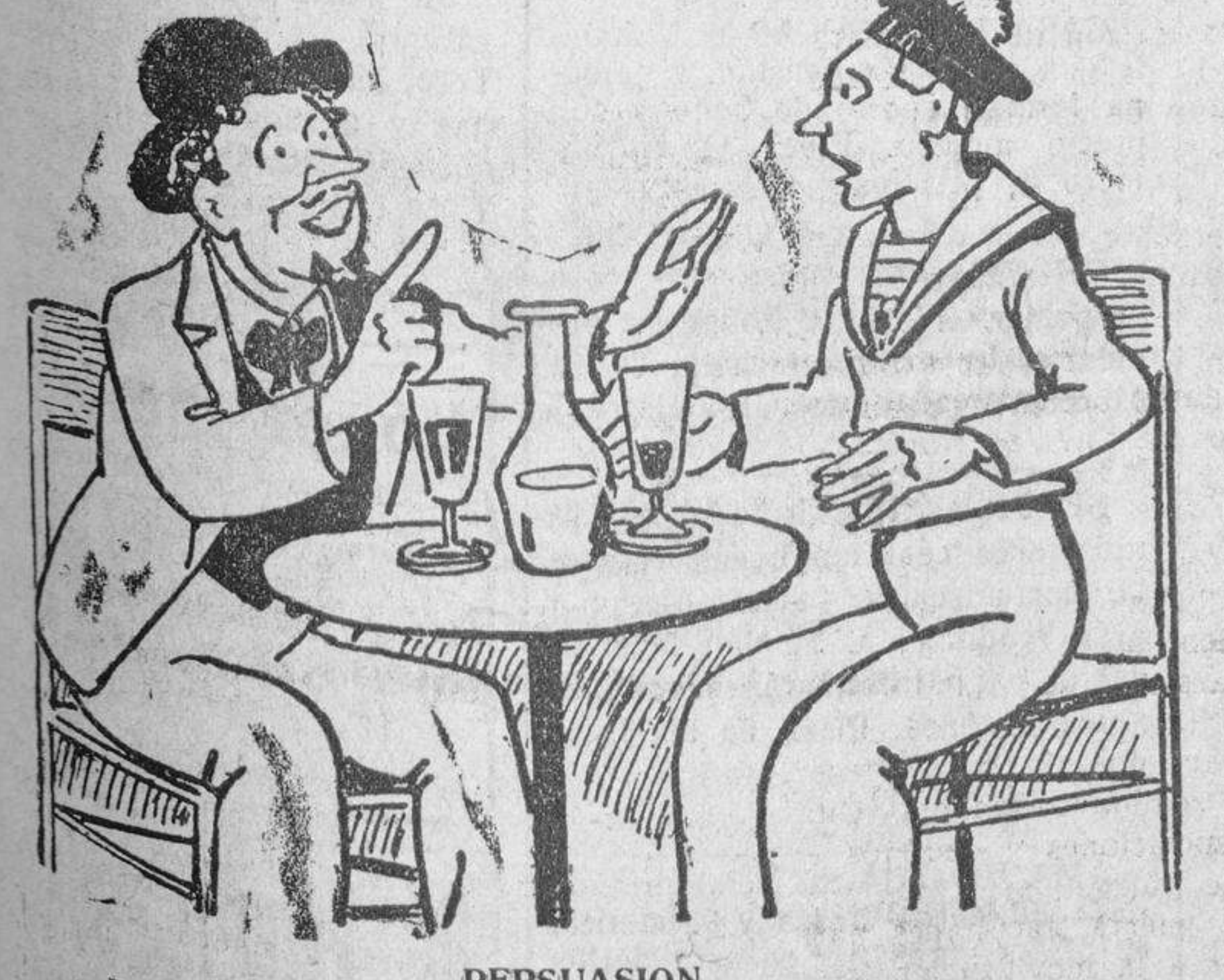
PERSUASION —Esas teorías son completamente falsas. Tú cuando viniste al mundo, no tenías ni qué poner. —Efectivamente, pero... —Y todo lo que ahora cubra tus carnes es lo que llevas demás. (Columbia Gester).