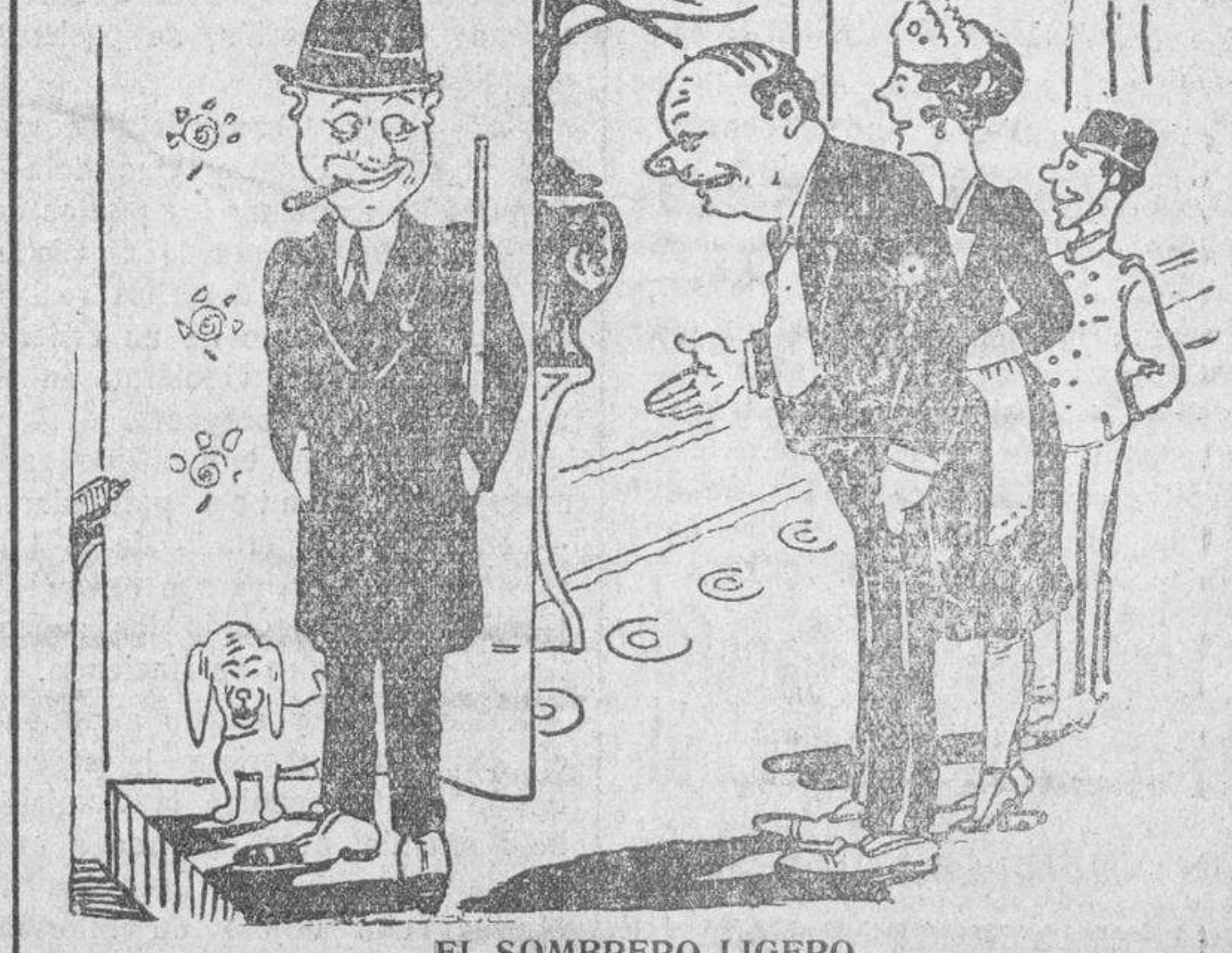
EL SOMBRERO LIGERO —¿Saldrá el señor esta noche? —Si. Iré al teatro, pero prepárame un sombrero ligero, porque como conozco a tanta gente no quiero fatigarlos demasiado en el saludo. (Ric-Rac).