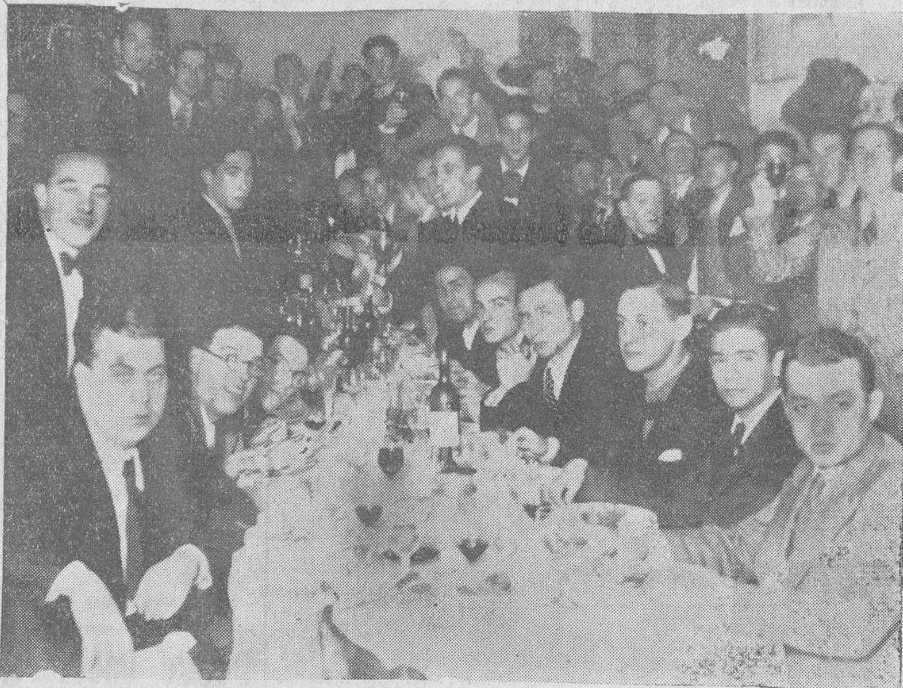
Los alumnos internos del Hospital Provincial, reunidos en banquete, siguiendo la costumbre de años anteriores, durante el cual reinó la mayor camaradería y buen humor