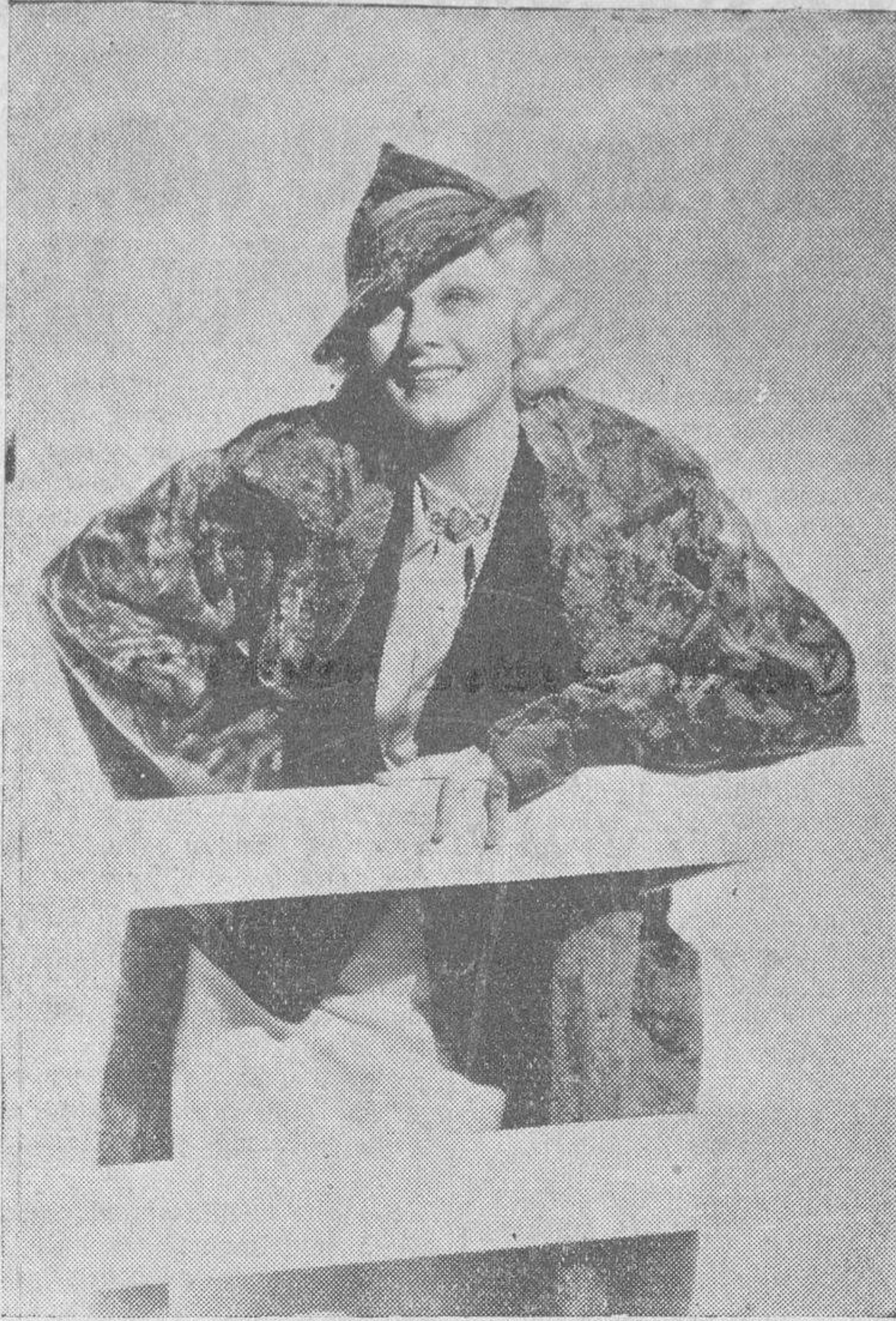
Jean Harlow, estrella de la pantalla, con un abrigo de paño y sombrero del nuevo estilo de copa puntiaguda