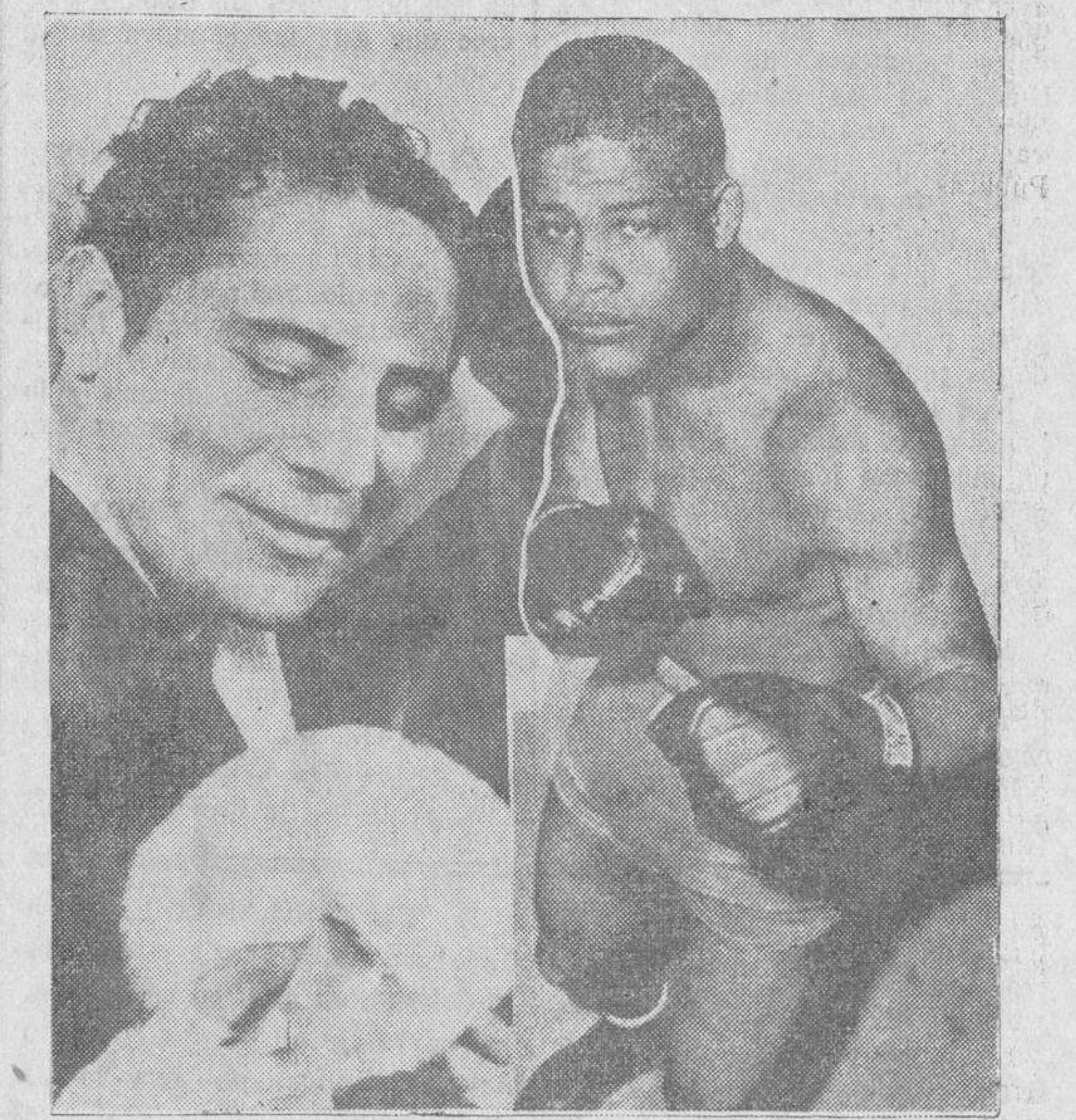
Max Baer y Joe Louis, que anoche pelearon en Nueva York, venciendo rotundamente el boxeador negro

Empezó a boxear a los 19 años y después de rápido paso por el "amateur" llegó al campo profesional en 1929, a los 20 años de edad. Actuó, con suerte varia, en California, sosteniendo enconada rivali-