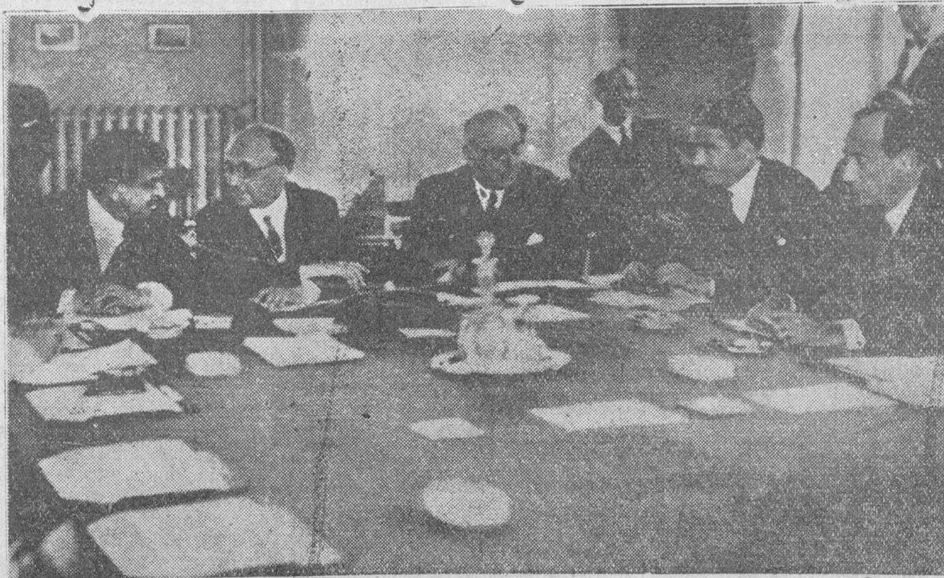
Un aspecto del salón del edificio de la Sociedad de Naciones durante la reunión celebrada por el Comité de los Cinco, en la que se redactó la propuesta que ha sido rechazada ya por Italia