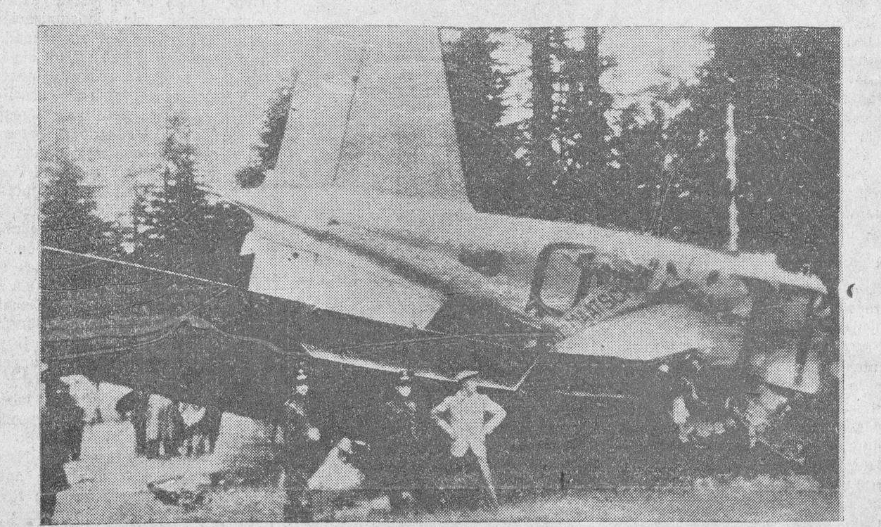
Telefotografía de los restos del avión holandés «K. L. M.», que se estrelló contra una montaña cuando volaba de Amsterdam a Milán. En la catástrofe perecieron nueve pasajeros y cuatro tripulantes.