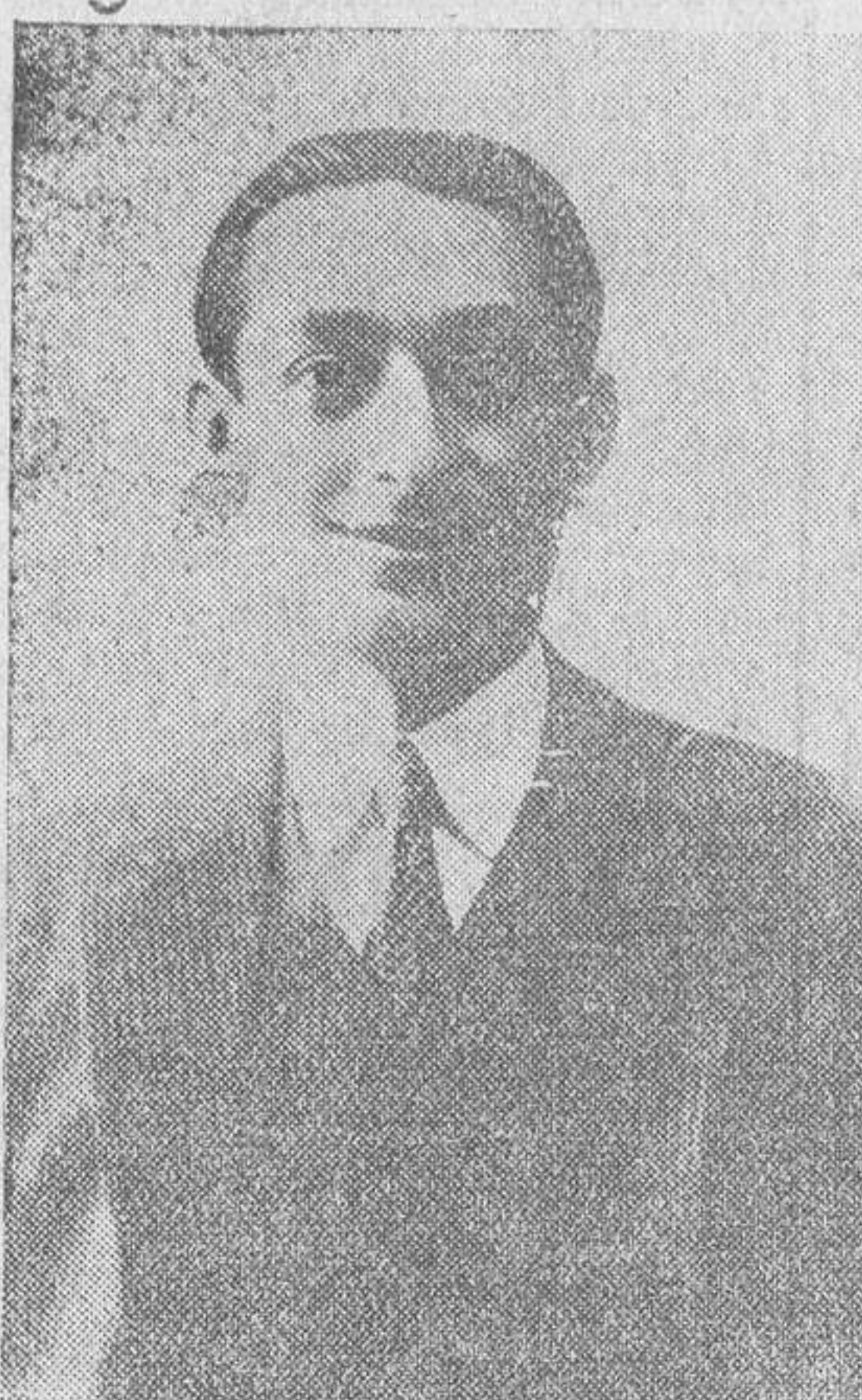
El notable cantante Marcos Redondo, que actuará en el Coliseum al frente de una magnífica compañía de zarzuela

En el repertorio de esta compañía está hecho a base de las siguientes obras, casi todas ellas desconocidas en Salamanca: "No juguéis con esas cosas", de Benavente; "Lo que Dios no perdona", de Marquina; "Martes, 13", de los hermanos Alvarez Quintero; "Mojerena clara", de Quintero y Guillén;