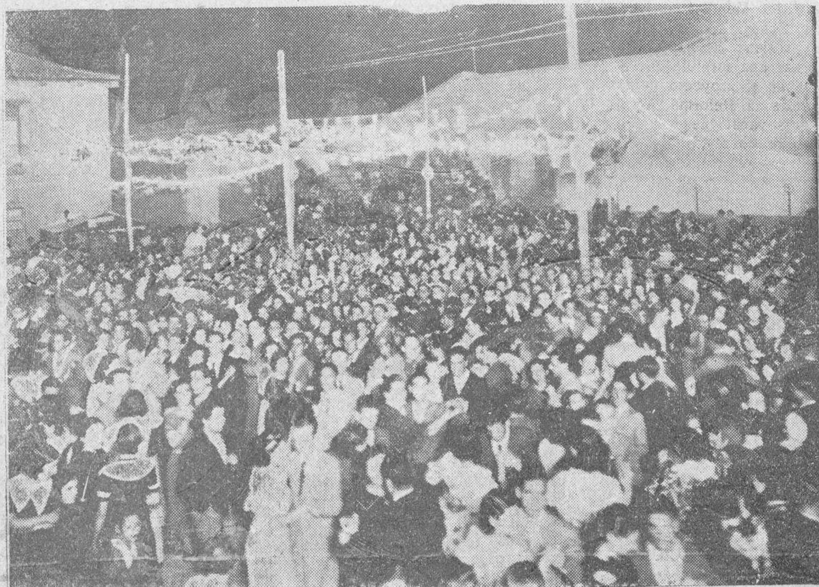
Un aspecto del Frontón de San Bernardo, durante la animada verbena de anoche.

La "Electra" hizo una instalación potente y magnífica, y la Comisión organizadora se encargó de adornar el Frontón, con farolillos, guirnaldas y banderitas. La mayor