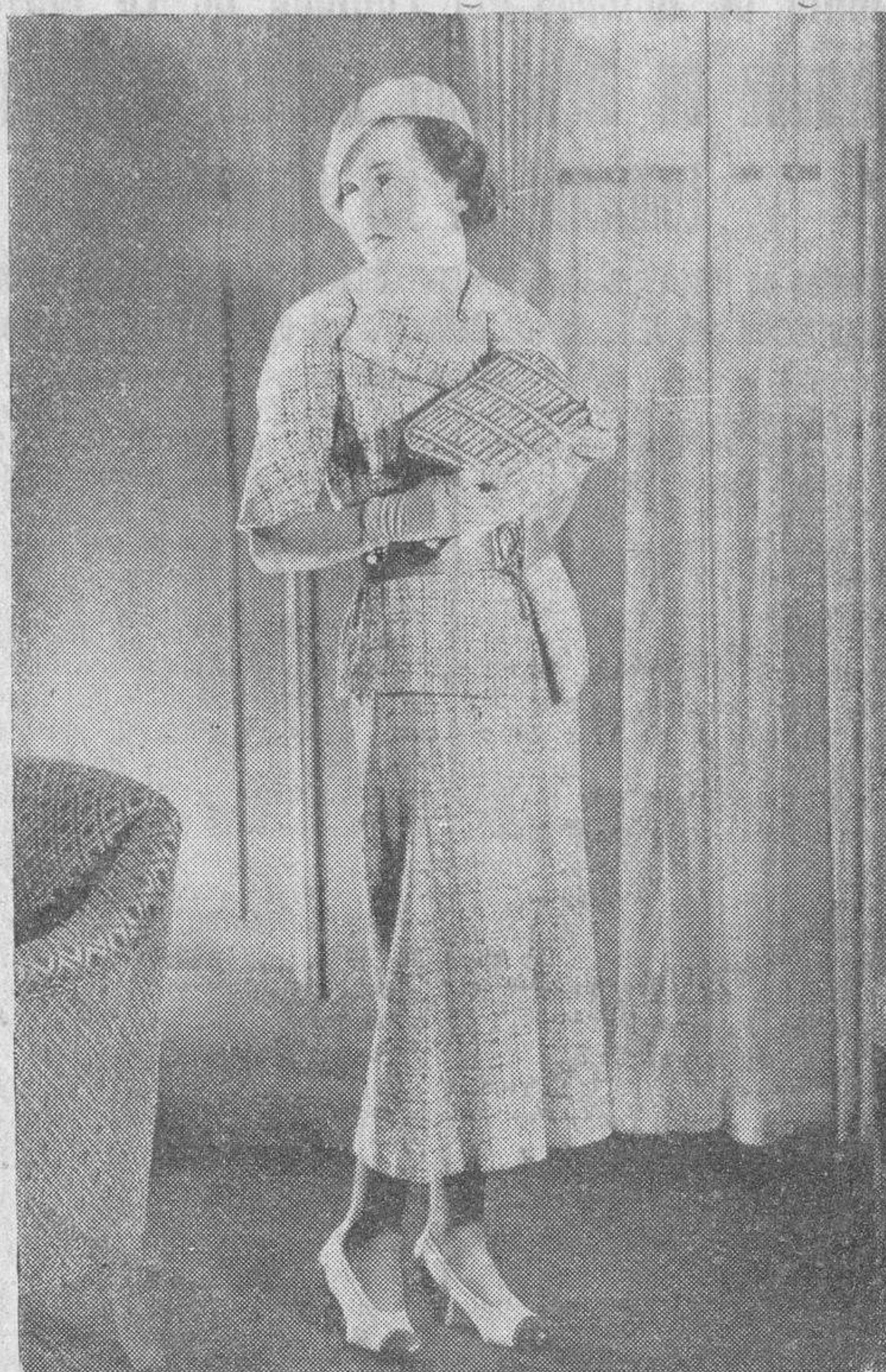
Traje de paño burdo, de tonos rojos sobre fondo pardo, con que luce muy bien la actriz Maureen O. Sullivan. El cinturón es de cabritilla roja. Los demás accesorios son de color beige, y la bolsa de mano, de paja teñida de varios colores