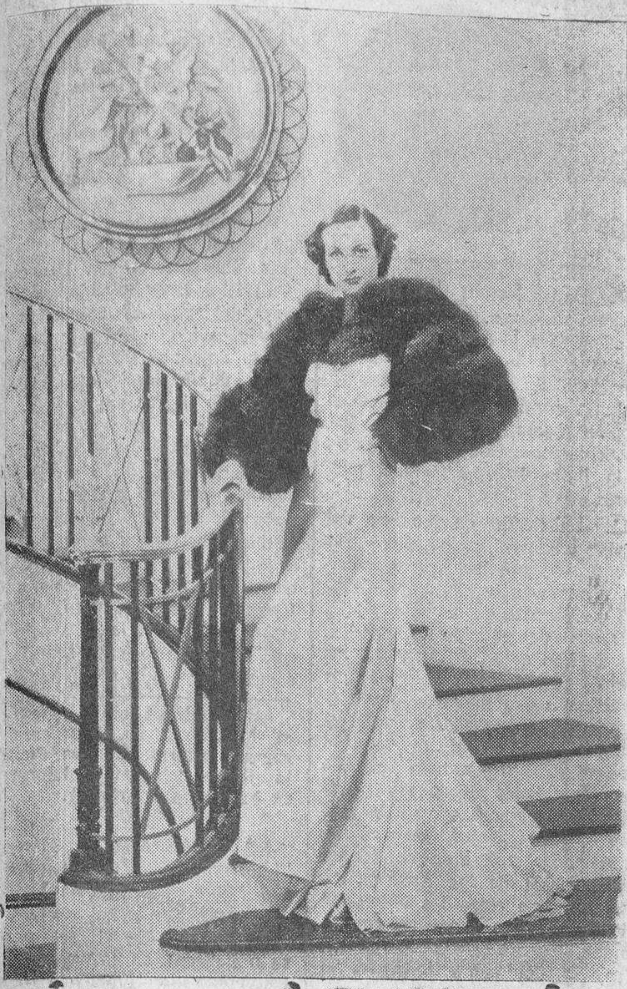
Exquisito traje de noche, de raso color carne, lucido por Joan Crawford en su nueva película. La capa está hecha de tres pieles de zorro plateado, con la particularidad de que el cuello y las mangas forman una sola pieza