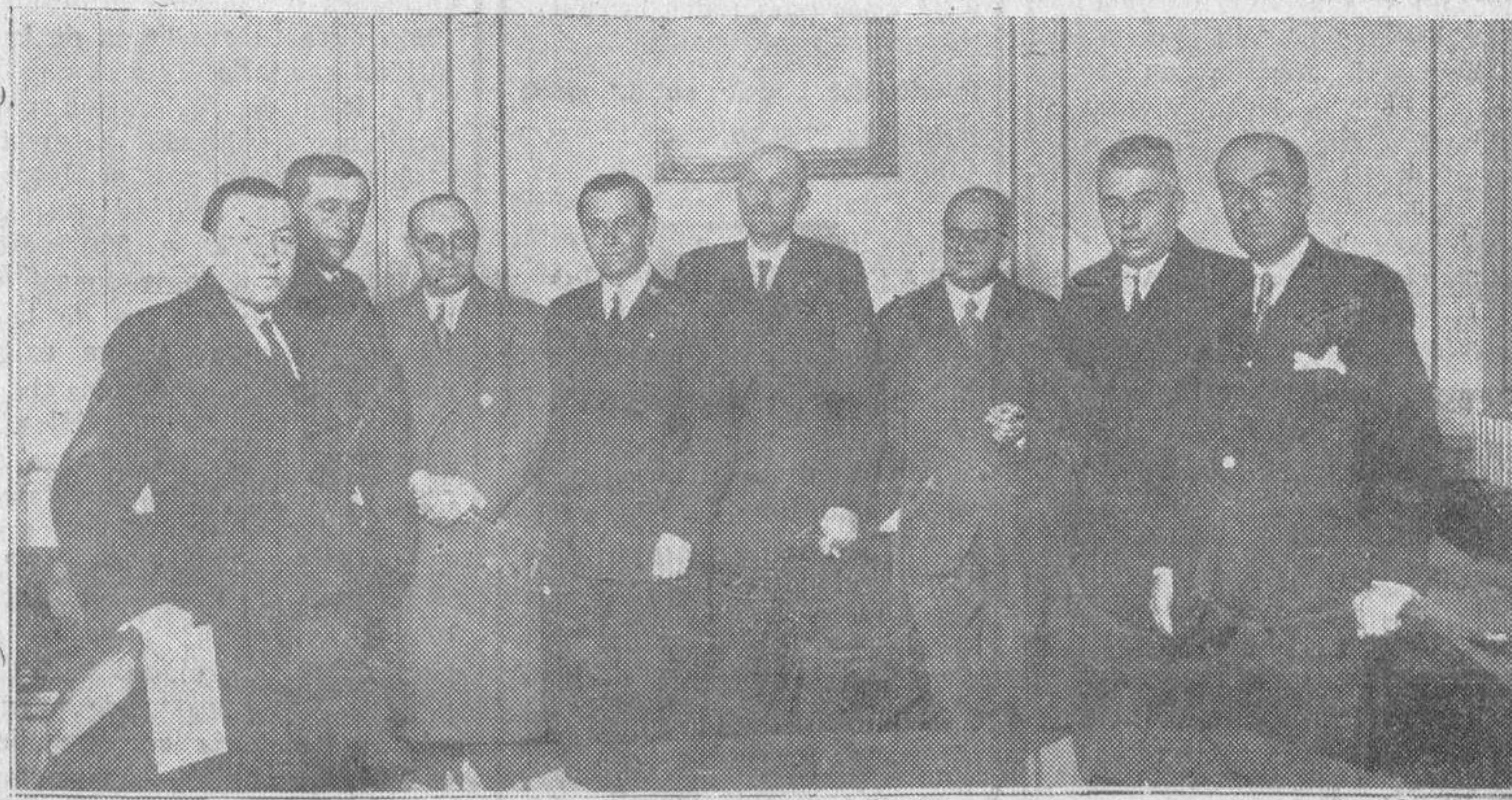
El presidente y vicepresidente de la Diputación provincial, con los alcaldes de Salamanca, Peñaranda, Ledesma, Béjar, Sequeros y Alba de Tormes, durante la reunión que celebraron el lunes último para tratar del proyectado homenaje a la Guardia civil, que consistirá en la entrega de una bandera costeadá por todos los Ayuntamientos de la provincia