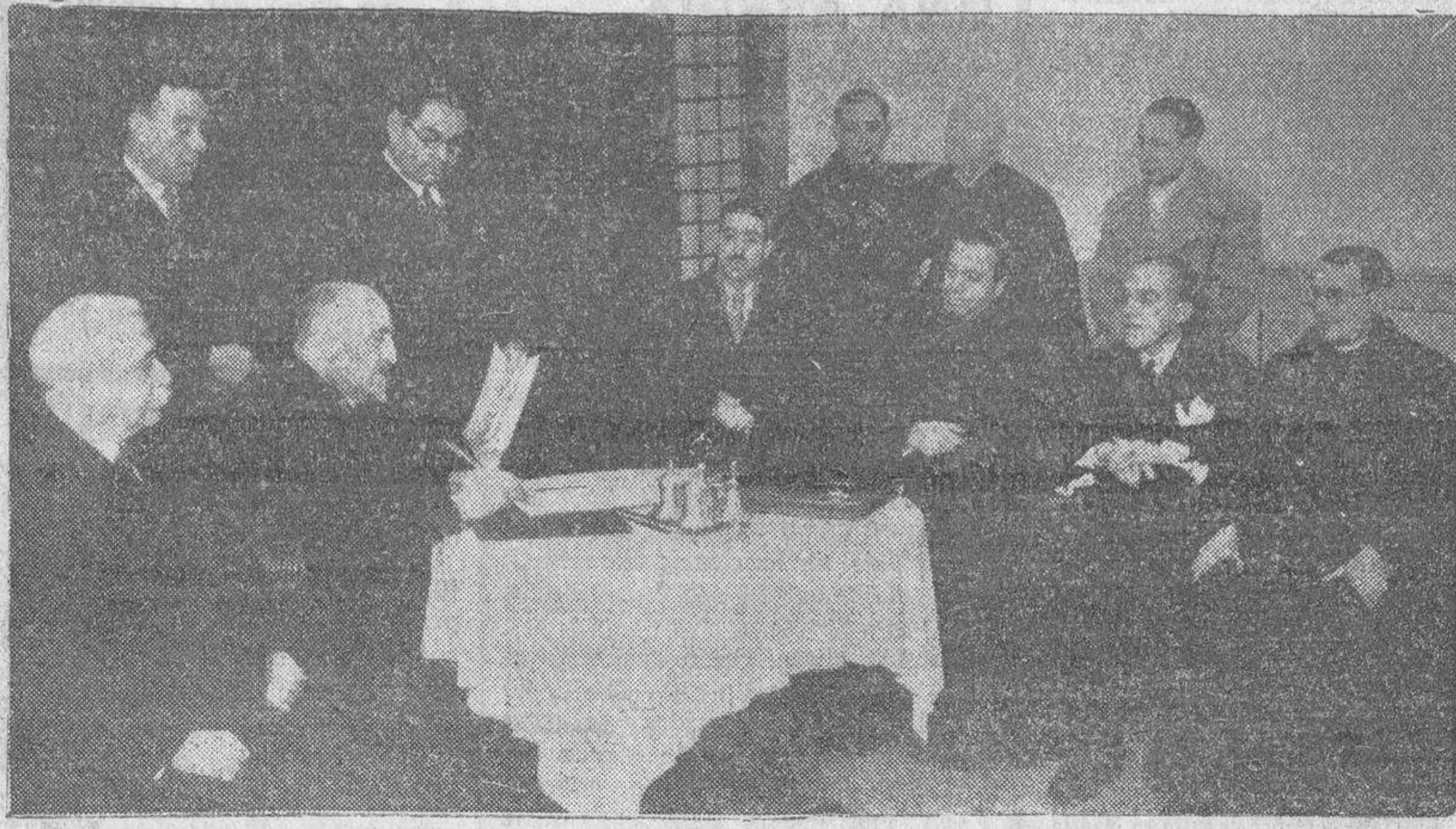
El director de la sucursal del Banco de España en Toledo, firmando la escritura de compra del convento de Santa Fe, que se á derruido, para edificar la nueva sucursal