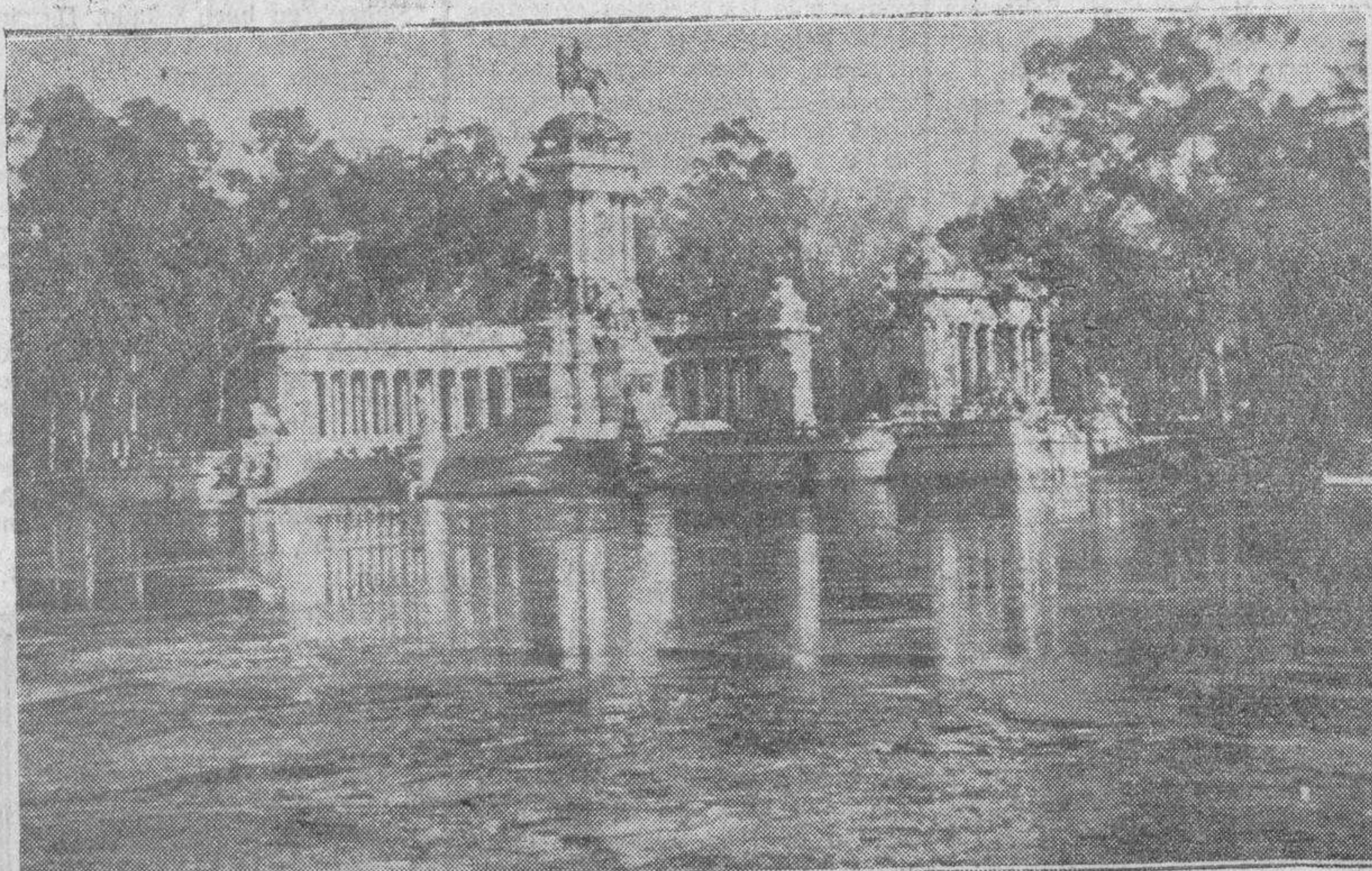
La ola de frío se ha dejado sentir también en Madrid con gran intensidad. He aquí el estanque del Retiro, que se ha helado completamente, sirviendo de excelente pista para los patinadores