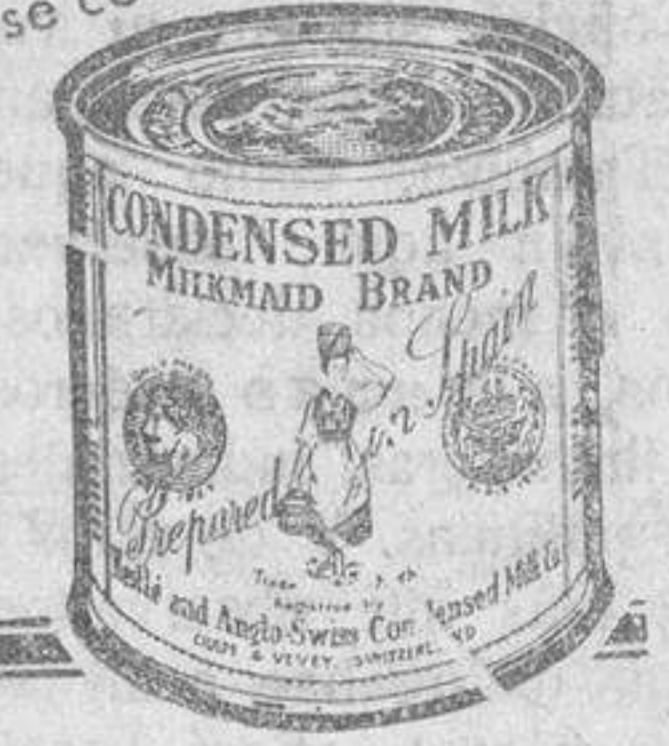
Pida hoy mismo a Sociedad Nestlé. (Sección LC 7) Via Zapatera, 41, Barcelona, un ejemplar gratuito del magnífico folleto ilustrado "Recetas La Lechera".

el paciente necesita de una leche rigurosamente pura, rica en vitaminas, nutritiva y que no pueda perjudicar el estómago más débil y delicado, condiciones que se encuentran siempre reunidas y garantizadas en la leche condensada, marca "LA LECHERA". Se encuentran también ahora en el comercio "botes degustación" "LA LECHERA" muy a propósito para una espléndida dosis, y que pueden fácilmente abrirse con un cortaplumas.