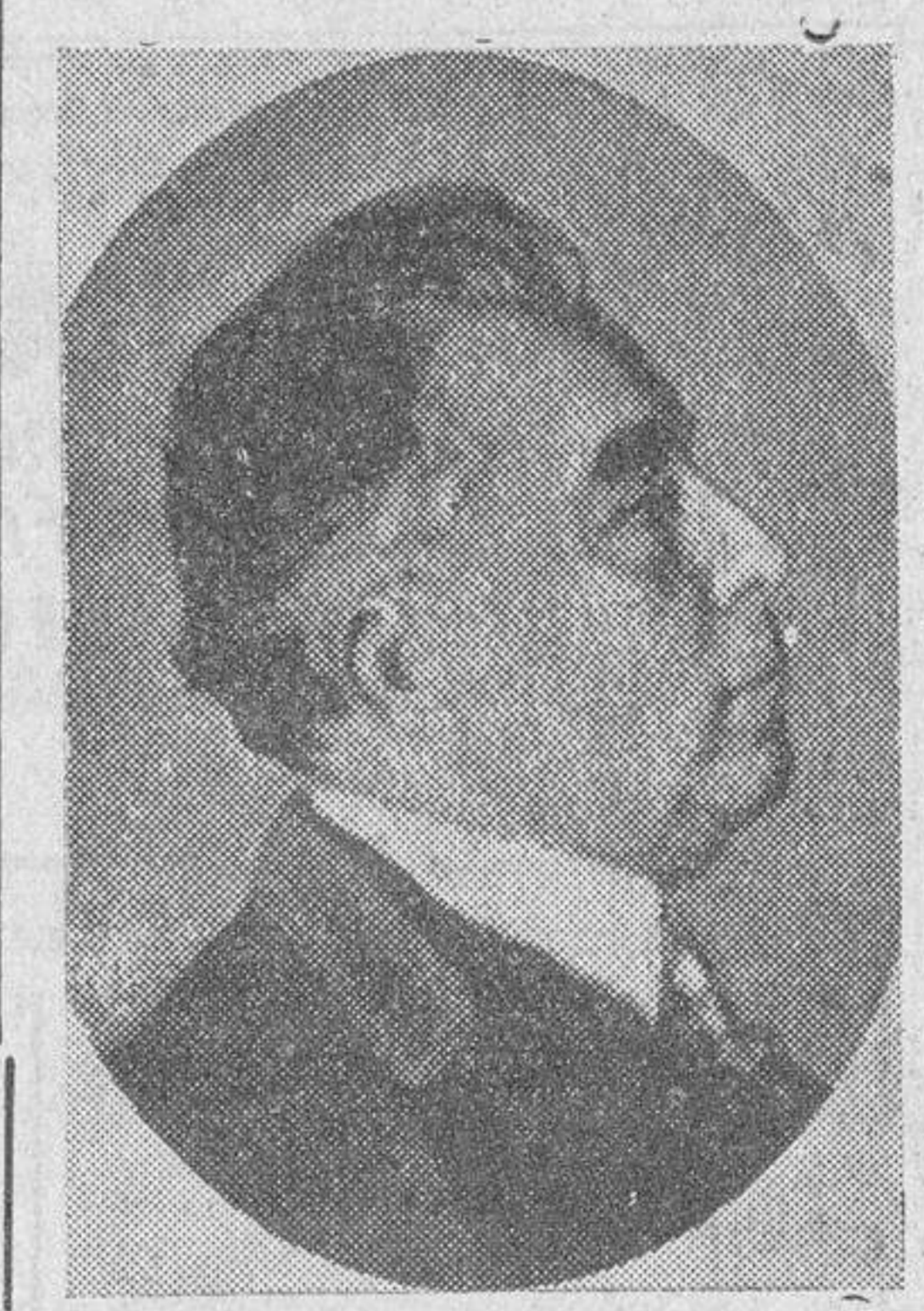
El ilustre poeta peruano don José Santos Chocano, asesinado hace unos días en Santiago de Chile.

El tiempo de aguas parece que no nos quiere dejar, pero se está trabajando en el campo para tenerlo en las mejores condiciones de juego. Hay que ir a verlos contra todo, hay que ir a alentarlos, para que no decaiga el ánimo en nuestro equipo, y veamos esas magníficas jugadas a que nos tienen acostumbrados y que hace que el público se emocione y prorrumpe en aplausos y voces alentando a los jugadores que se olvidan de todo y no piensan nada más que en el juego y ver de hacer goals lo más pronto posible para corresponder a esos aplausos y vitores que el público les tributa para alentarlos. Los jugadores no deben olvidar que todos los socios de la Unión Deportiva desean que se conquiste el primer puesto y que tienen puesto todo su pensamiento en ellos y harán todos los esfuerzos que sean necesarios para ello y que la junta directiva trabaja también y así lo espera de sus esfuerzos. A no olvidar que son necesarios los puntos y a conquistarlos. El partido podrá ser duro, pero esperamos que el árbitro no deje que pase de lo natural, para que el público le aplauda y pueda decir