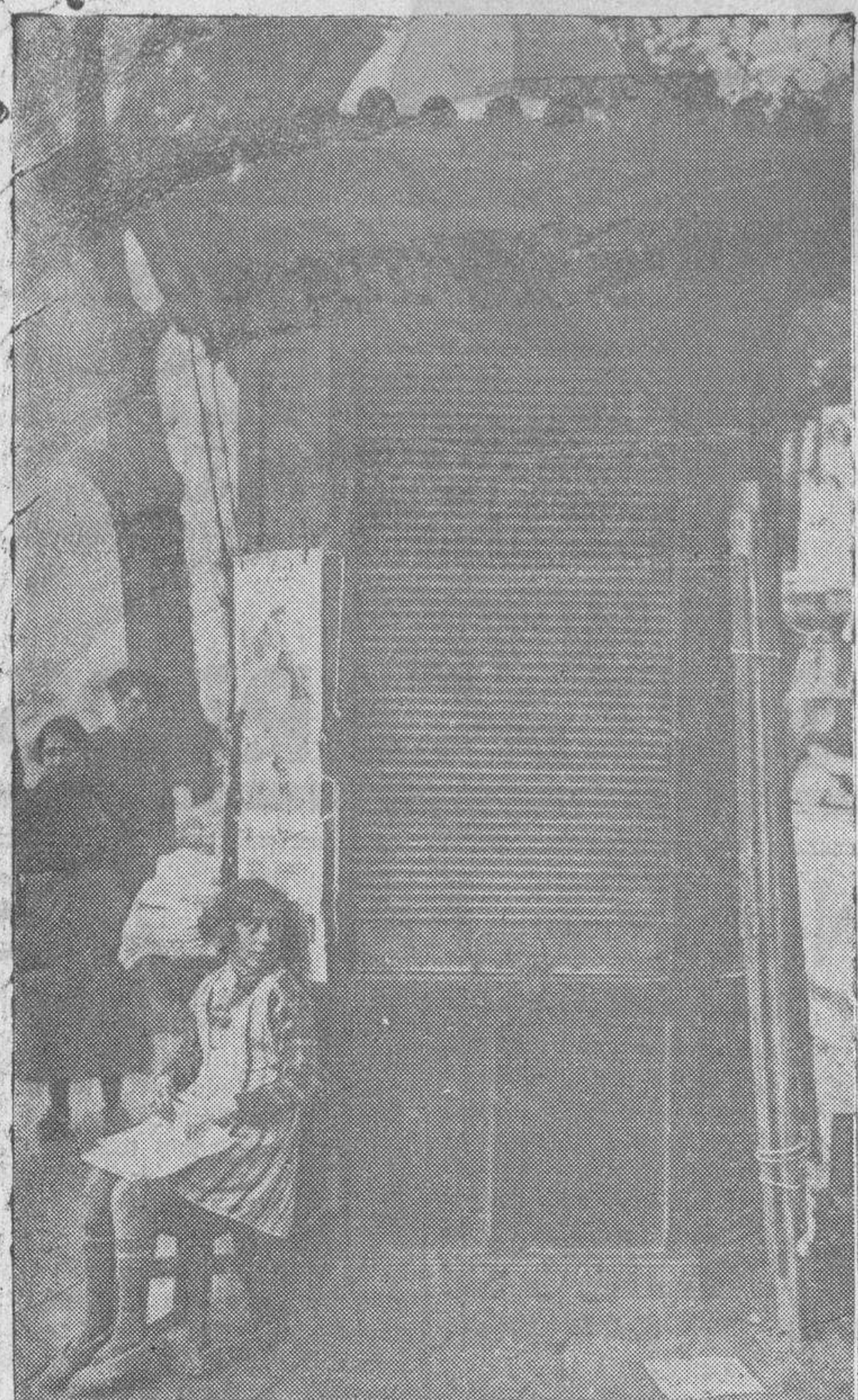
Los kioscos que cerraron su venta al público, por seguirla pasada huelga general, continúan en tal estado, por castigo de la autoridad, obligando a sus dueños a vender en el exterior, soportando las durezas del invierno. La Prensa pide que les sea levantado el castigo.