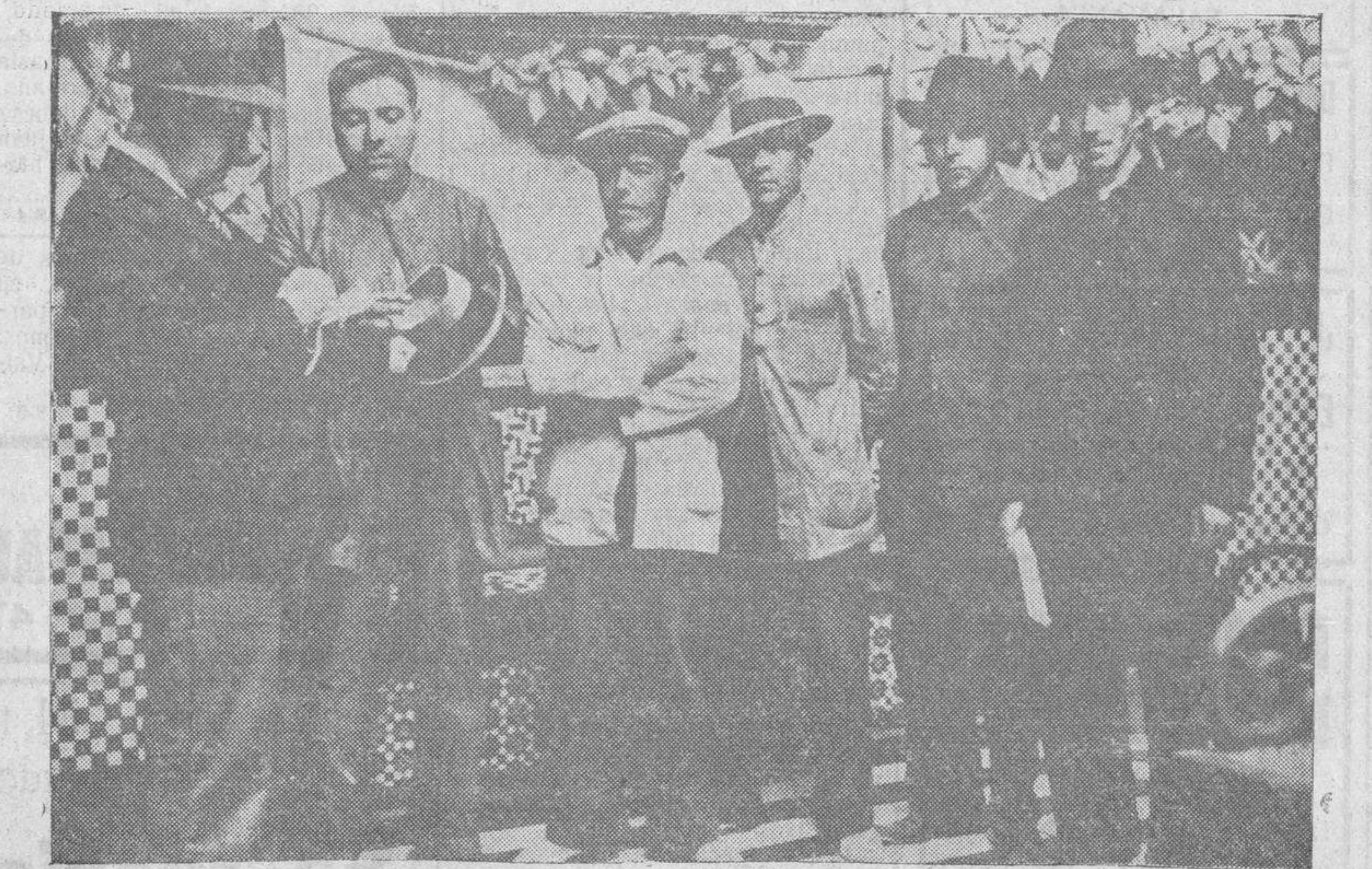
Los obreros sombrereros y millamas que fueron a pie a Madrid a solicitar remedios para la aguda crisis por que, a causa del sin sombrero, atraviesa la industria del sombrero, refieren a un periodista sevillano las impresiones de su viaje

Madrid.—El señor Martínez Barrio conversó esta tarde con los periodistas, a quien manifestó que en unas declaraciones suyas que