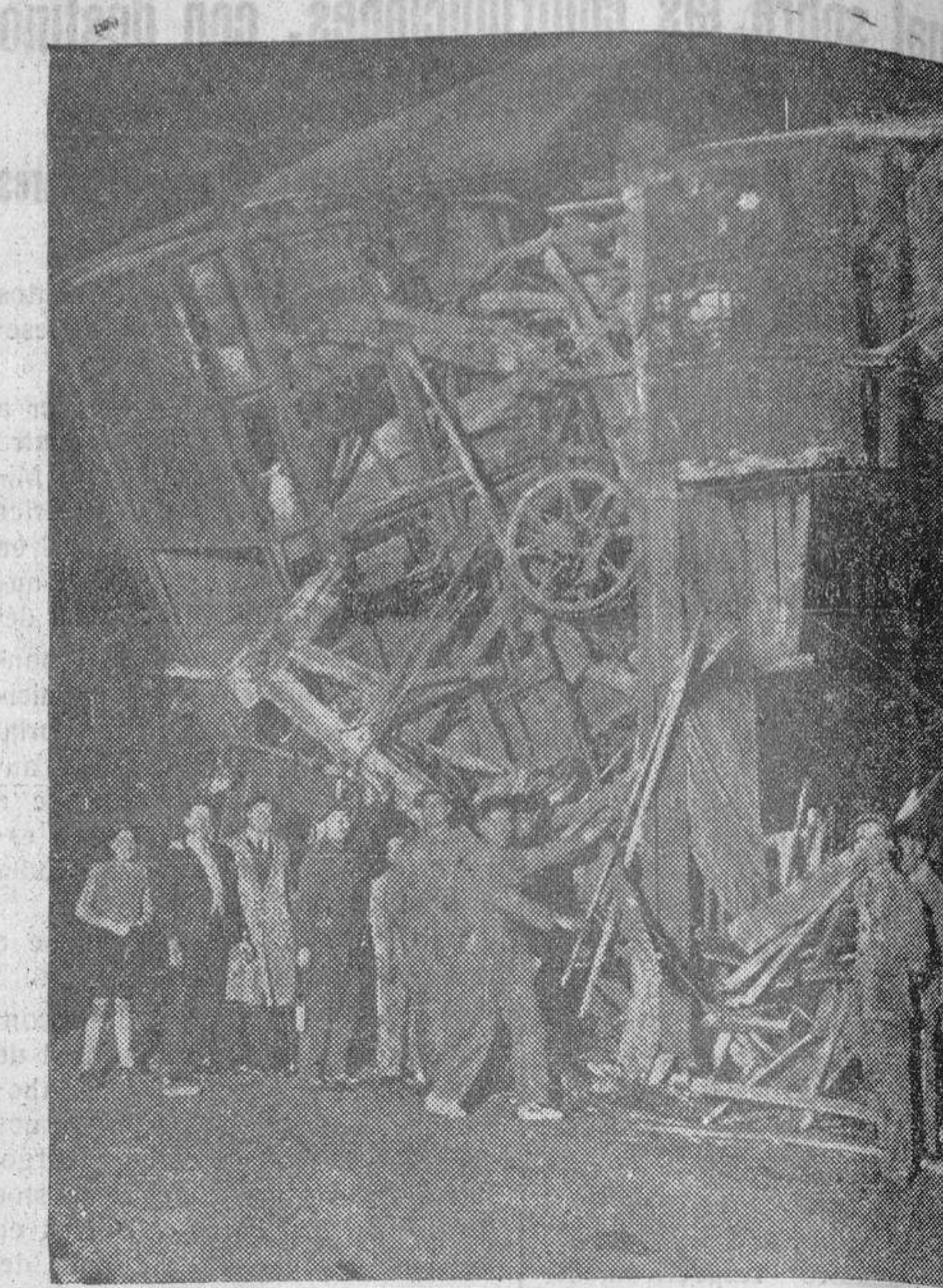
Cuando hacía maniobras en la estación de Cádiz, chocó un tren con otro de mercancías que llegaba procedente de Sevilla, sin que, afortunadamente, ocurrieran desgracias personales. He aquí el estado en que quedaron algunos vagones