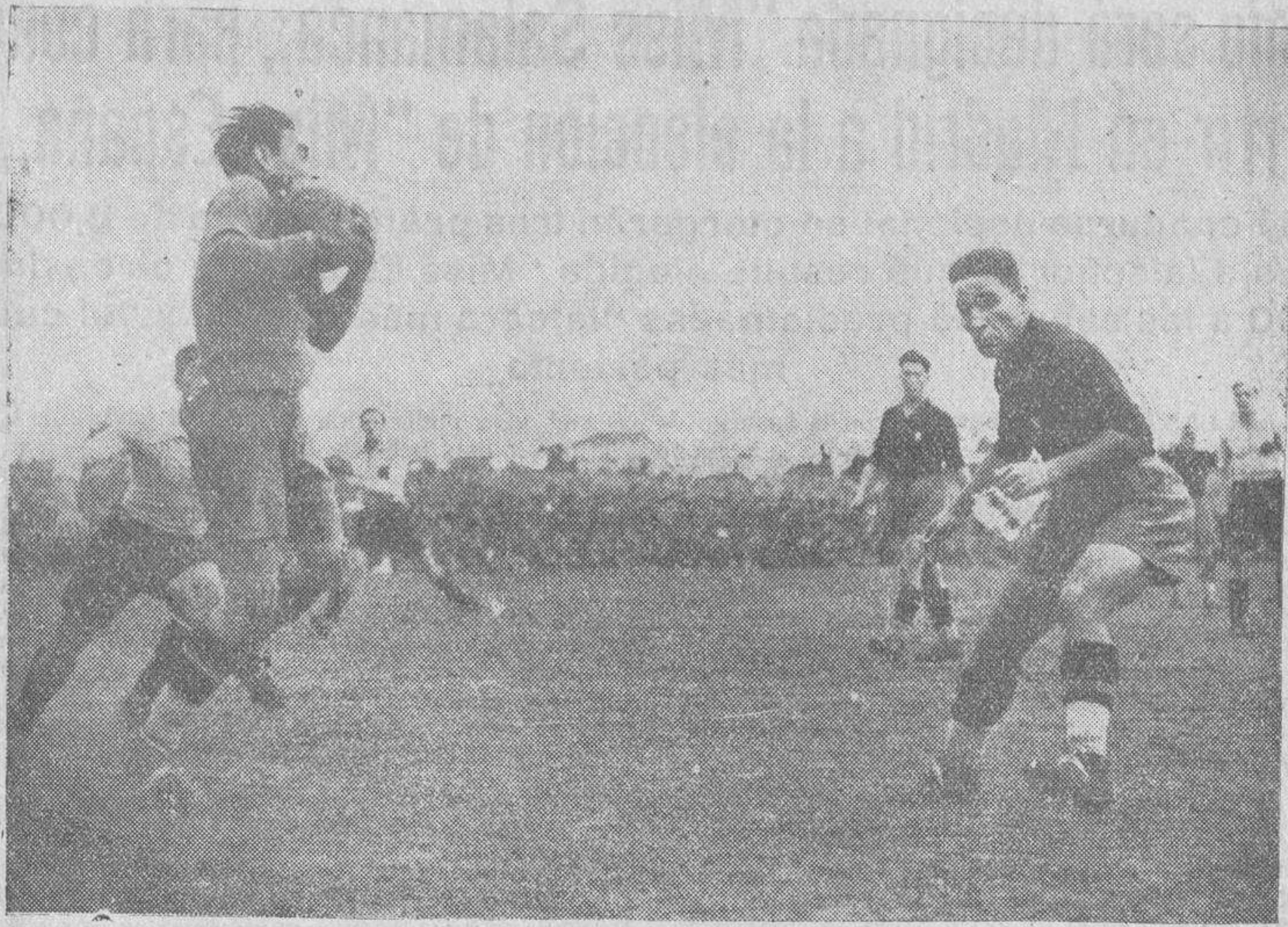
El portugués Amaro blatea fuertemente un balón enviado por Lángrea a la portería en el partido jugado entre nuestro equipo nacional y el lusitano en el torneo de la Copa del Mundo.