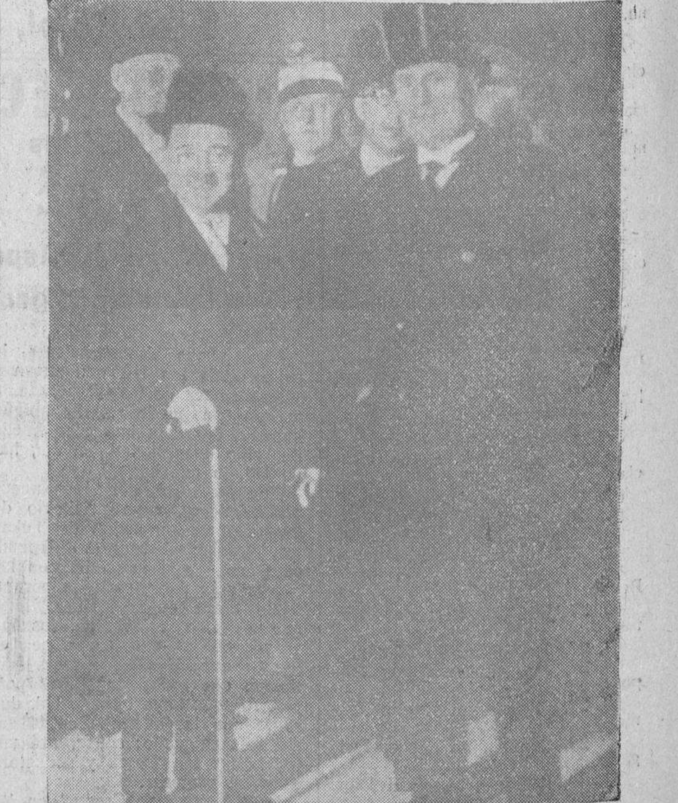
Las figuras de Mussolini y del Canciller austríaco Dollfus, adquieren una mayor actualidad, con motivo de la firma, en Roma, del nuevo pacto entre Italia, Austria y Hungría