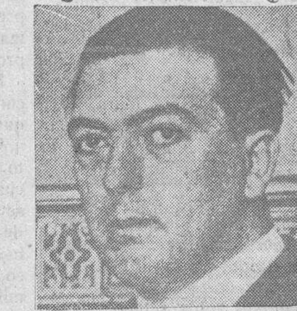
Don Leandro Pita Romero, ministro de Estado

bierno dió cuenta del acuerdo del Gabinete anterior de prorrogar el estado de prevención durante un mes y que los consejeros no habían opuesto ningún reparo, acordándose que el jefe del Gobierno lo pre-