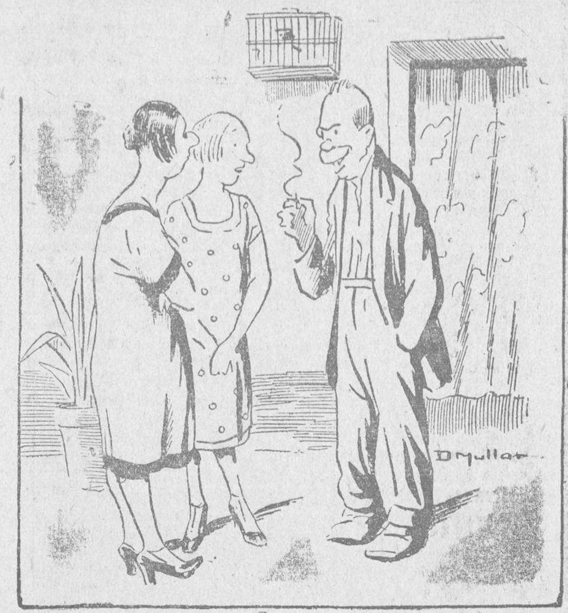
—¿Por qué le da usted a su mujer esas palizas? ¿Es que no congenian? —Ahí está la cosa: que congeniamos demasiado. ¡Los dos queremos mandar!...