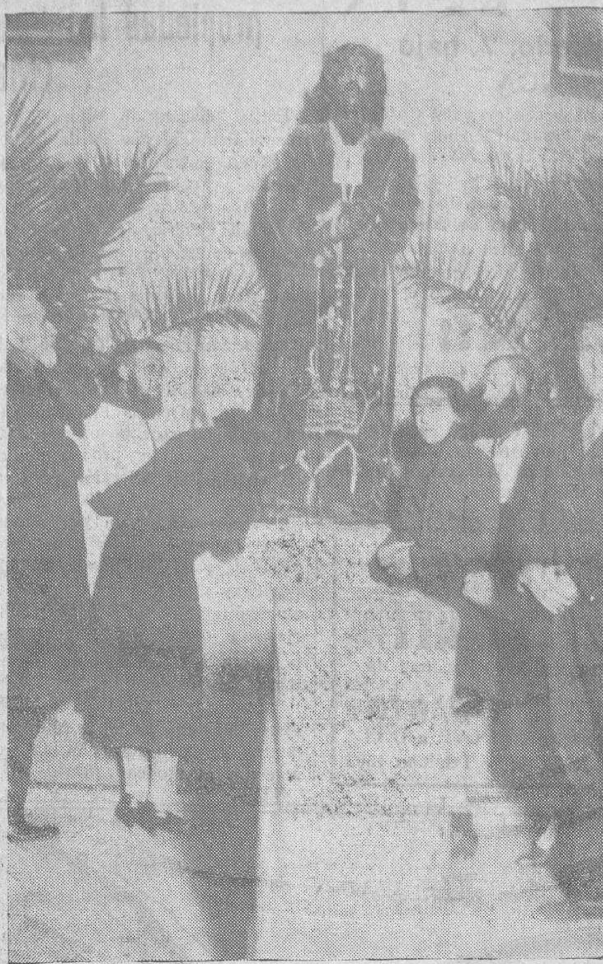
Uno de los muchos devotos que tiene la magnífica imagen, de la que hay la creencia que de tres cosas que se piden concede una, si se le pide con fe, besando los pies de Jesús