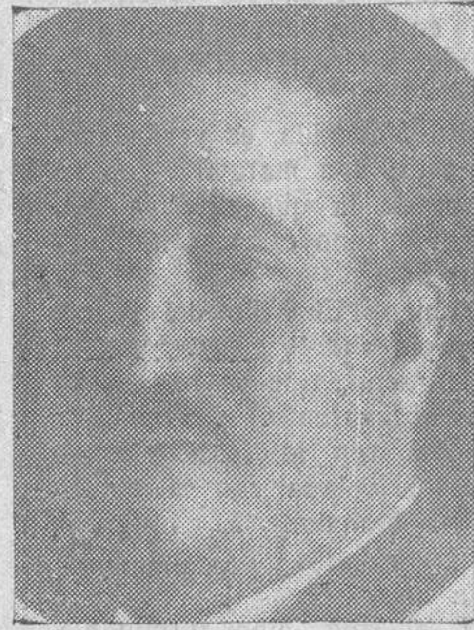
Don Rafael Salazar Alonso, ministro de la Gobernación