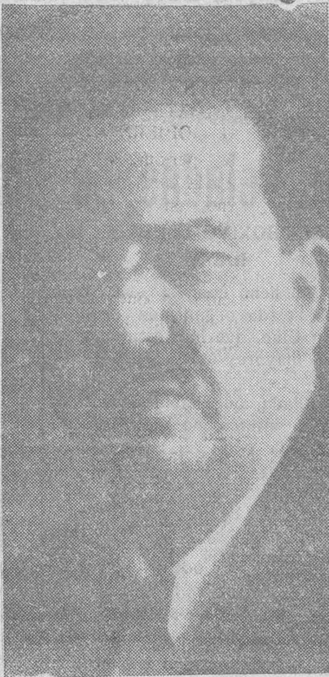
Don Diego Hidalgo, ministro de la Guerra

cambio de impresiones, pues Su Excelencia el Presidente de la República me ha pedido que convoque a Consejo de ministros, el lunes, que será presidido por él. Y el martes nos presentaremos a las Cortes.