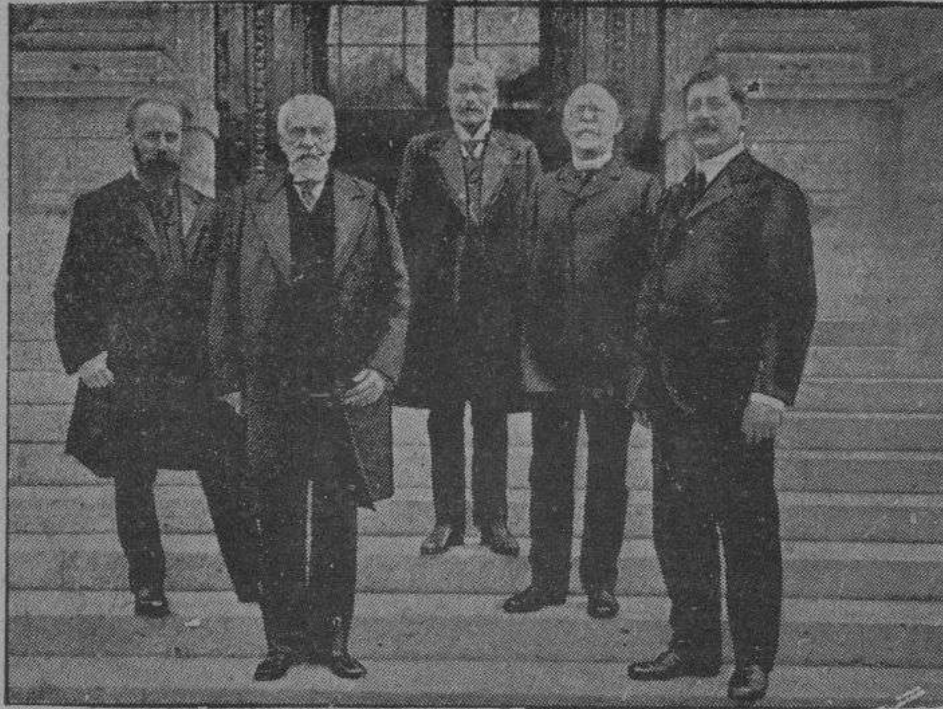
La cuestión del abastecimiento de Suiza