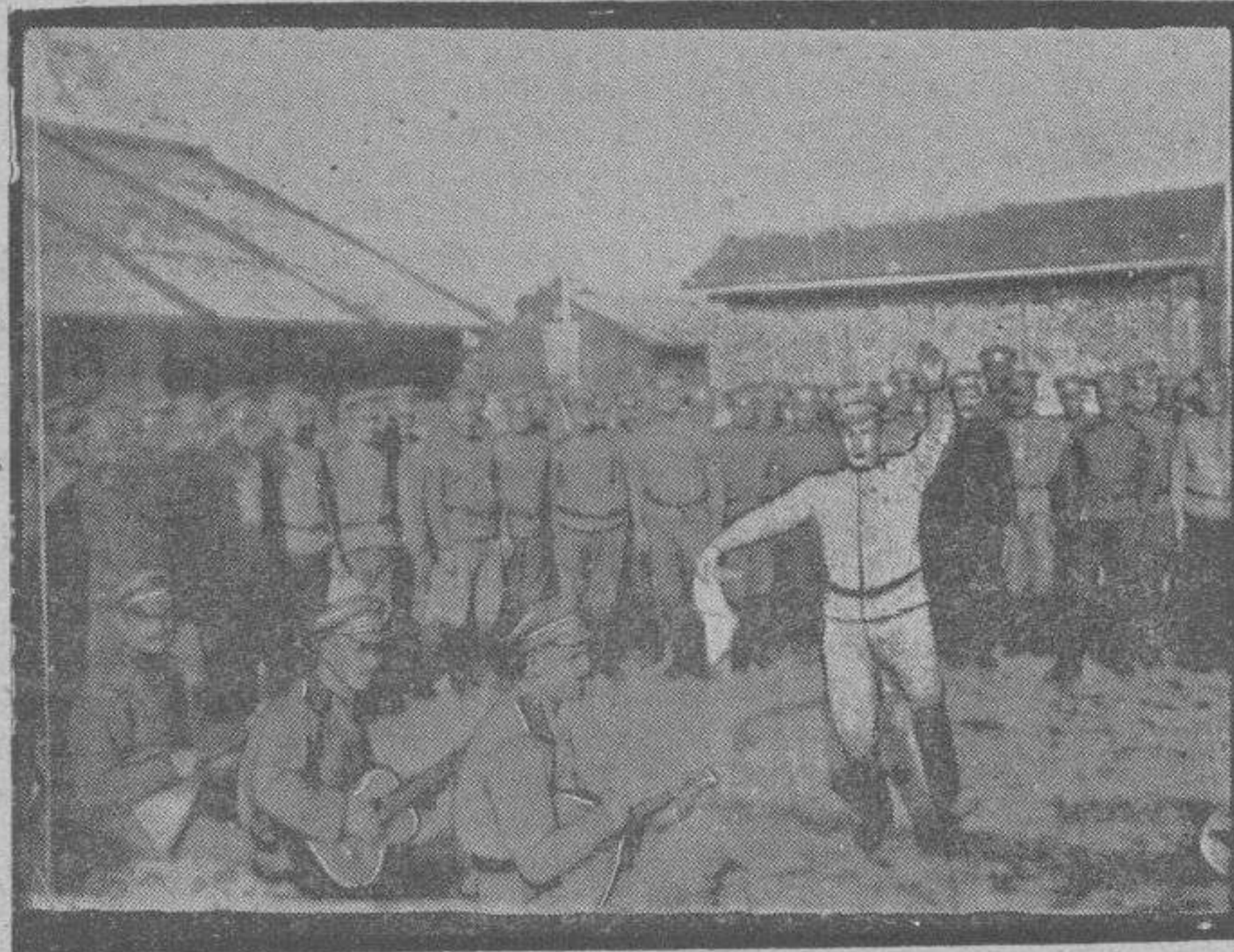
Danza nacional ejecutada por Rusos de los que combaten en Francia.

que la viuda de Urciol consideraba razonable y hasta necesaria. Los chicos se querían. No había más que hacer.