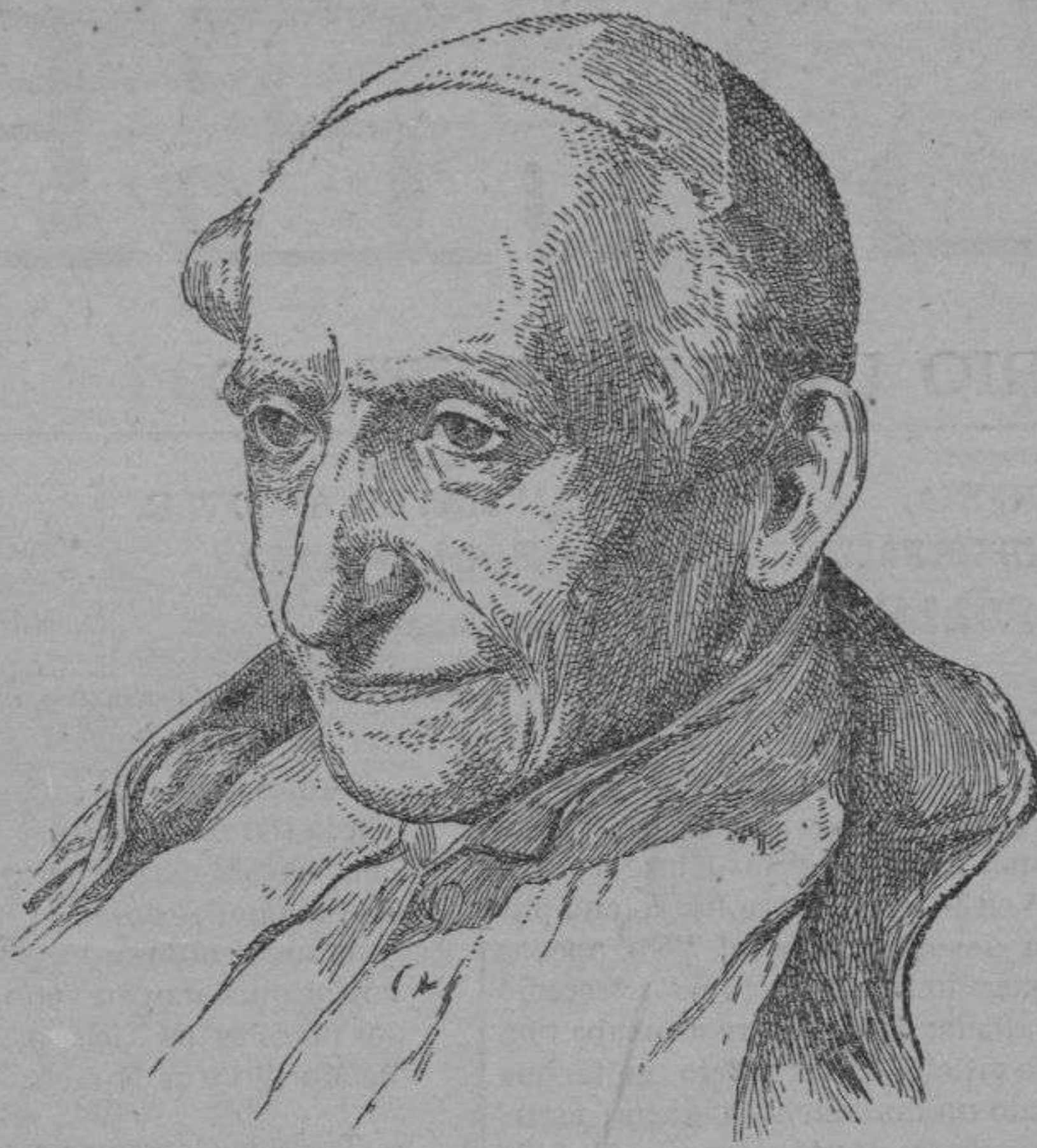
S. S. EL PAPA LEÓN XIII

No puede negarse que el tratamiento propuesto es teóricamente muy razonable y lógico, pero dudamos que llegue á prevalecer sobre el de la limpieza matutina, porque en el campo y en todas partes se cambian con dificultad los hábitos inveterados.