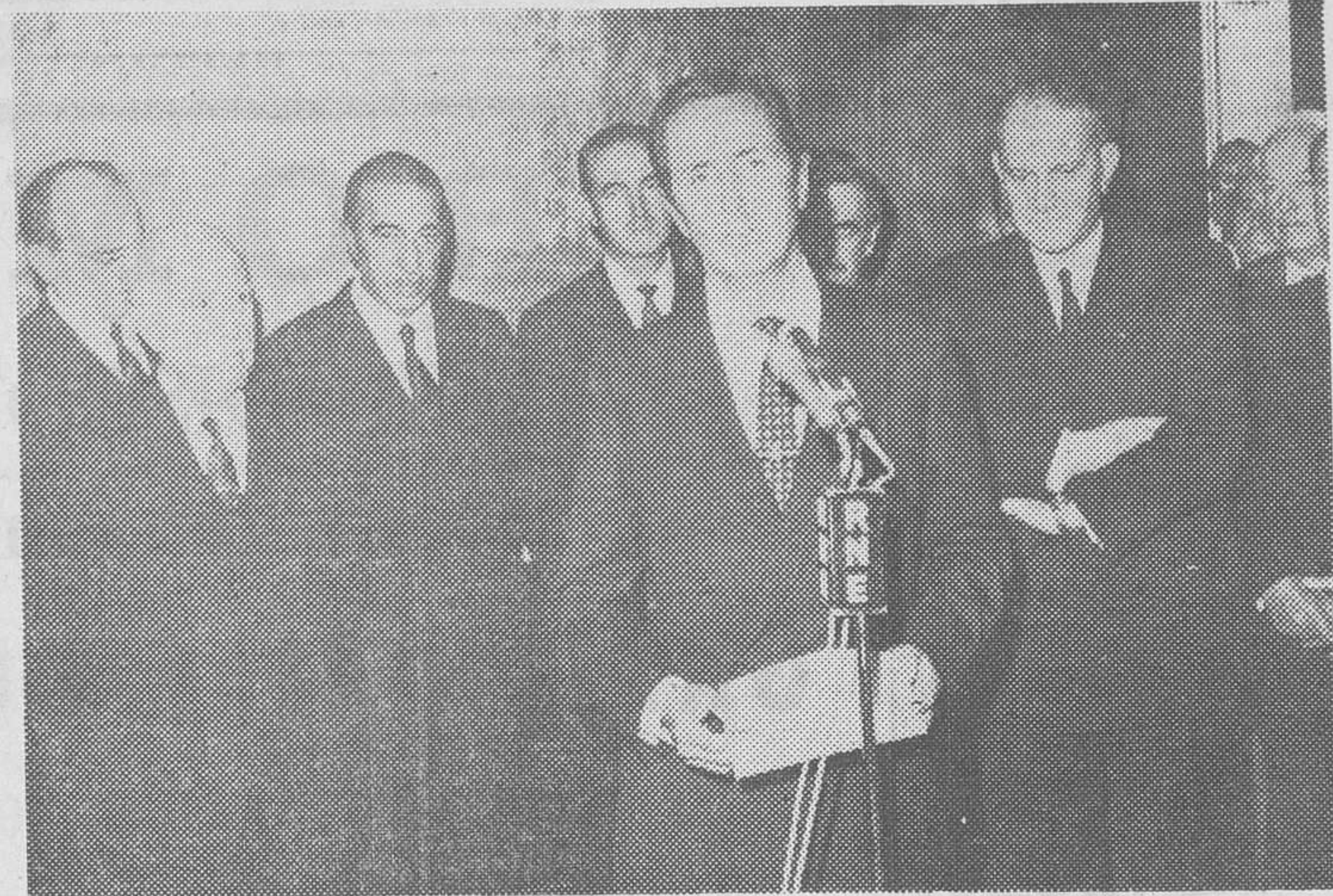
En primer plano, don Gregorio López Bravo, en el acto de toma de posesión de la cartera de Asuntos Exteriores. A la derecha, el ministro cesante, don Fernando María Castiella

nacionalmente reconocida soberanía española sobre el Peñón. Se entiende que podrá llegarse a un acuerdo que fije condiciones de tiempo o forma en cuanto a la reivindicación española. Pero todo eso está por ver y se lleva por ahora en el mayor secreto, sin que puedan concederse crédito absoluto a las especulaciones de la Prensa británica en torno a este asunto. Una intensificación de las relaciones diplomáticas y comerciales hispano - británicas pueden empezar a constituir la base para un entendimiento en el tema gibraltareño. A este respecto, y en cuanto a lo que a política exterior del nuevo Gabinete español se refiere, cabe señalar las reiteradas veces en que sus más autorizados ministros han hecho hincapié en que a España le interesa muy especialmente Europa y, por ende, el intercambio cultural y el económico que pueda derivarse del buen curso que siguen las conversaciones con el Mercado Común por la firma de un tratado preferencial sobre las compras y ventas españolas con los «Seis», acuerdo que, si no hay entorpecimientos por ahora imprevisibles y que se presentan como improbables, podrá estar concluido antes del verano próximo.