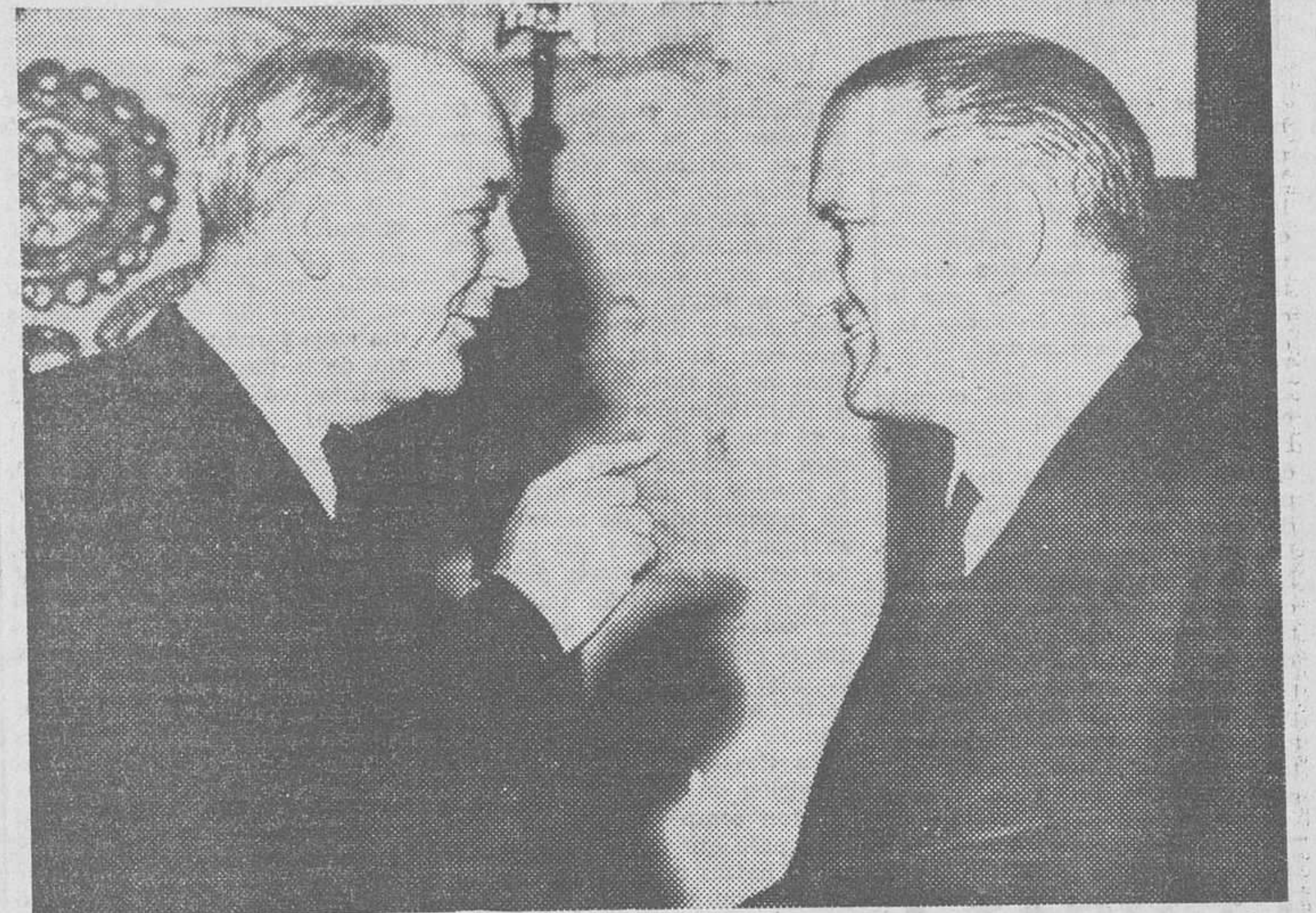
A la derecha, el ex-ministro de Asuntos Exteriores, don don Fernando María Castiella, en una conversación con su colega norteamericano, Dean Rusk, en uno de sus numerosos viajes a Estados Unidos, con motivo de las negociaciones sobre las bases conjuntas hispano-norteamericanas cuando ocupaba el mencionado Departamento.