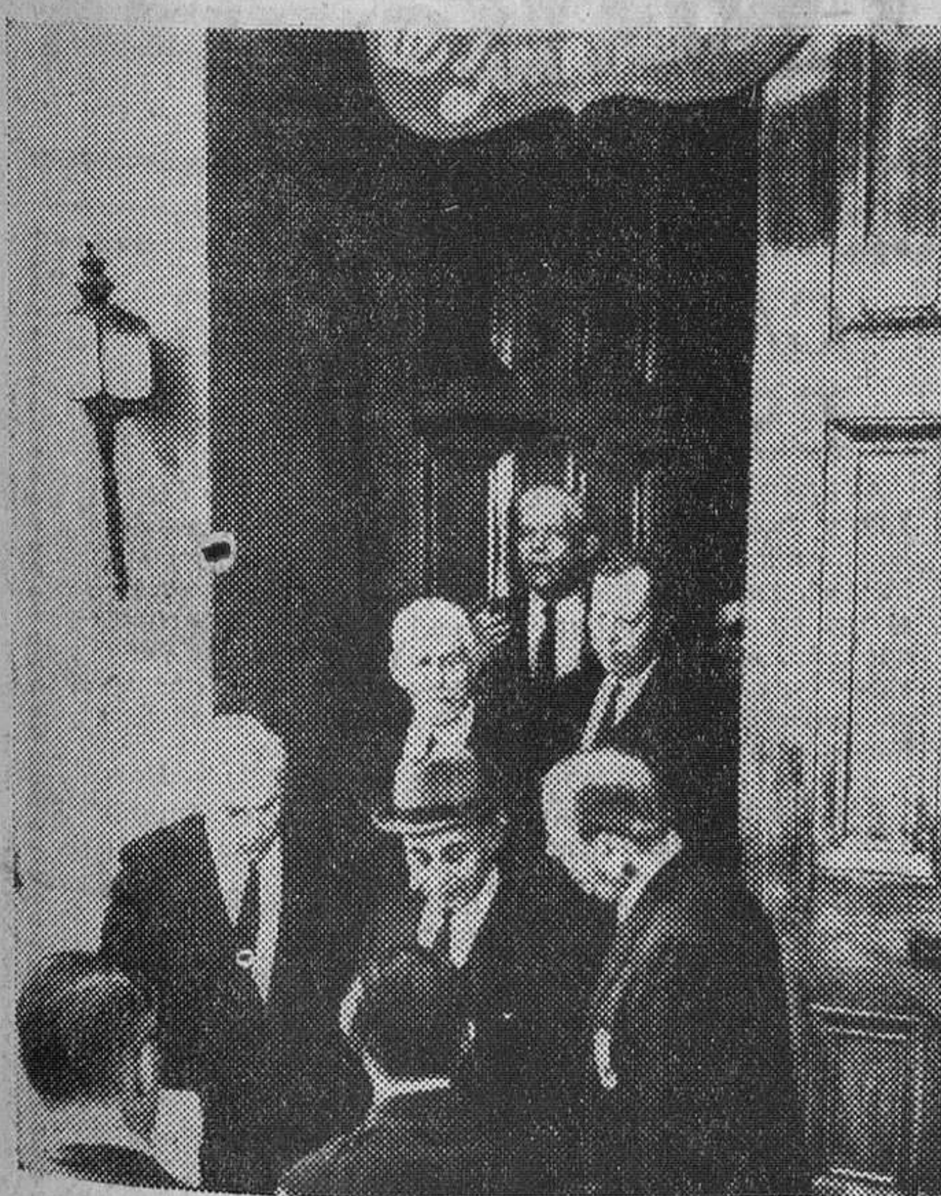
Nueva Orleans.—Mientras Clay Shaw espera, con el sempiterno cigarrillo en la mano, el testigo Charles Spieser (primer plano, con sombrero), dice al juez Edward Haggerty (izquierda) manifestaciones sobre sus anteriores declaraciones en el apartamento del barrio francés, donde testificó que se encontró a Clay Shaw en el verano de 1963. El juez prefirió trasladarse aquí, en el juicio por el asesinato de Kennedy, para refrescar la memoria.