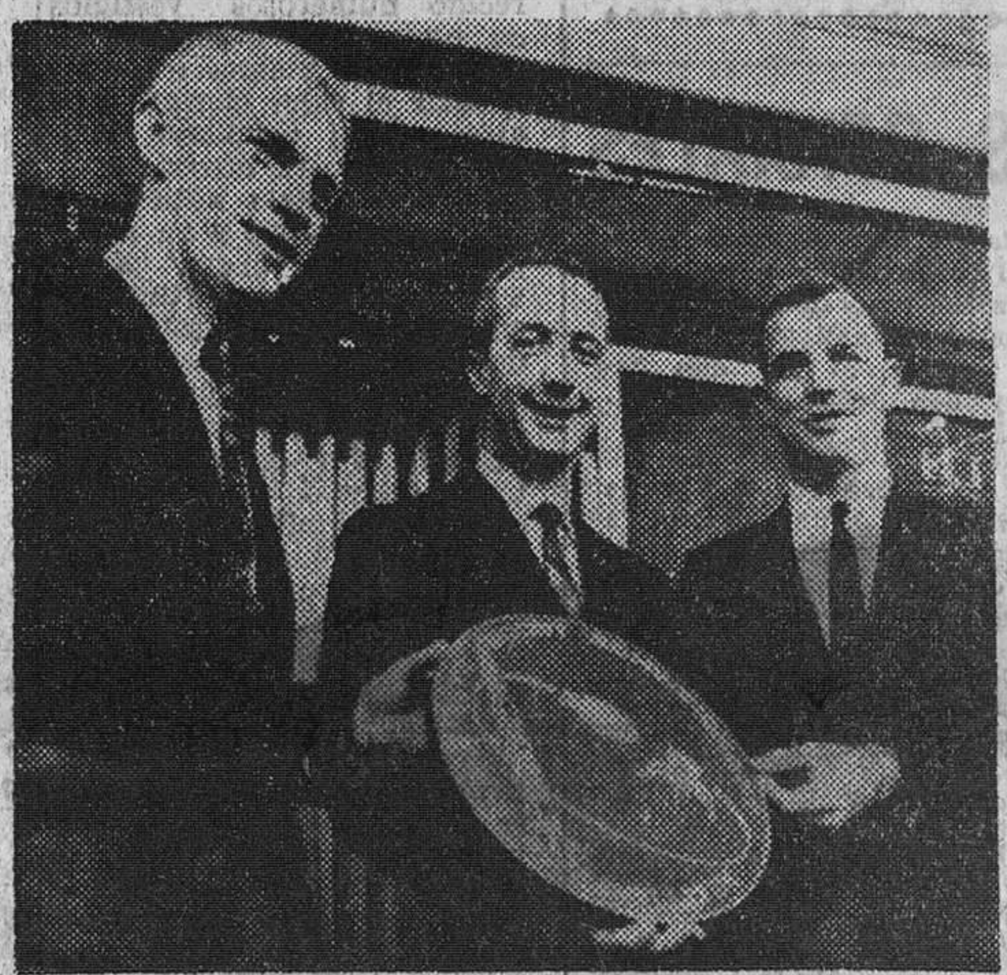
Centro espacial de Houston (Texas). — Los tripulantes del «Apolo 9», Russell Schwickart, Jim Mc Divitt y Dave Scott, muestran el emblema de su misión, que es una placa circular con el cohete Saturno y el módulo del «Apolo 9» girando en su torno. Durante el vuelo, Schwickart abandonará la cápsula para trasladarse al módulo y realizará pruebas sobre la posibilidad de aterrizaje en la Luna.