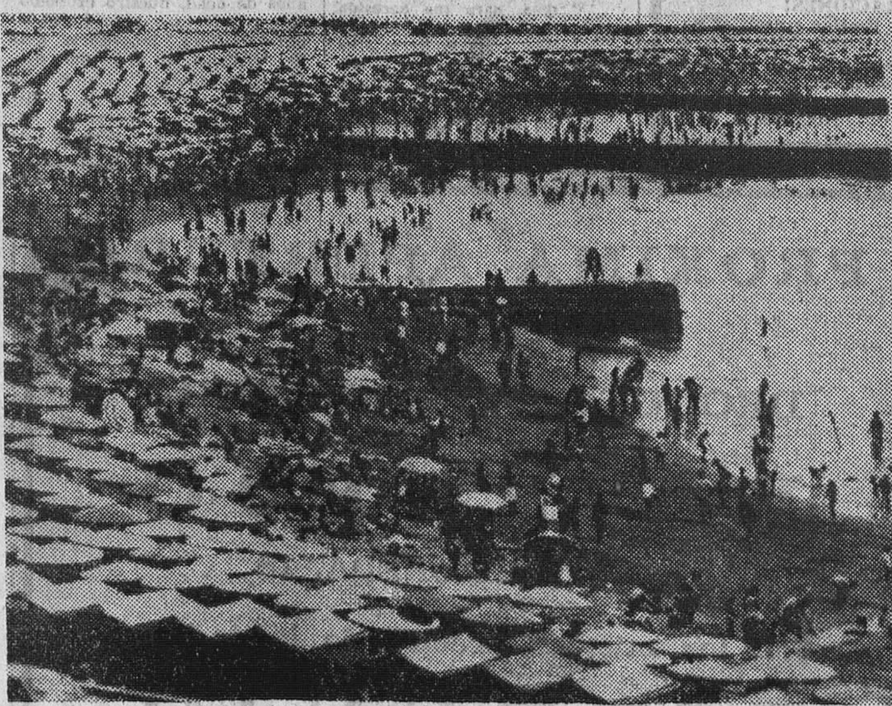
Buenos Aires.—En Argentina es verano. Miles de argentinos abarrotan las playas del Mar del Plata, buscando un alivio del calor. Se bañan en las frías aguas del Atlántico y cuando no lo hacen buscan la sombra bajo las sombrillas, parasoles y casetas.