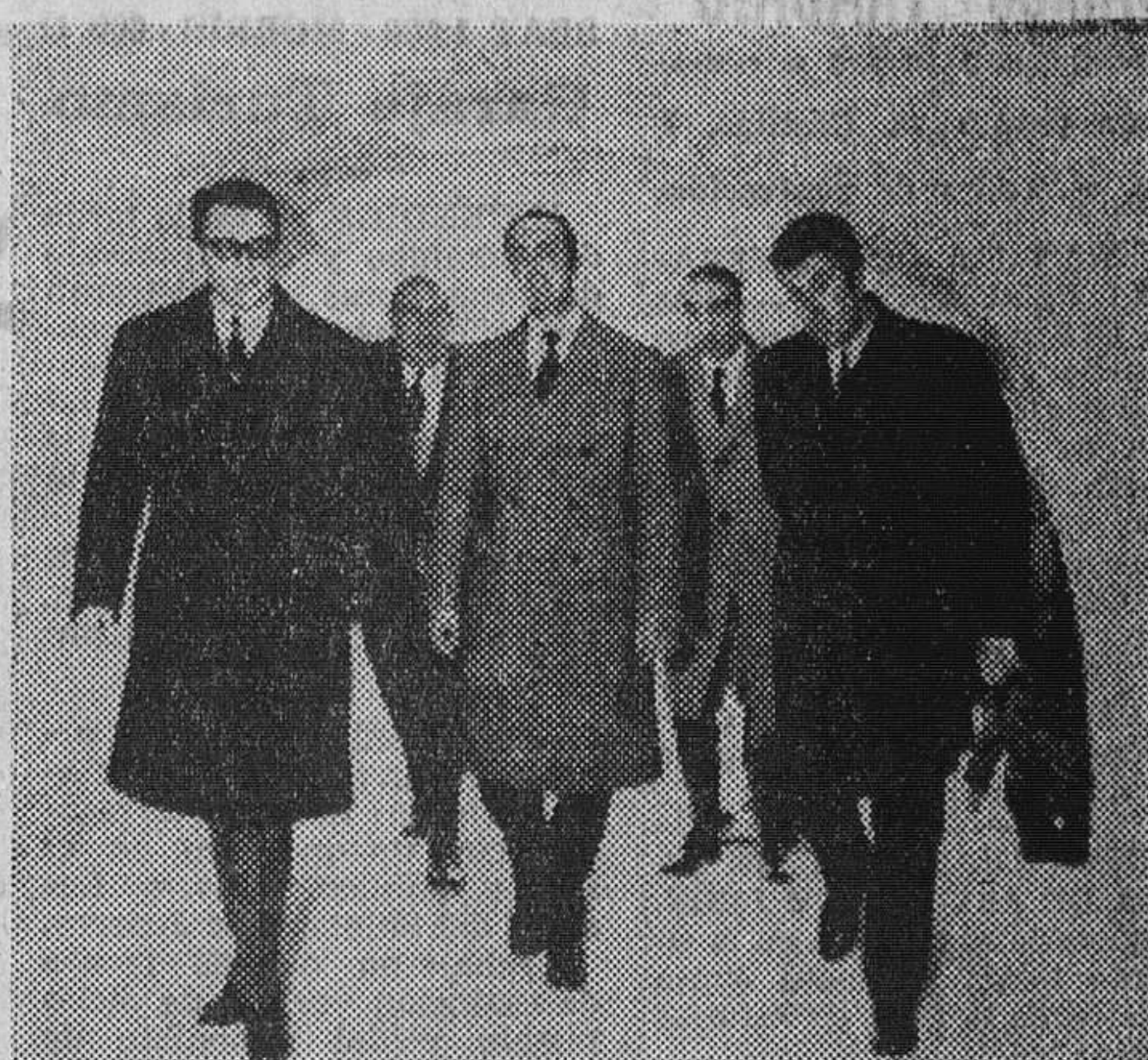
Barcelona.—El ministro de Industria, señor López Bravo, durante la visita efectuada a la zona franca, en donde visitó las obras de la estación y colector de aguas.