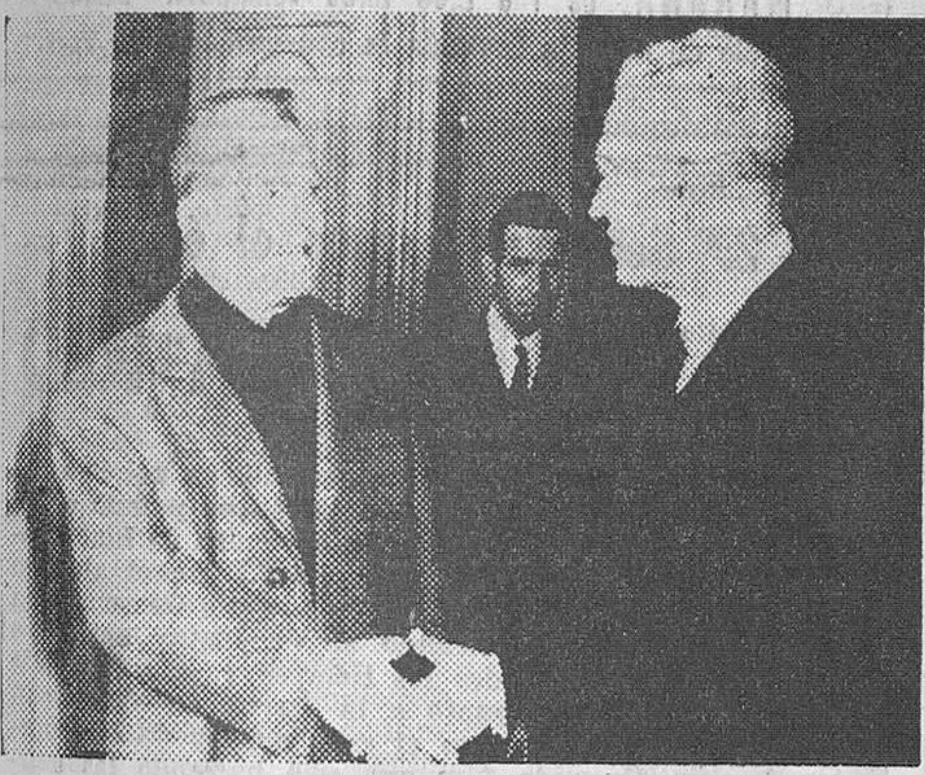
París. — El ministro de Asuntos Exteriores de la República Federal alemana, Willy Brandt (izquierda) y su colega francés Maurice Couve de Murville, se saludan después de una reunión en el Quai d'Orsay.