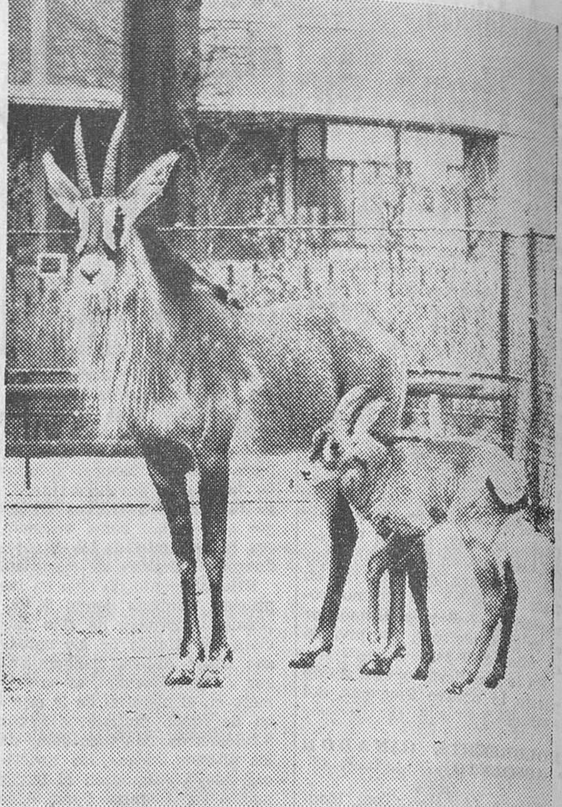
Hannóver. — Este bebé animadísimo de antílopes de caballo no sospecha que representa una sensación zoológica. Es el primer ejemplar de su género que nació en el cautiverio, o sea en el jardín zoológico de la ciudad ferial de Hannóver. Sus padres se importaron hace dos años y medio de África y se aclimataron asombrosamente. El pequeño y sus padres son ahora la atracción principal del zoológico.