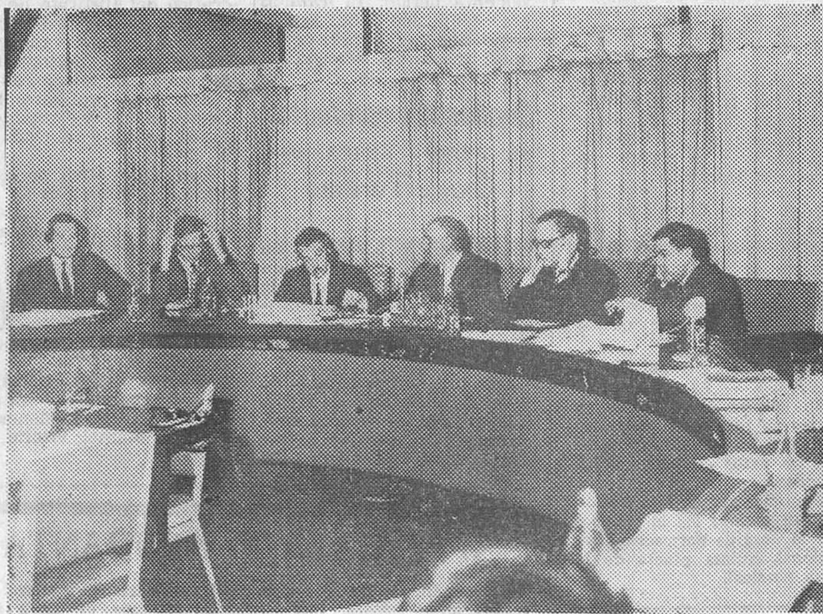
Madrid. — El Comité Asesor Económico e Industrial (B. I. A. C.) cerca de la Organización de Cooperación y Desarrollo Económico, ha celebrado una reunión en la sede del Consejo Nacional de Empresarios, en la Casa Sindical. Un momento del acto.