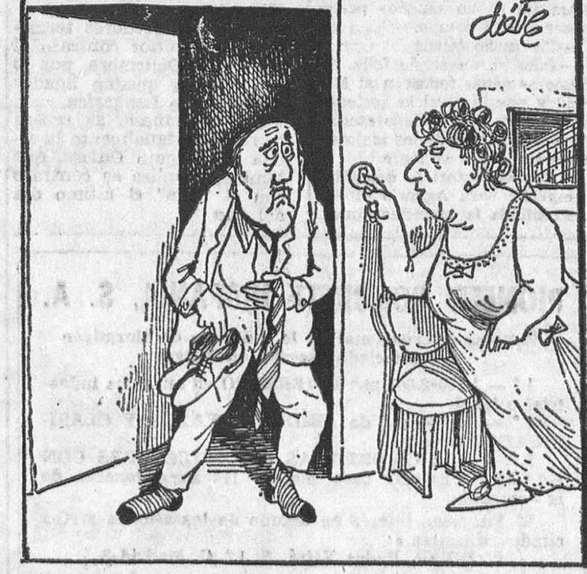
—¿Pero no comprendes que si vienes tarde a casa puede subir tu cifra de «colesterol»? —¿Dónde residía el barón?

SOLUCIONES AL CRUCIGRAMA: HORIZONTALES. — 1: Cautivar. — 2: Atracar. — 3: Rápidos. — 4: Salen. Mo. — 5: Aves. Mal. — 6: Mes. Pita. VERTICALES. — 1: Ca. Samos. — 2: Atravesara. — 3: Urales. Non. — 4: Tapes. Coma. — 5: Icen. Parar. — 6: Val. Mirona. — 7: Aromáticos. — 8: Solaz. Se. AL JEROGLIFICO: Al toro A LOS SIETE ERRORES: Lamparita (3), asa de la taza, lazo, mejilla del señor y azucarero.