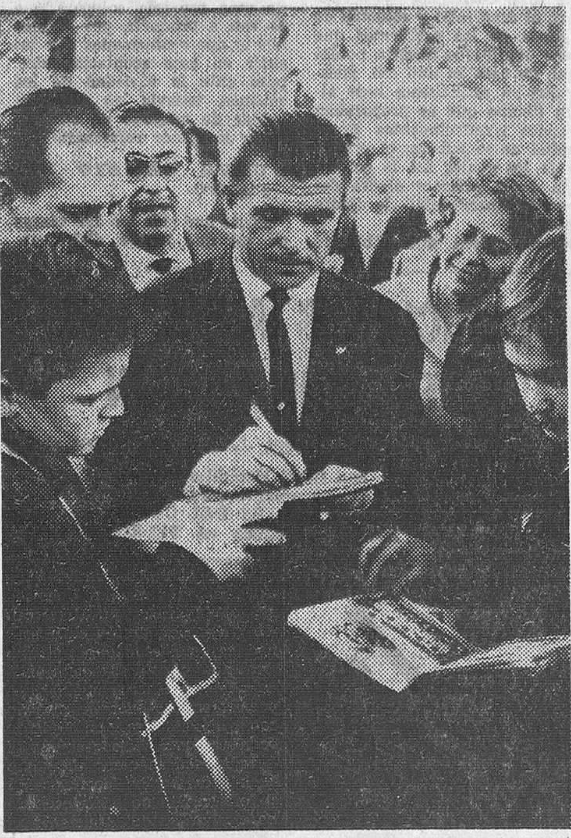
Puskas, ya retirado, sigue teniendo muchos admiradores. Prueba de ello es esta escena captada en el barrio del Niño Jesús, donde habita el famoso as del balompié.

hacer fútbol— pero no gigantes. —¿Cuajará allí el fútbol? —¿Por qué no? He estado en Estados Unidos en tres ocasiones. Puedo decir que al público le gusta tanto como el beisbol... Bueno, un poco menos, pero le gustará mucho más cuando sean muchos más los que lo practiquen. Ya se enseña en los colegios ¡Cuajará! —¿...? ¡Cuajará! Un poco "lechera" ha salido la "cuestión", pero "vale".