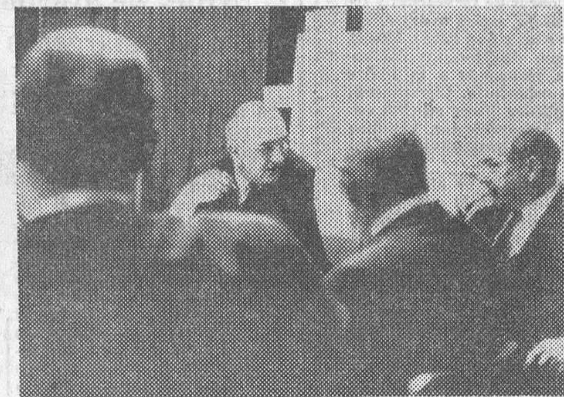
Washington. — El presidente Johnson conferencia con los altos cargos de su Gobierno en la Casa Blanca sobre la crisis de Oriente Medio.