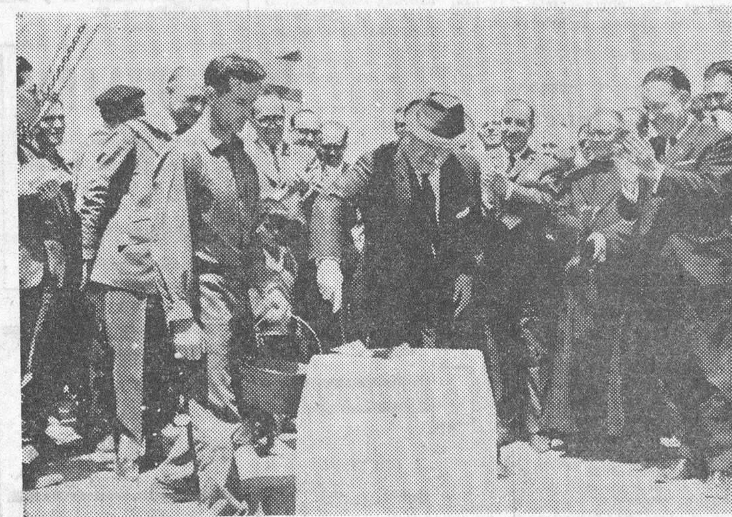
El Polígono de Villanueva empieza a adquirir fisonomía industrial. A una fábrica ya en avanzado período de construcción, le sucedió otra que se anuncia como importante. Trátase de «Hispanagar», cuya primera piedra fue colocada por el director general de Pesca Marítima, a quien se le ve en la fotografía de «Fede» que reproducimos. — (Información en sexta página).