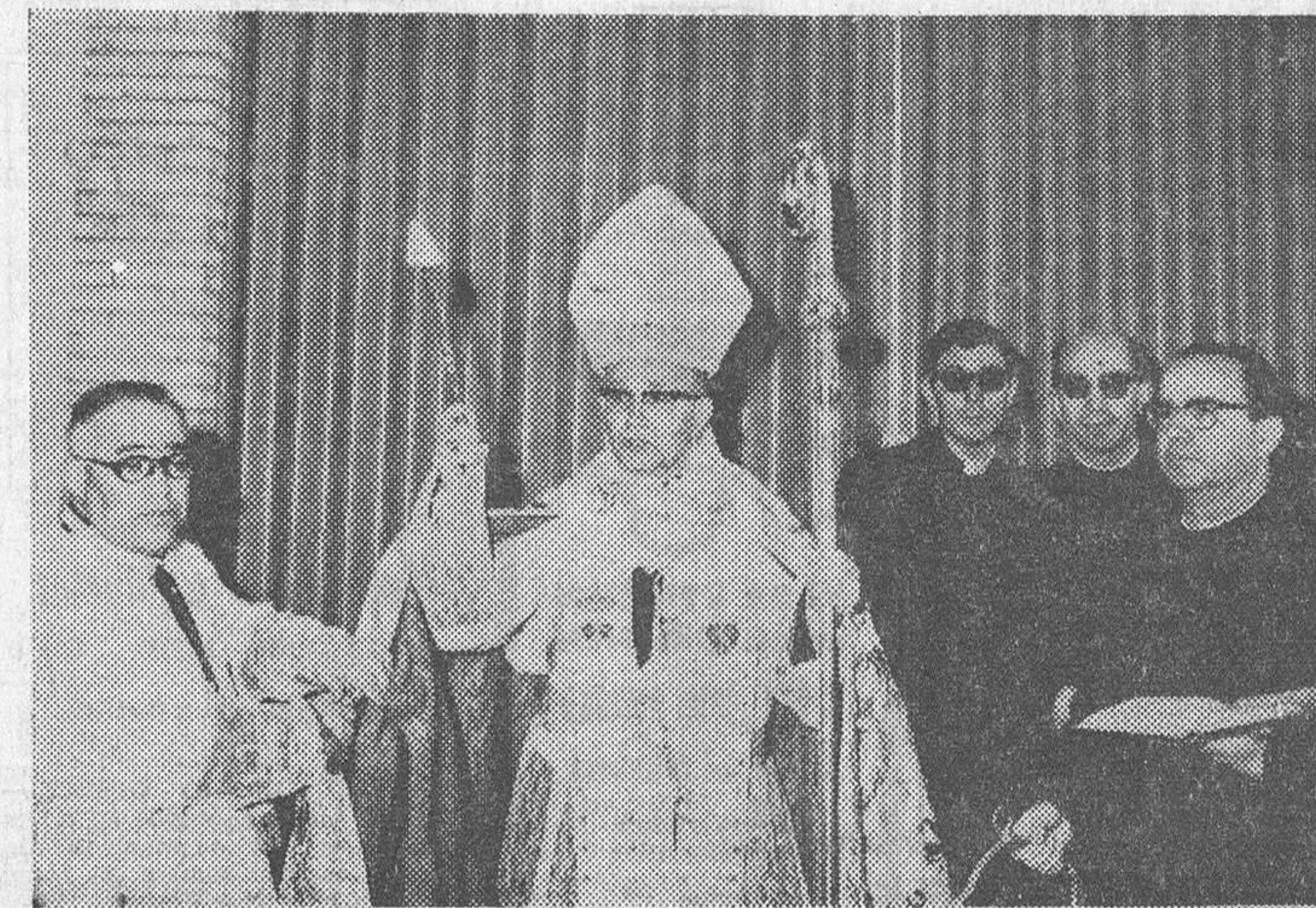
El domingo tuvo lugar en nuestra ciudad la inauguración del Colegio Menor «Santa María». En la fotografía un momento de la bendición, efectuada por el Prelado de la diócesis. (Información, en sexta página).