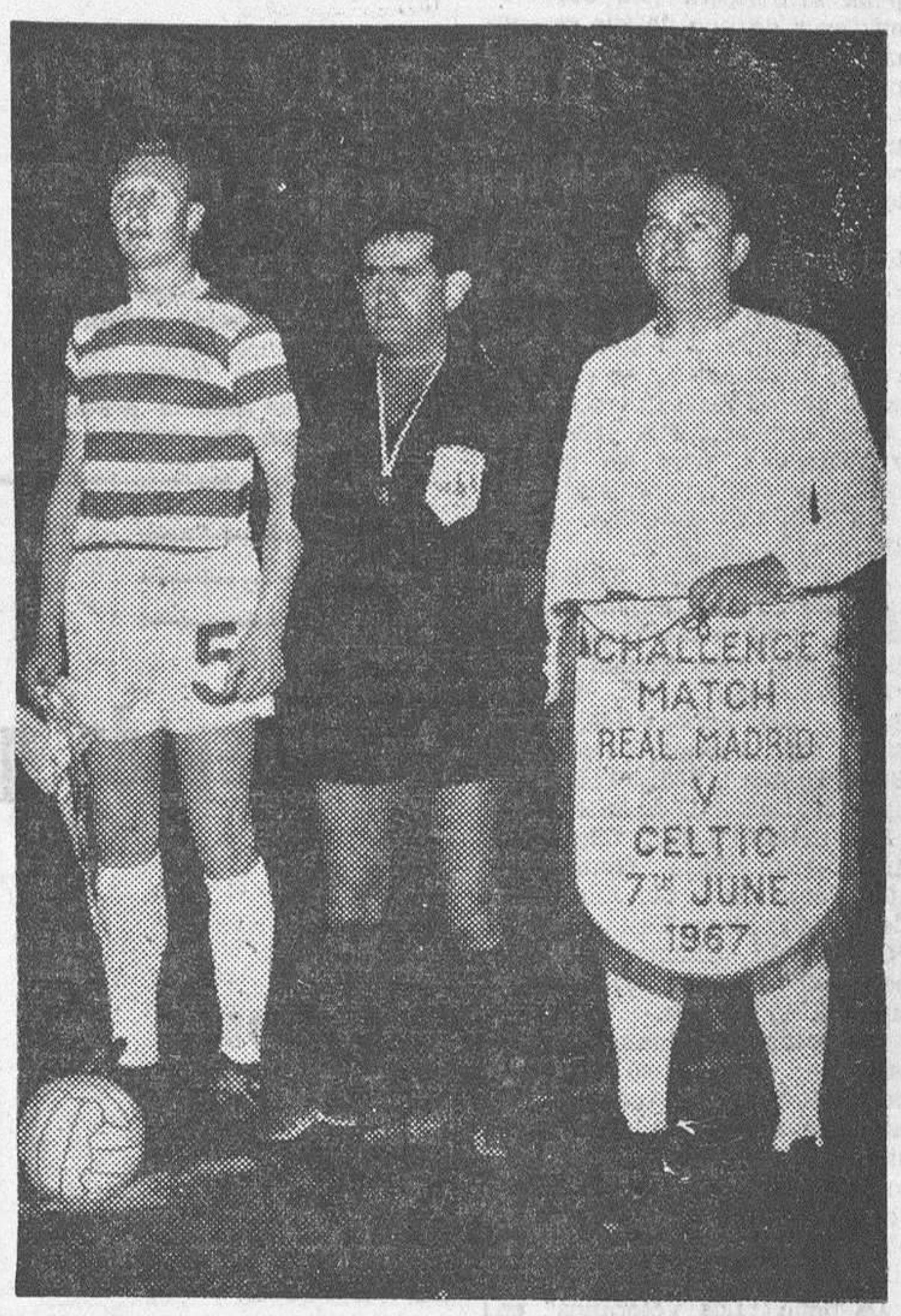
Con gran partido de homenaje, el Real Madrid ha despedido oficialmente a su ex-delantero centro, el famosísimo Alfredo Di Stéfano...