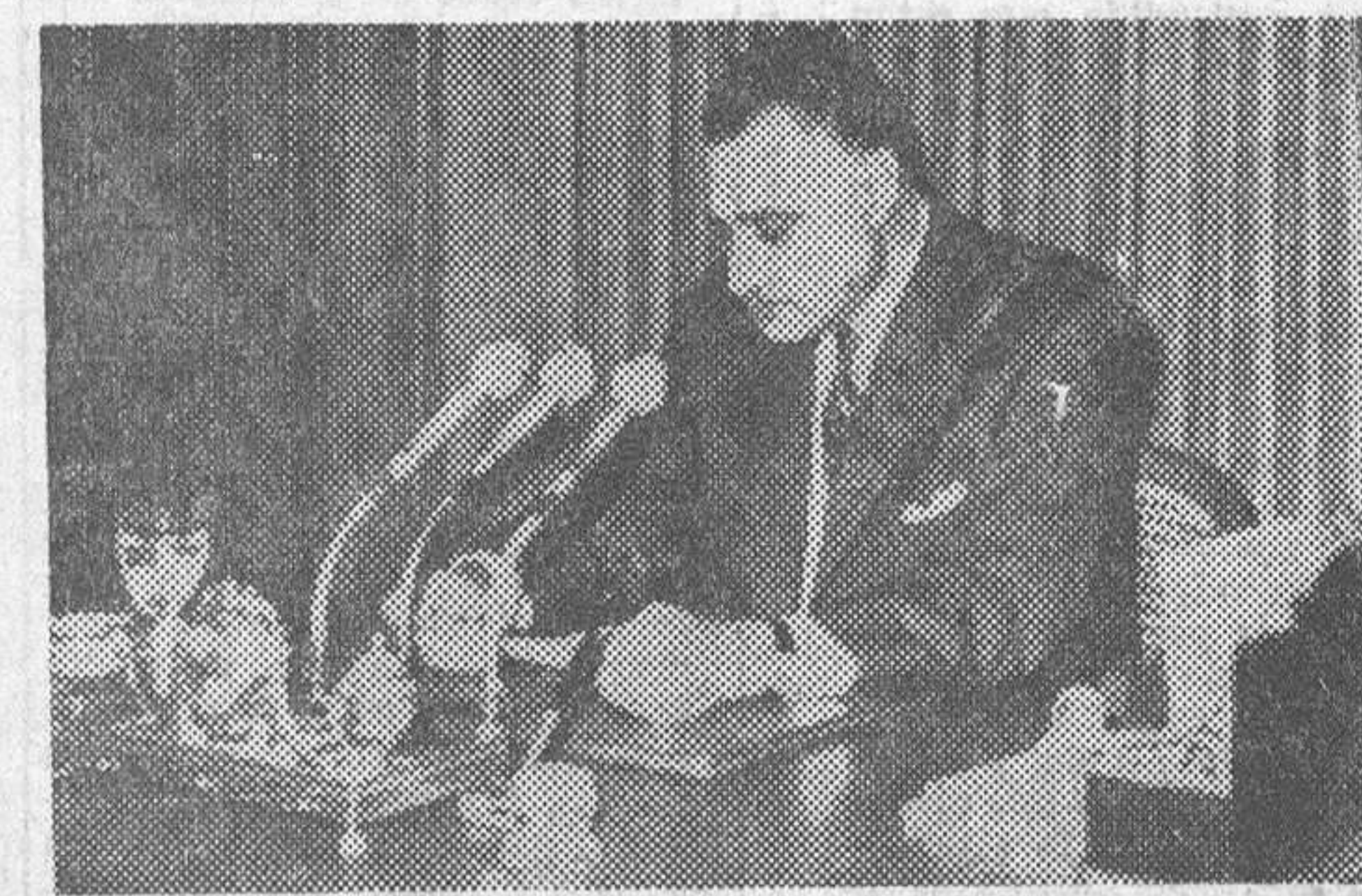
El Cairo. — El presidente de la RAU, Nasser, dirigiéndose a la nación egipcia, en su alocución televisada, ofreciendo su dimisión — que luego retiró — tras aceptar la responsabilidad por la derrota de la RAU en el conflicto bélico israelí.