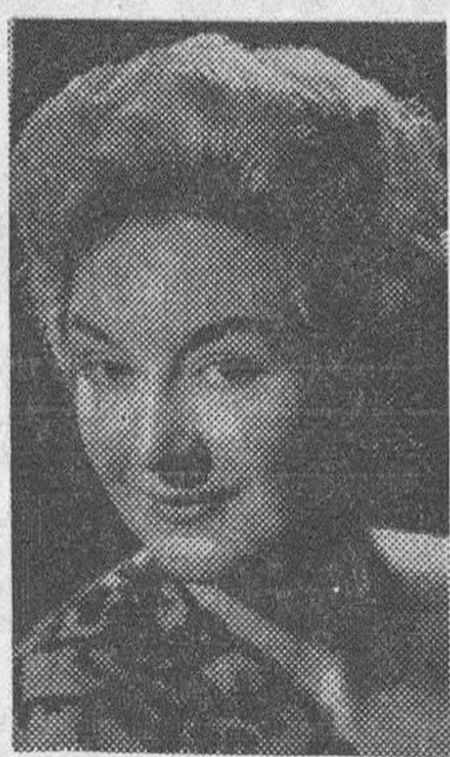
Marta Santa-Olalla, famosa actriz y cantante madrileña.