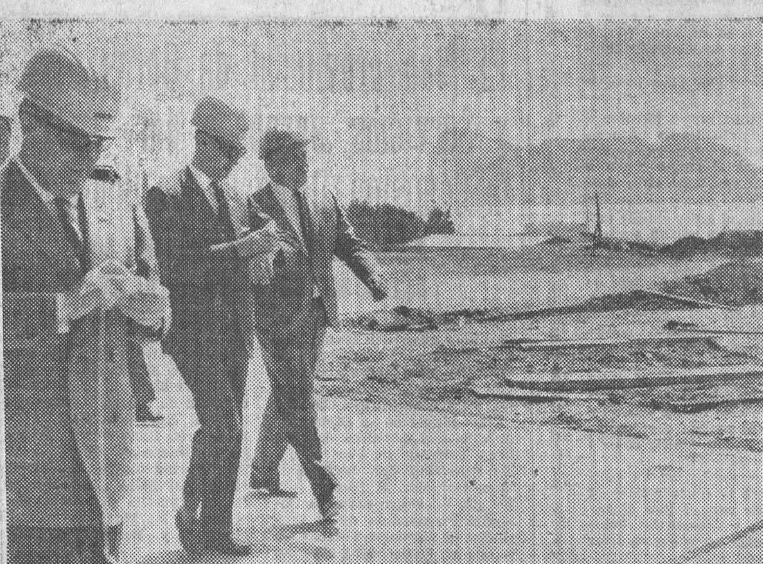
El ministro comisario del Plan de Desarrollo, señor López Rodó, ha visitado en el Campo de Gibraltar las importantes obras que en aquel sector se está llevando a cabo. En la fotografía le vemos acompañado por las primeras autoridades durante su recorrido por la refinería «Gibraltar», que próximamente entrará en servicio. Al fondo, el Peñón.