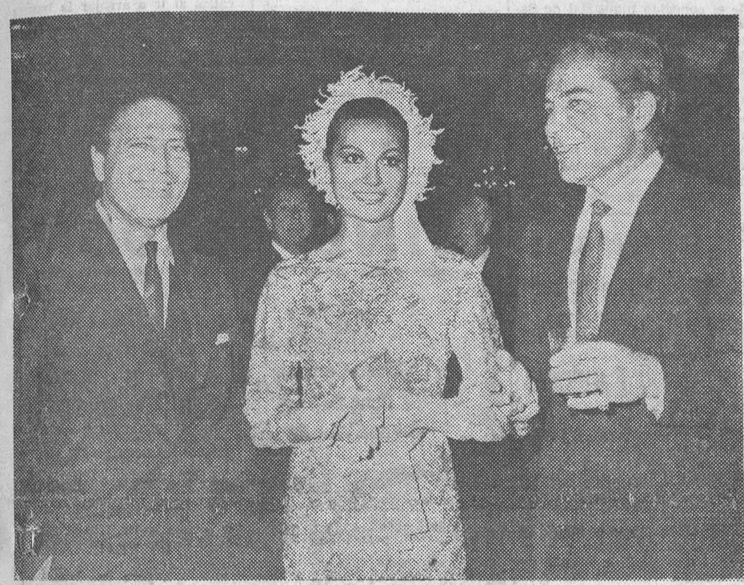
Importantes personalidades del mundo cinematográfico asistieron a un cocktail ofrecido en Roma por el productor italiano Mario Cecchi Gori para anunciar el acuerdo al que ha llegado con el productor norteamericano Joseph Levine. Entre ellos vemos a los actores Raf Vallone, Rosanna Schiaffino y Rossano Brazzi.