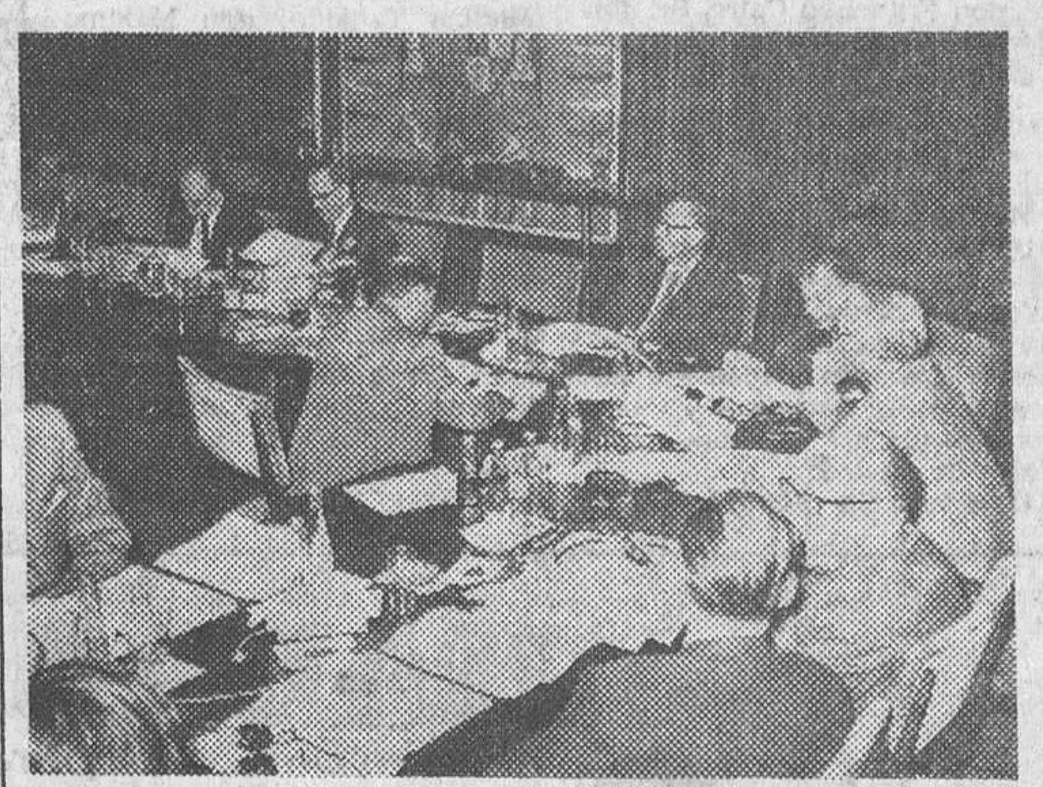
Madrid. — Un aspecto de una de las sesiones de trabajo de la reunión de la Unión europea de Radiodifusión, a la que asisten delegados de 25 países y que se vienen celebrando en la Casa sindical.