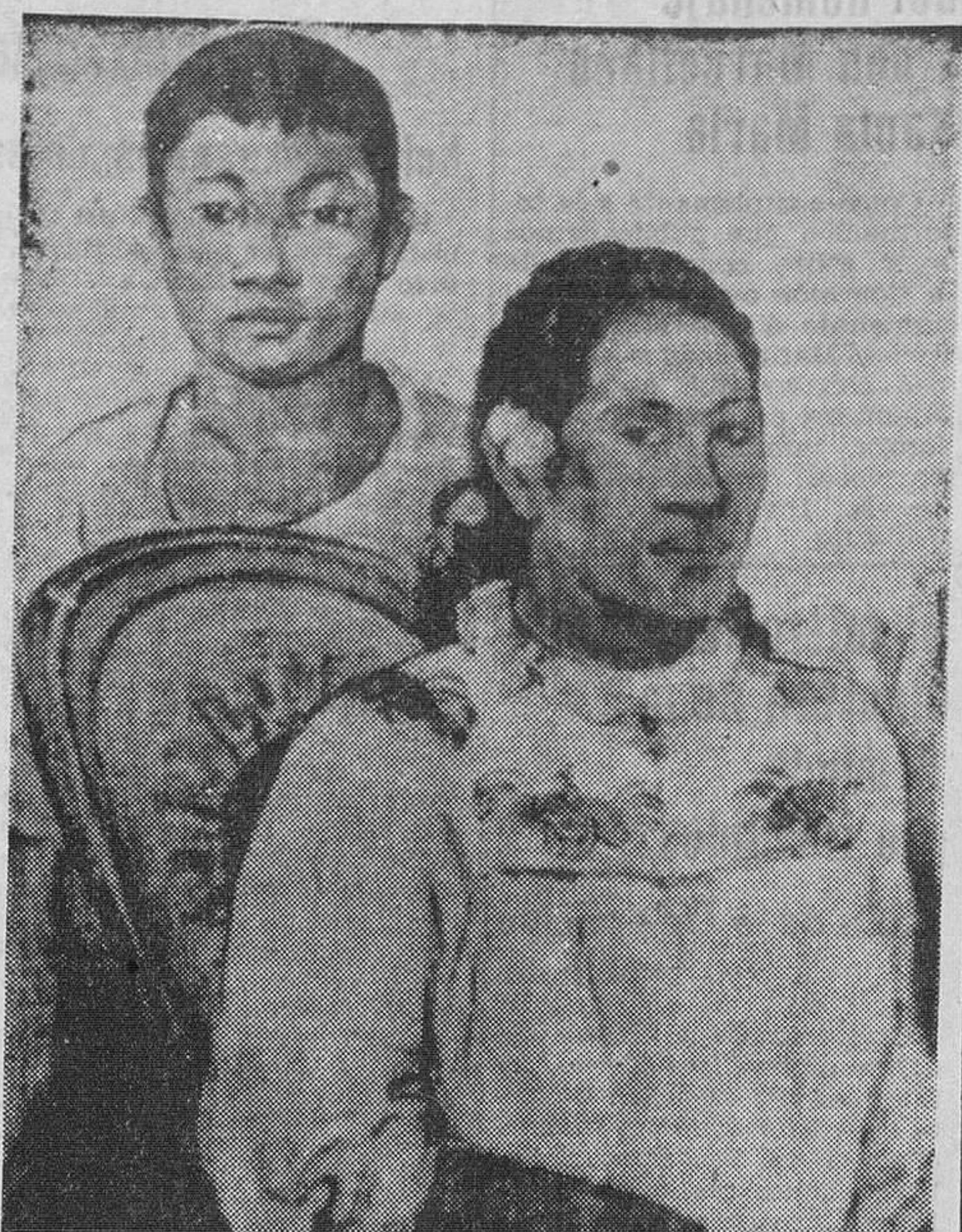
Gauguin fue un desconocido en su tiempo. Mientras que sus cuadros, como el presente alcanzan hoy precios fabulosos, el pintor tuvo que ganarse la vida en más de una ocasión pegando carteles por las calles de Montmartre.

Pero todo el mundo no tiene ocasión de vivir la evolución artística de su época, ni tiene la suerte de ser el amigo íntimo de un genial artista. Para el simple aficionado, hay objetivos más modestos que están en relación con sus modestos medios. No podrá, por ejemplo, comenzar su colección con telas de Picasso o de van Gogh. Existen en el mercado, al margen de los grandes nombres de la pintura, cuadros de valor a precios abordables, bien sea porque sus autores no han sido todavía lanzados, bien porque sus obras no corresponden a la moda o al snobismo del momento. ¿Dónde encontrar estos cuadros. Ante todo en las exposiciones y galerías. También en las subastas, no en las de obras maestras, sino en las pequeñas ventanas secundarias. Más de un coleccionista ha tenido la suerte de adquirir, por un precio insignificante, un cuadro de valor. Ha sucedido también que, sobre una tela muy vieja una pintura mediocre recubre una obra excelente, a veces de enorme valor. En este caso más que el sentido artístico hace falta una cualidad familiar a los anticuarios y detectives: el olfato. Tiempo disponible, una infatigable energía una gran cultura artística y el interés siempre alerta, tales deben ser las virtudes del coleccionista de cuadros.