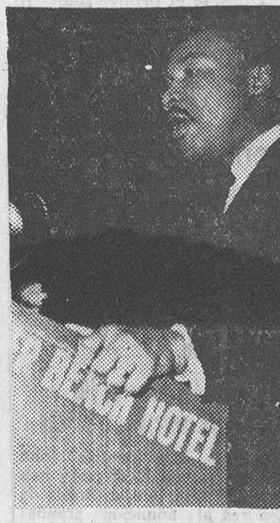
Martin Luther King durante uno de sus discursos en pro de la integración racial.

«No hay inmunidad —decía el juez rechazando la alegación de que, por haber ejercido los manifestantes derechos constitucionales, debía ser transferida la causa a un tribunal federal... para aquellas personas que insisten en practicar la desobediencia cívica bajo el disfraz de manifestarse o protestar a favor de los «derechos civiles». La filosofía según la cual una persona puede... si su causa es calificada de «derechos civiles» o «derechos de los Estados» —determinar por sí misma qué leyes y decisiones de los tribunales son moralmente justas o injustas y obedecerles o no».