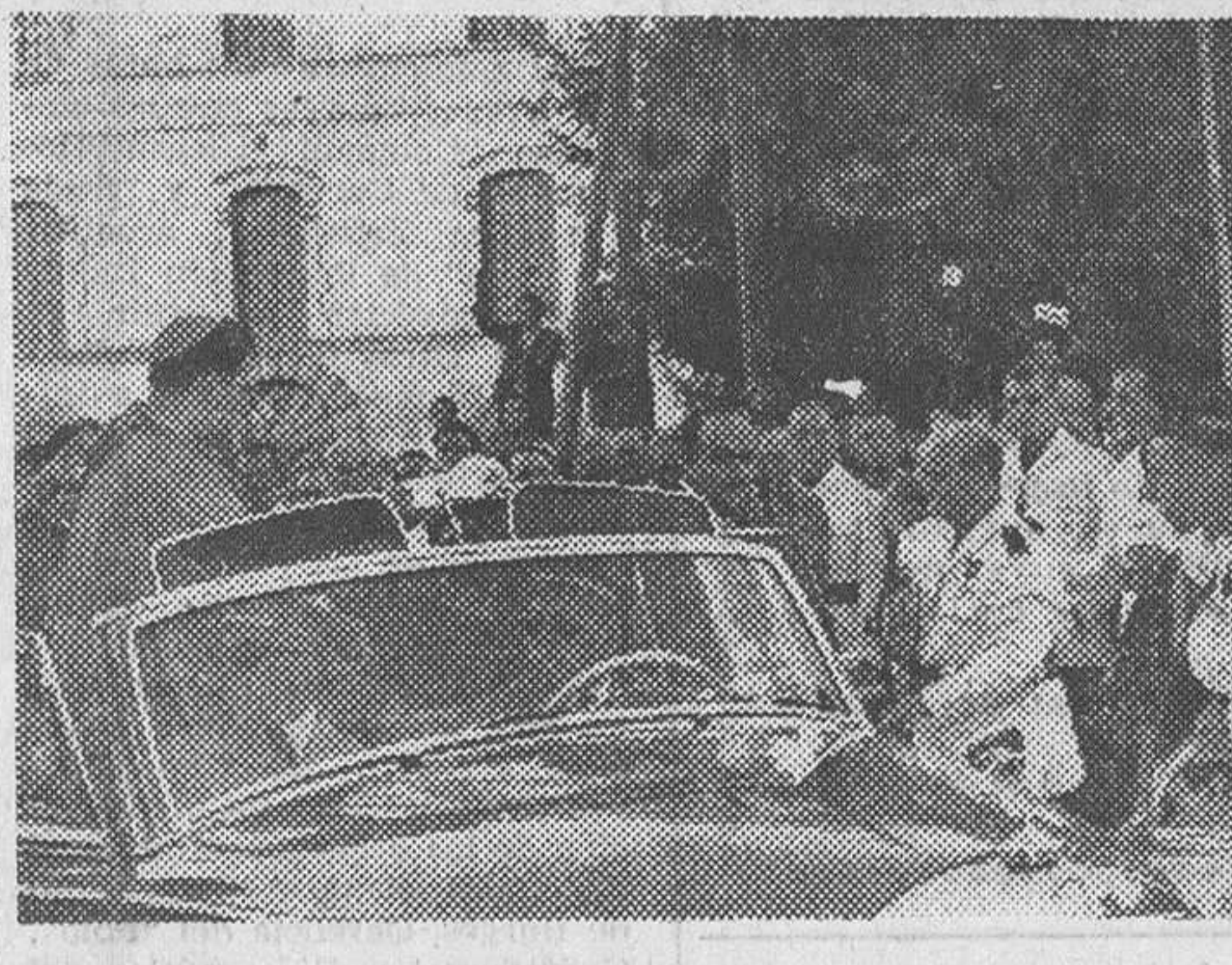
Guadix.—La fotografía muestra el momento de la llegada a Guadix del nuevo obispo de la diócesis, doctor Díez Merchán, que fue calurosamente recibido por todo el vecindario de la ciudad y comarca.