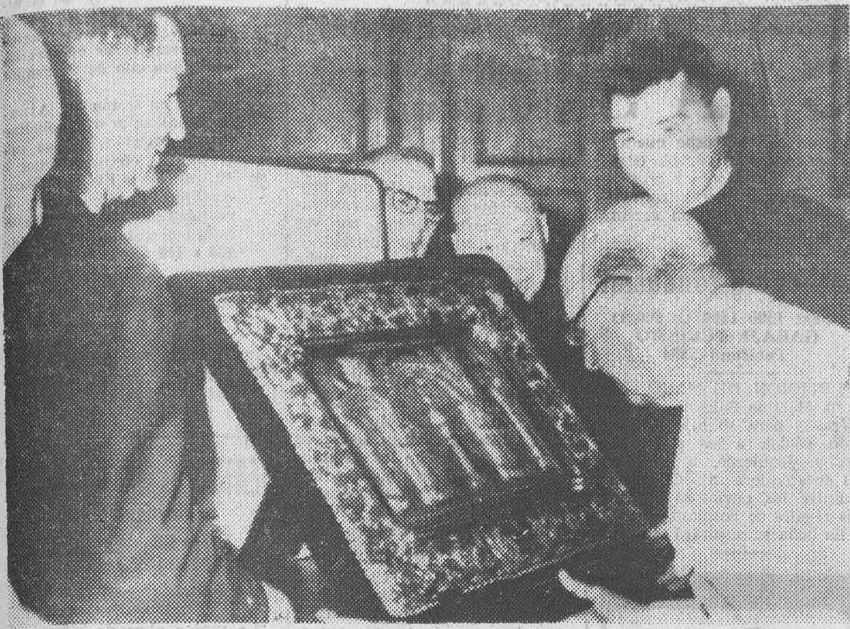
La Coruña.—El Cabildo de Santiago de Compostela hace entrega a Su Excelencia el Jefe del Estado de una reproducción del Pórtico de la Gloria.