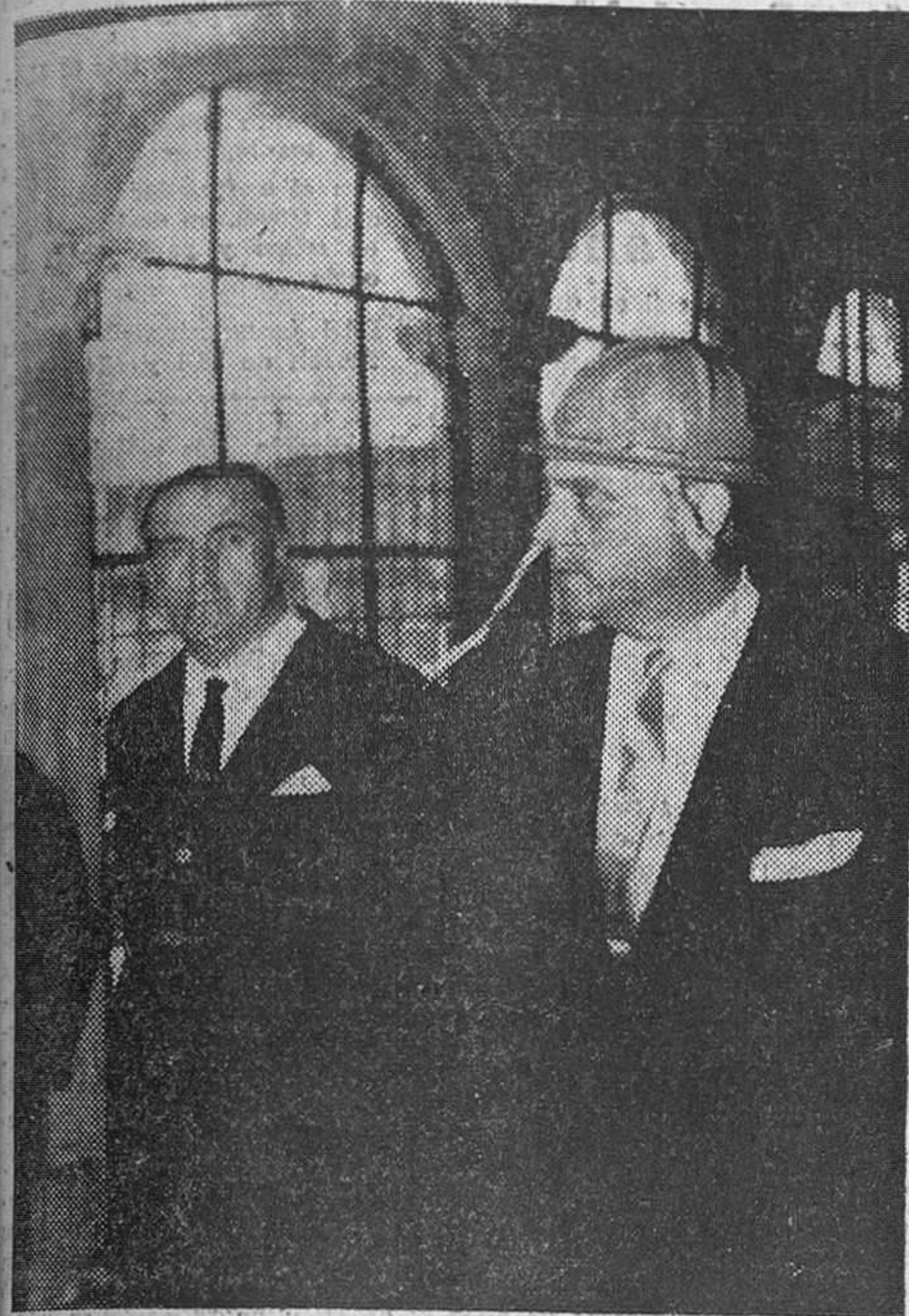
León. — El ministro de Información y Turismo con casco protector, acompañado del gobernador civil de la provincia, en el Ministerio de San Marcos, donde se trabaja activamente para convertirlo en hostel.

El ministro de Información y Turismo en el Congreso nacional Eucarístico de León.