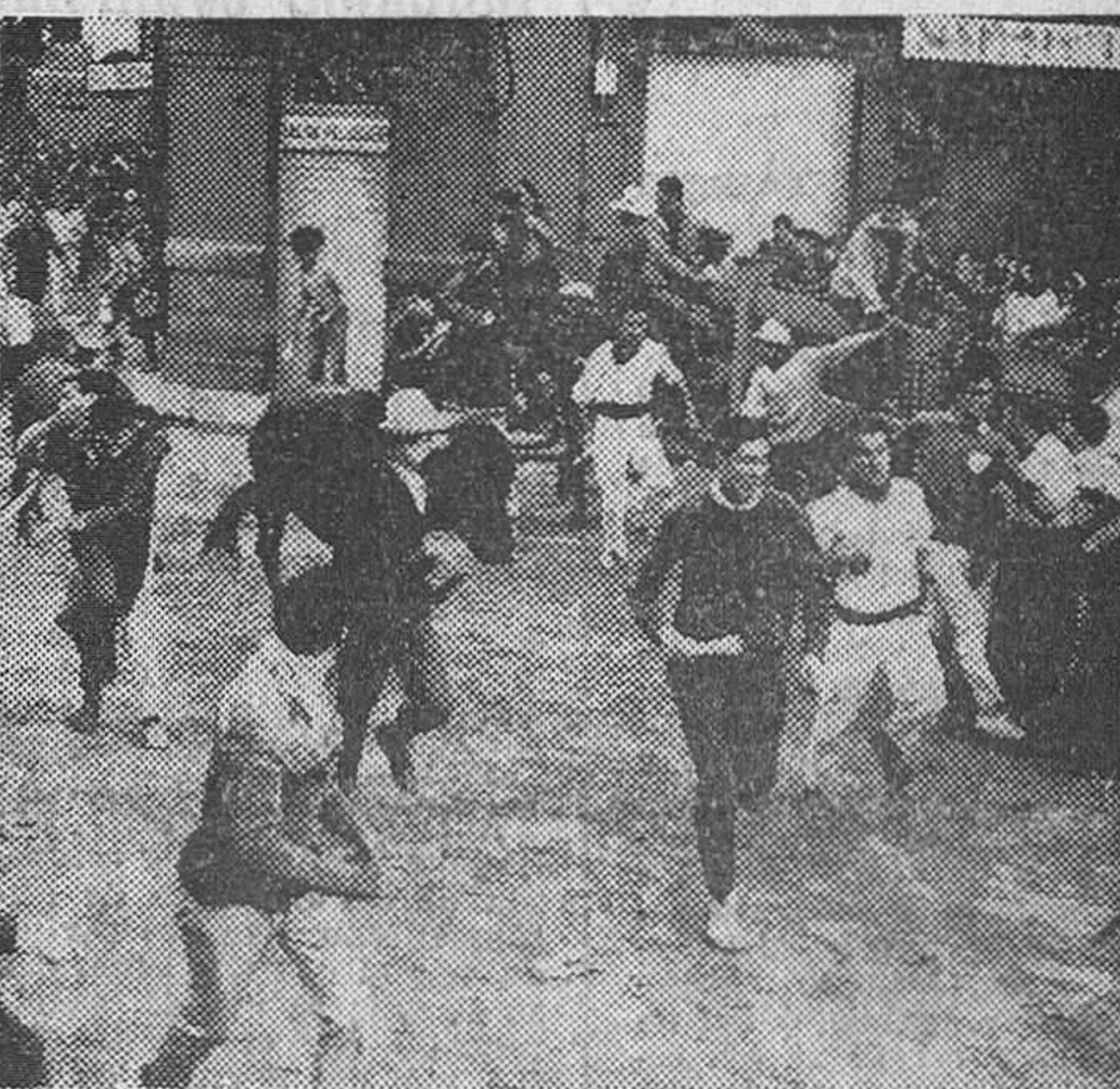
Pamplona. — Un momento del espectacular encierro de las reses de la segunda corrida de la feria de Pamplona.