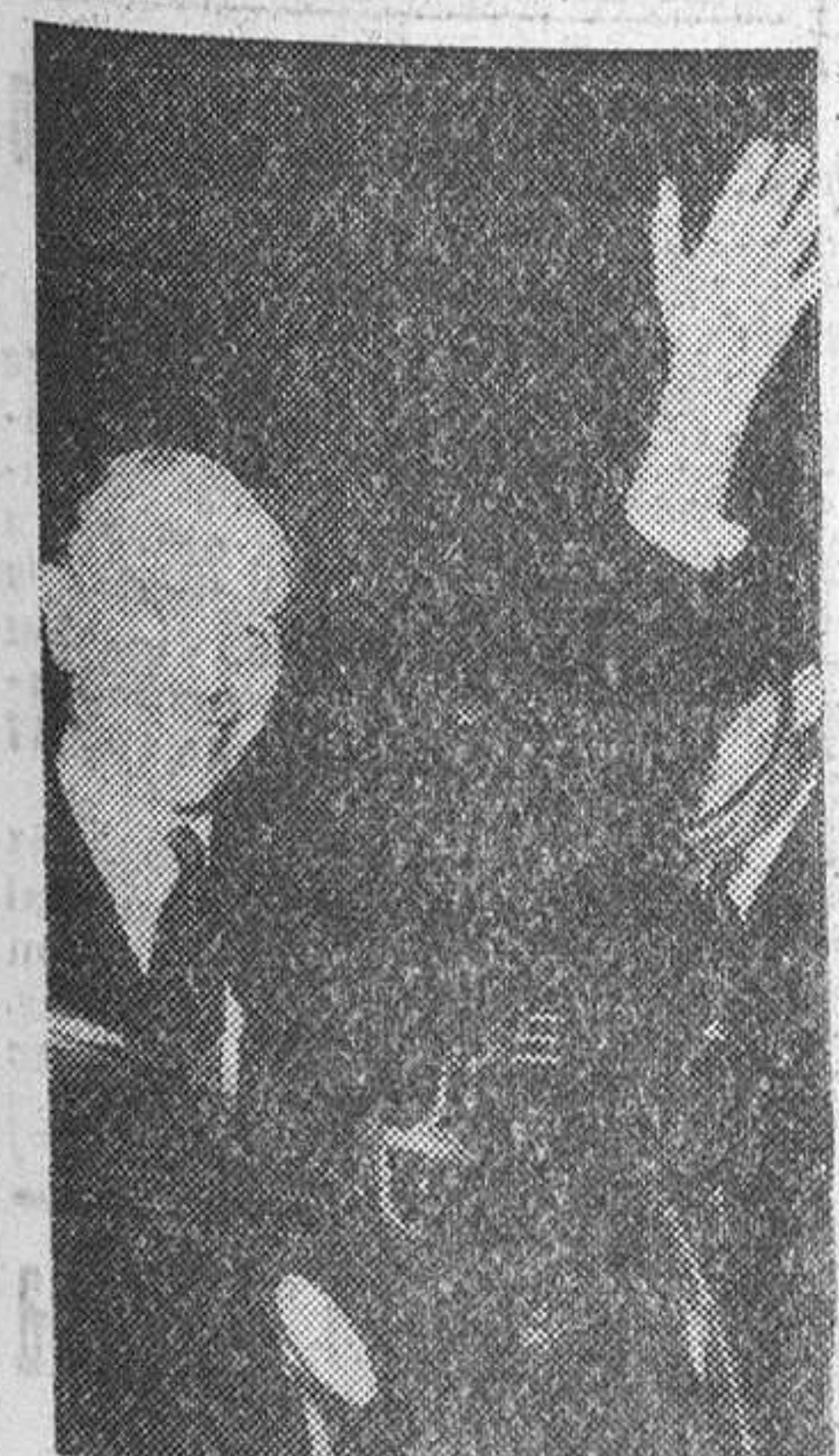
Londres. — Lord Home, nombrado por la Reina Isabel II nuevo primer ministro de Gran Bretaña por dimisión de Mac Millan, en el momento de dirigirse al Palacio de Buckingham donde fue recibido por la Reina

Dieciséis mil soldados norteamericanos con sus pertrechos y equipo pesado serán transportados a Europa en menos de 72 horas