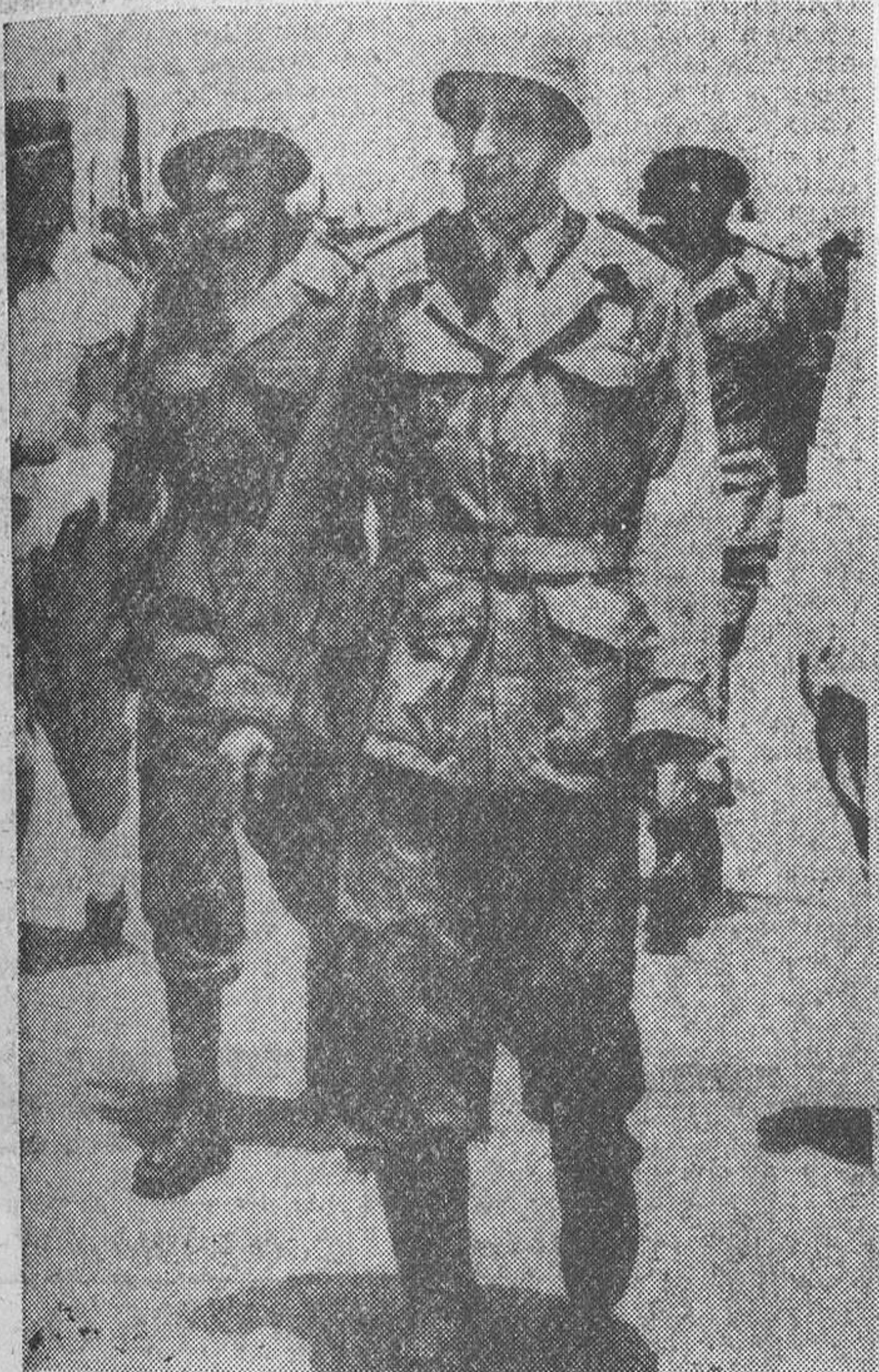
He aquí al general Ketani, jefe del Ejército marroquí que combatió en la frontera contra las tropas argelinas

Marrakech. — El ministro de Asuntos Exteriores marroquí, Balafrej, ha calificado de inútil la propuesta de la Liga Árabe para mediar en la lucha entre Argelia y Marruecos.