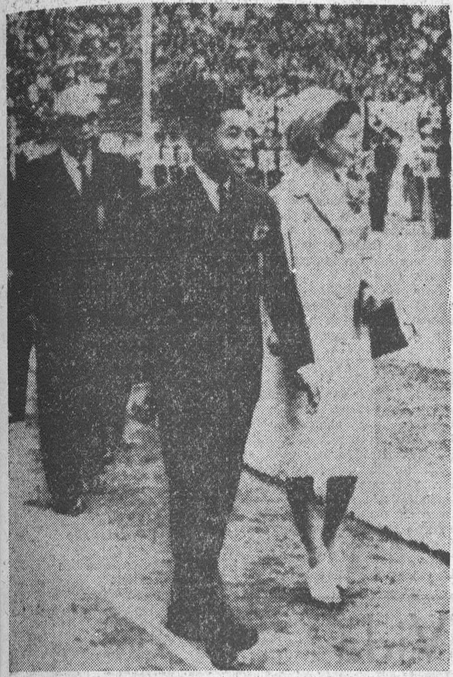
Tokio.—El Príncipe de la Corona Akihito y su esposa la Princesa Michiko, en la inauguración de la Semana Deportiva Internacional en el Estadio Nacional de Tokio.