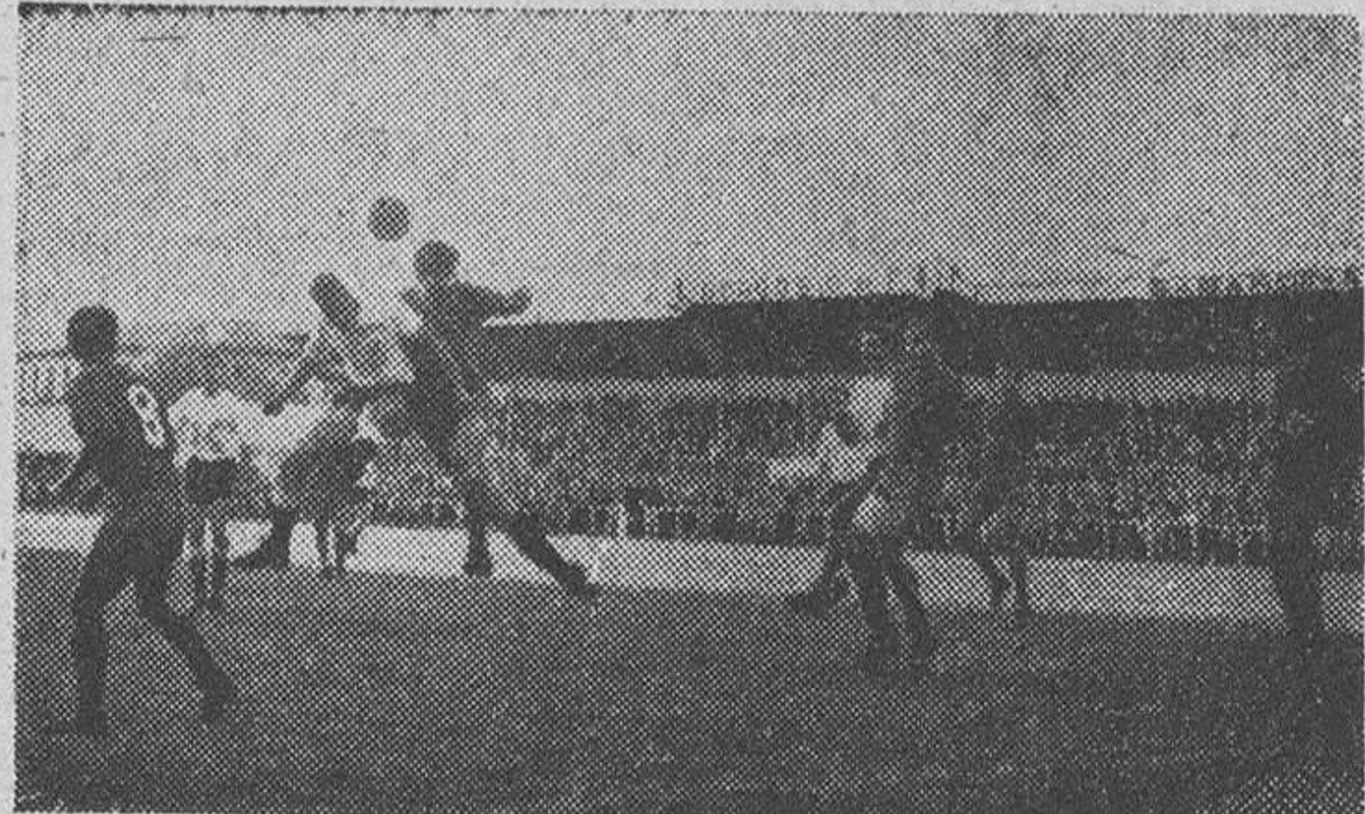
Los jugadores del Orense se apretaron ante su puerta, sobre todo en los últimos minutos, para defender su victoria. He aquí, ante una jugada de peligro, a Wilson y Villa pendientes del acoso que Azcárate efectúa para forzar la infranqueable barrera orensana.

lanzada al final, que detuvo Gutiérrez hábilmente arrojándose, para que también el resultado hubiera sido igual que el obtenido frente al Europa. Existía, sin embargo, entre este equipo y el que ahora nos visitaba, una diferencia considerable. Aquel venía como "gallo" mientras que éste lo hacía clasificado en un cuarto puesto comenzando por la cola. La superioridad del once catalán puso nerviosos a nuestros jugadores; la "inferioridad" del cuadro gallego les dio a caso exceso de tranquilidad? Porque lo indiscutible es que el Orense superó al Burgos en velocidad y en saber estar en el campo y hacer el juego que convenía.