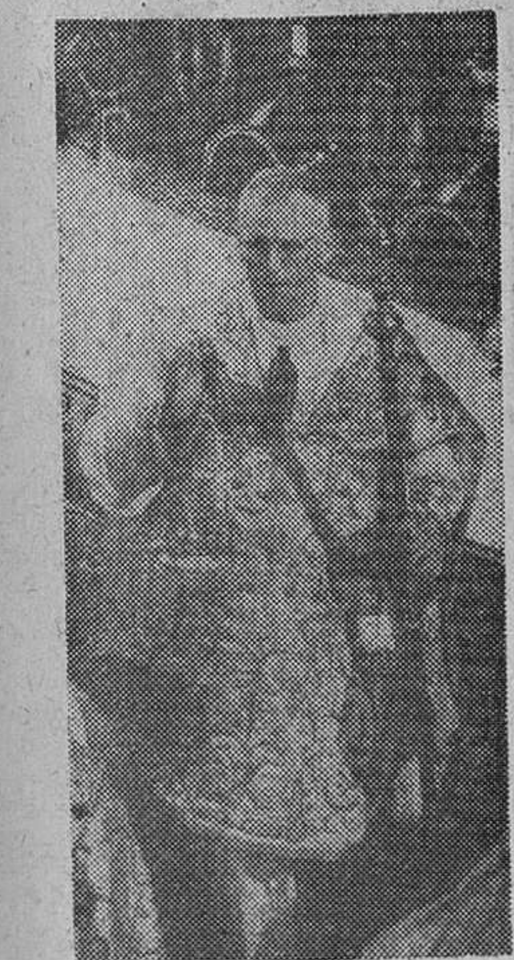
Londres.— El arzobispo John Carmel Heenan, después de su entronización como VIII arzobispo católico de Westminster, en ceremonia celebrada en la Catedral.