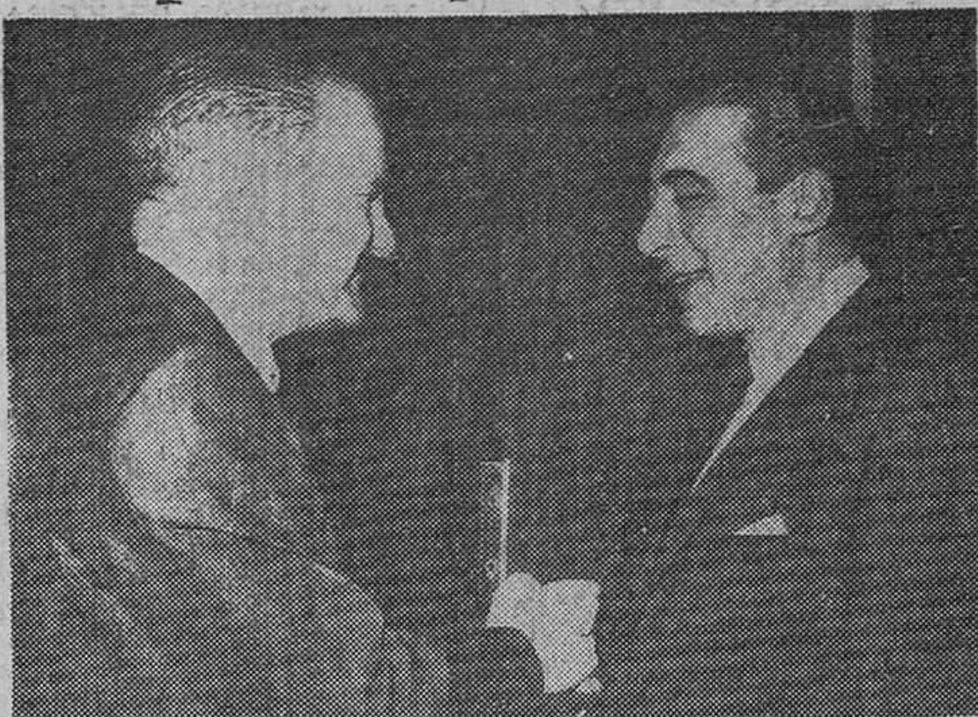
Nueva York.— El ministro español de Asuntos Exteriores, señor Castiella, es saludado por su colega peruano don Fernando Schwab Lopez, en la oficina de la misión norteamericana en las Naciones Unidas.