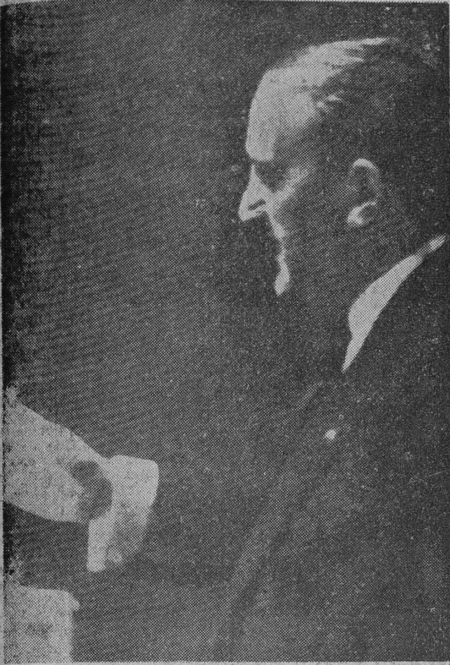
Castiella durante su discurso ante la XVIII Asamblea de la ONU, en el que precisó la postura de España ante los problemas mundiales, siendo muy felicitado y aplaudido por los representantes de todos los países.

Establece una estrecha cooperación entre ambos países y prorroga por cinco años el convenio defensivo