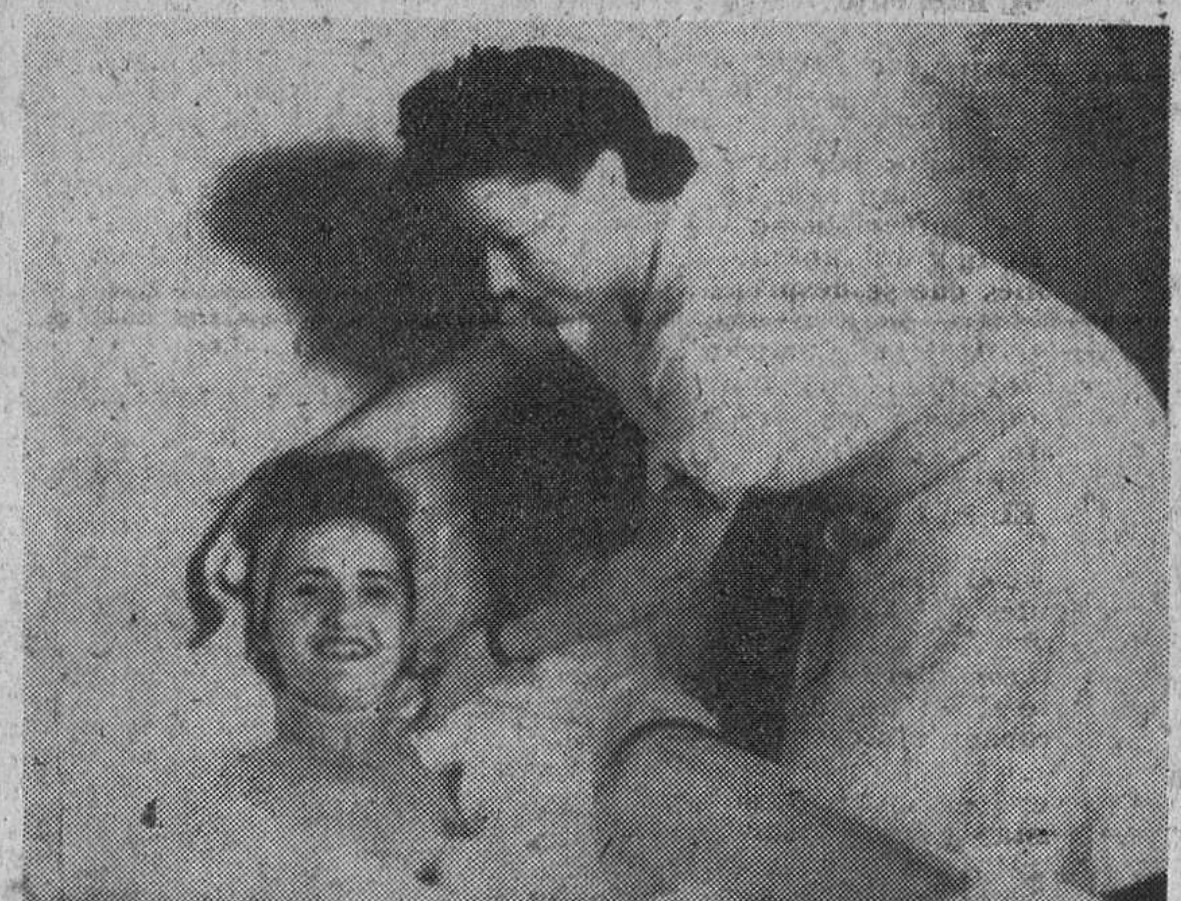
El baño en agua de rosas o perfumada es una tradición milenaria femenina que ya practicaban las mujeres indias cientos de años antes de Jesucristo.

Por Janine de LONGCHAMP y Cristiane FONTAINES