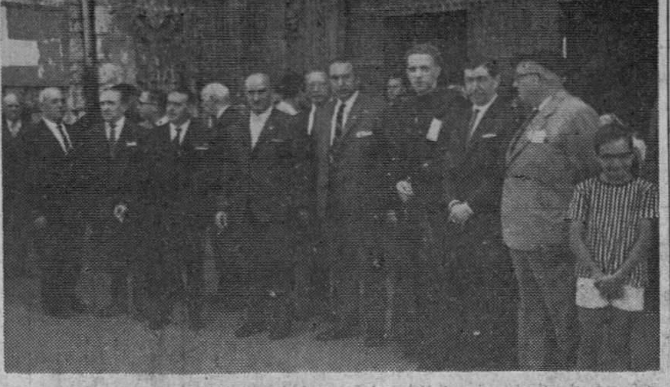
Grupo de concurrentes a la ceremonia religiosa organizada por la Casa Vasca, con motivo de la festividad de San Ignacio de Loyola.