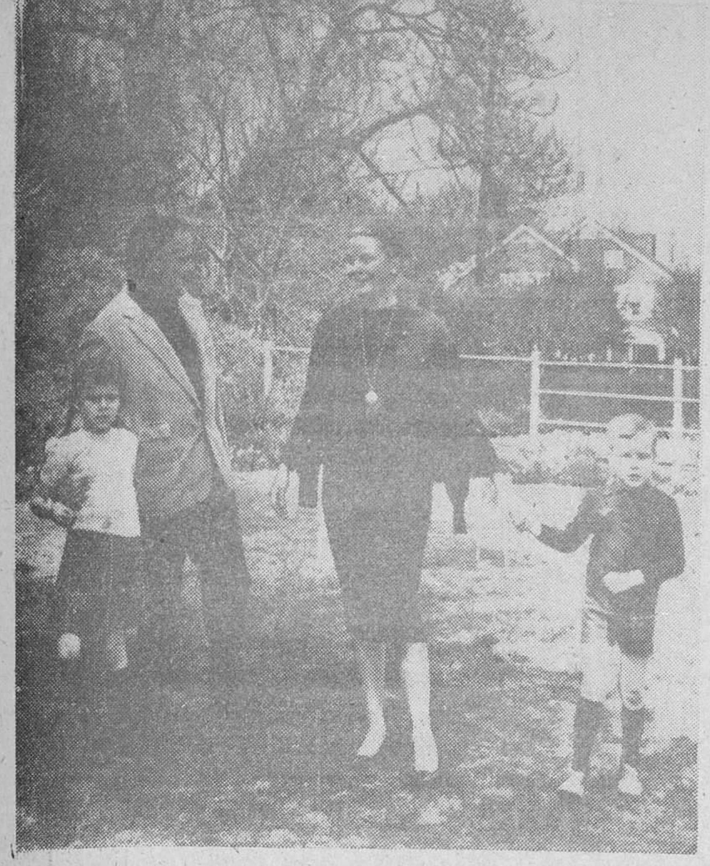
Los Príncipes de Mónaco en Filadelfia Príncipes se han trasladado a la casa de la madre de Grace, en Filadelfia, donde han sido obtenidas estas excepcionales fotos con motivo de dicho aniversario, en las que los Príncipes aparecen acompañados de sus hijos la Princesa Carolina, de seis años y el Príncipe Alberto de cinco.