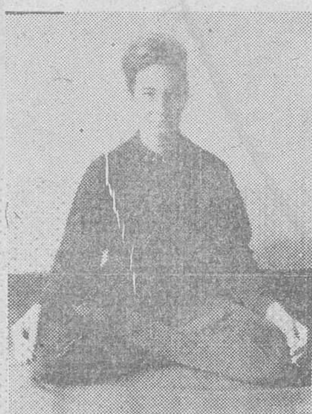
Una de las posturas del "Hatha"

El "Hatha" es la rama física del Yoga, la filosofía-religión hindú, que abarca todas las actividades de la vida. A nosotros nos interesa el Yoga, pero si vamos a ocuparnos un poco de "Hatha" para al menos no ignorar la gimnasia de moda. TRES PARTES El "Hatha" se puede dividir en tres partes: las posturas, la respiración y los movimientos en general del "yogui". Sin duda lo más importante es la respiración. Cuando se respira bien, se pueden controlar el estado de ánimo, de depresión o de cualquier momento de nerviosismo. Sabiendo respirar, se puede concentrar la persona fácilmente en el estudio y se discurra con más facilidad. La cosa es como para pensarla despacio. ¿No es cierto? Pero en este sentido, podemos hacer muy poco desde aquí. Sería necesario acudir a unas clases de las que hay muy pocas en España. Las llamadas "posturas" son ejercicios gimnásticos que tienden a enseñar al "yogui" lo que llamamos "relax" y que esto mucho de ser fácil, aunque lo parezca. Los movimientos no son más que las posturas ya dominadas y llevadas a la vida diaria, a la conversación amistosa, al trabajo y al descanso. Se trata de conseguir un estado permanente de "relax", con una