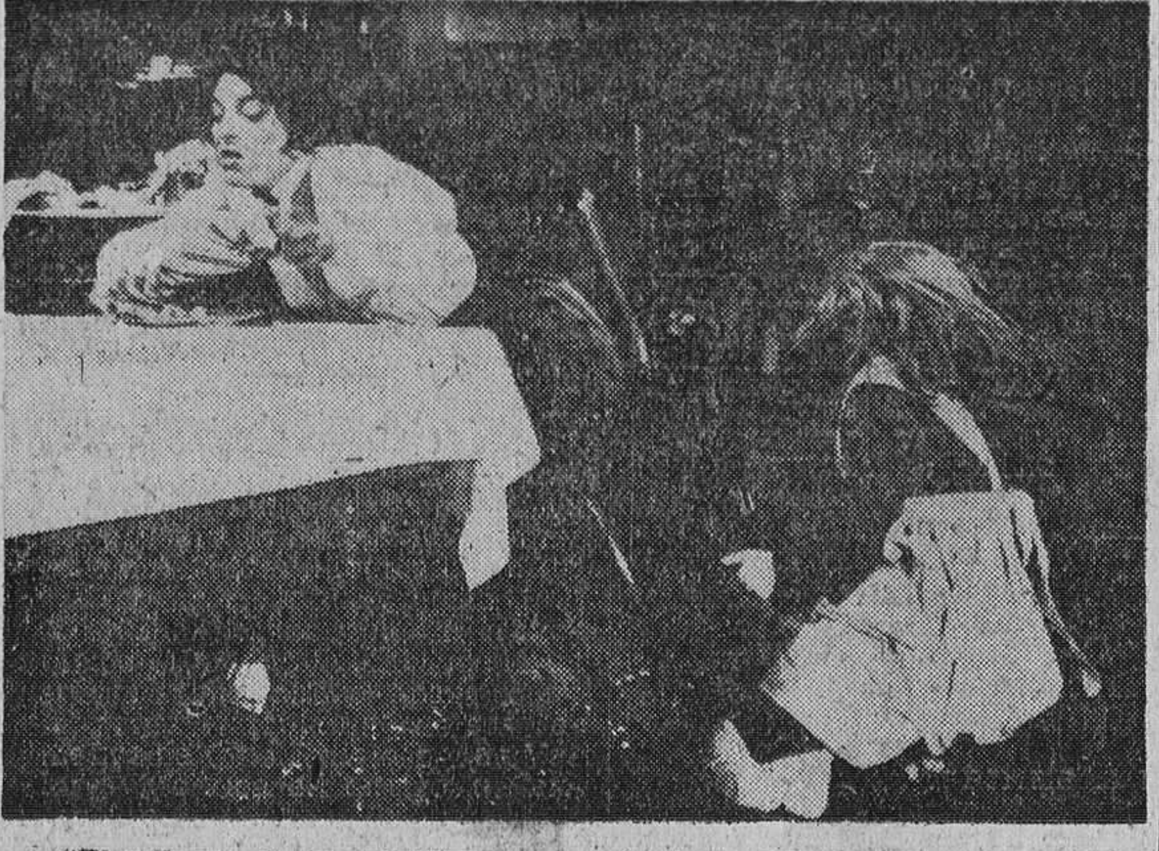
"El milagro de Ana Sullivan", premio de la Oficina Internacional Católica de Cine en el Festival de San Sebastián

Valga, por ejemplo, la afirmación de que el nivel cultural y humano medio del cine actual es desconsolador: para demostrarla, bastaría recordar los títulos de muchas películas que son en sí mismas una definición de vulgaridad o de estupidez. Valga, por ejemplo, el testimonio de los propios Industriales, que confiesan haber recurrido a libertades temáticas y a trucos formales ajenos al cine para defenderse de la competencia, llamase televisión o excursiones domingueras.