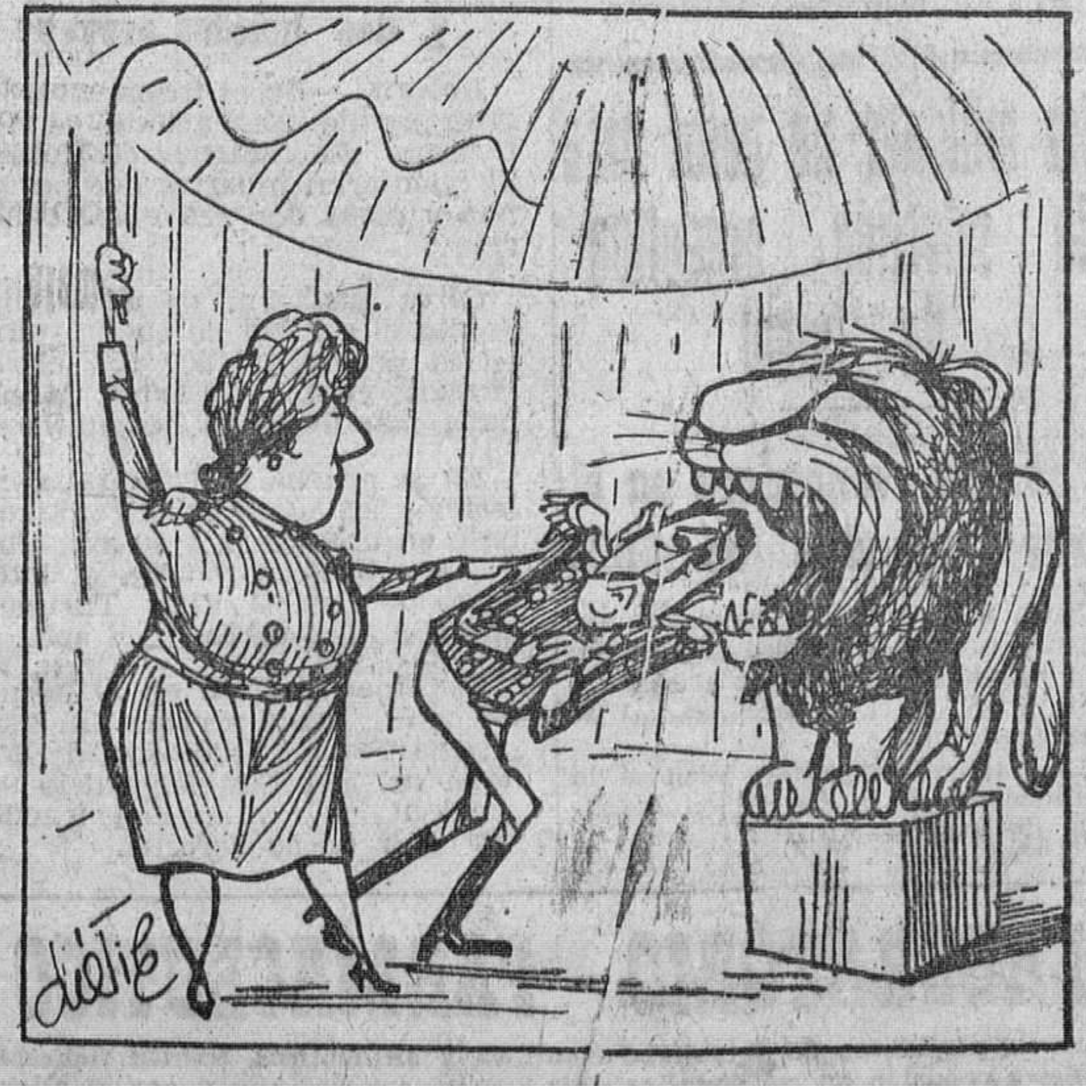
(Sin pal, bras)