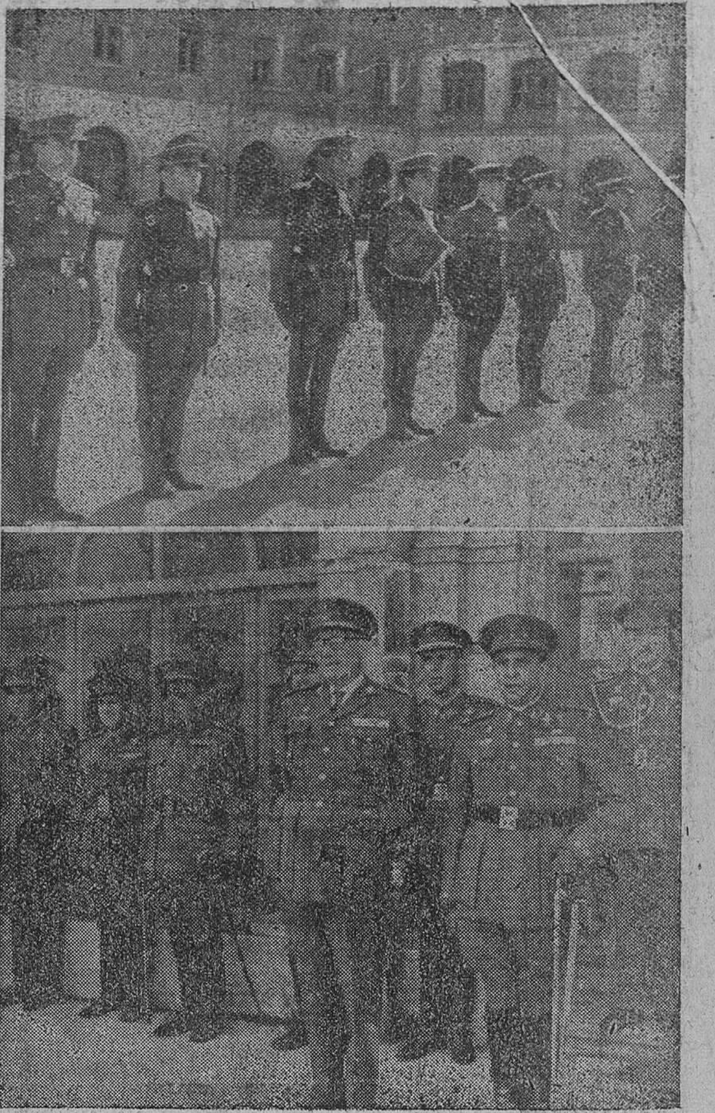
En la mañana de ayer se efectuó la inauguración del nuevo curso en la Academia de Ingenieros. A dicho acto, del que damos cuenta en páginas interiores, pertenecen las precedentes placas, que recogen —arriba— el momento de la proclamación de los galonistas y —abajo— la ceremonia final, en que mandos y cadetes entonaron el Himno del Arma de Ingenieros.