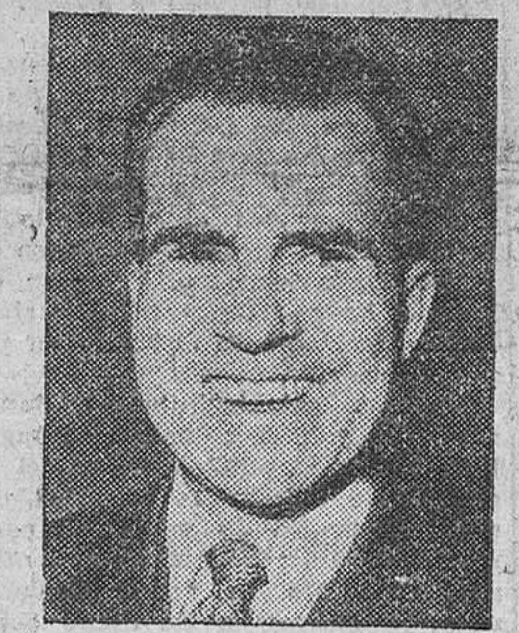
RICHARD M. NIXON

Felicitación de Kennedy a su contricante