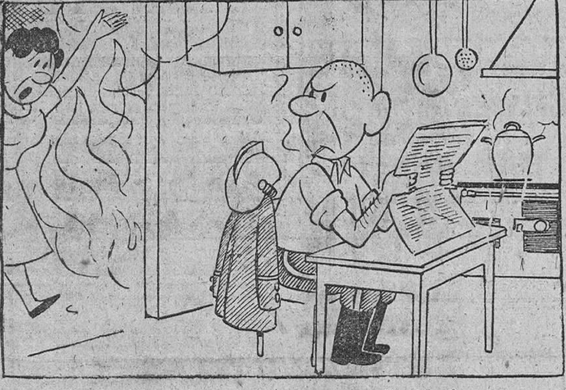
—¡Vaya... y hoy, precisamente, que es mi día libre!