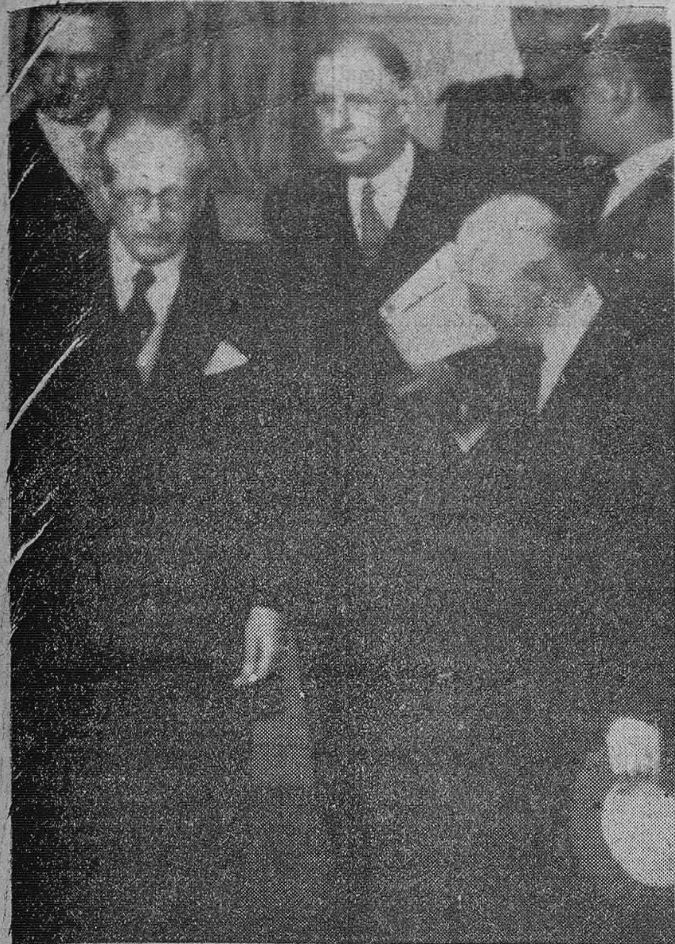
Paris. — El primer ministro británico, Mac Millan y los presidentes De Gaulle y Eisenhower de izquierda a derecha, en el momento de la salida del Palacio del Eliseo, después de su conferencia en la mañana de hoy de 35 minutos de duración.