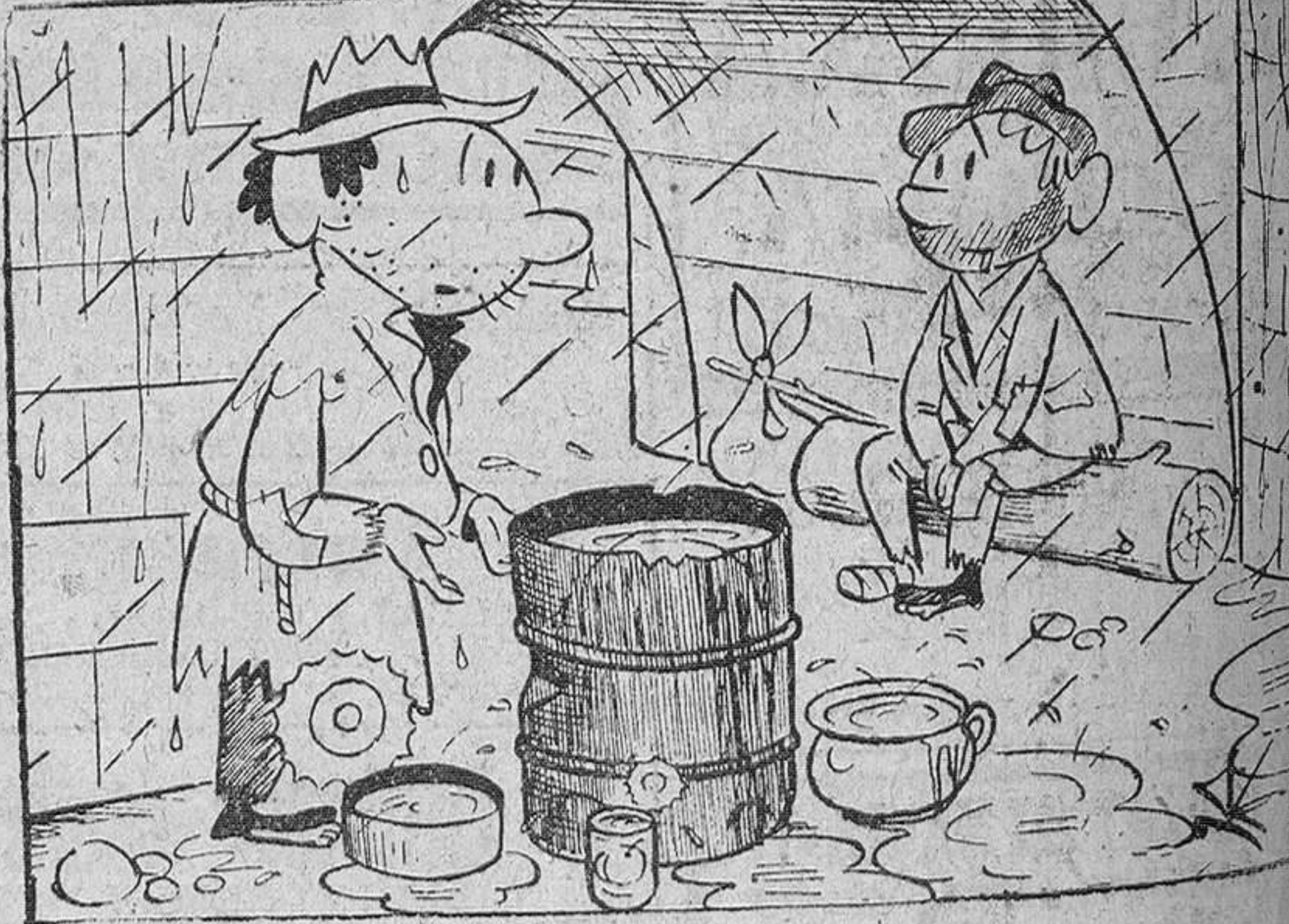
—Todos dicen que este agua vale mucho dinero.

Cine Cordón GRAN EXITO UNA PELICULA SENSACIONAL, UNICA F. B. I. CONTRA EL IMPERIO DEL CRIMEN por James Stewart y Vera Miles EL F.B.I. AL ASALTO DEL INEXPUGNABLE MUNDO DEL CRIMEN SESIONES, 5.15, 7.45, NUMERADA, y 11 NOCHE NOTA.—Por su largo metraje se ruega puntualidad Autorizada para mayores de 16 años