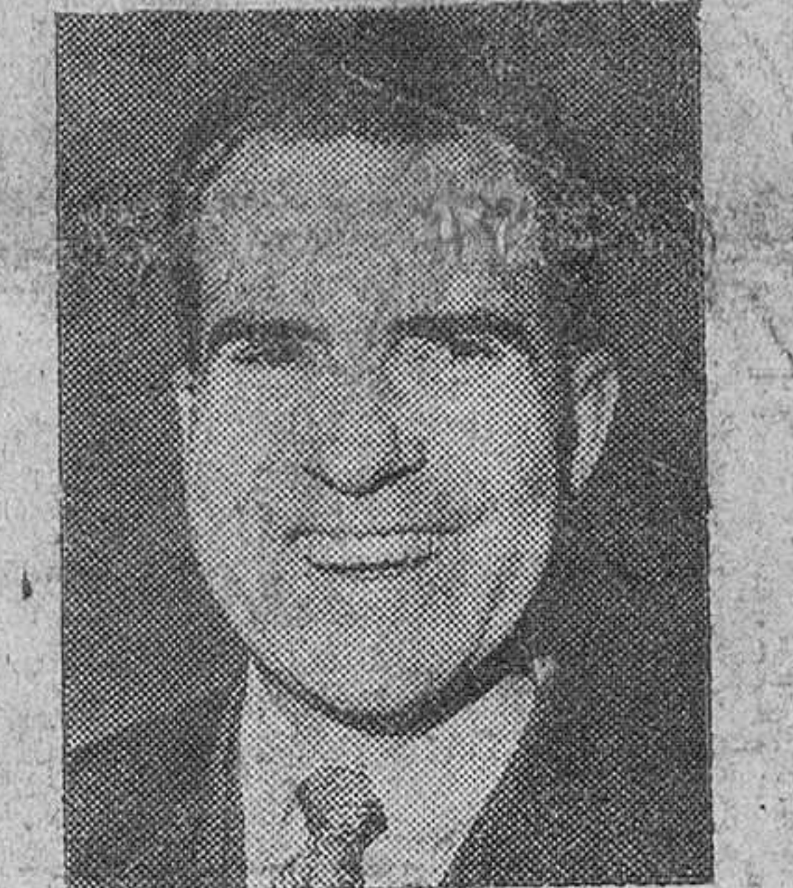
Siracusa (Nueva York, EE. UU.).

El vicepresidente Nixon ha hecho público hoy que dos espías rusos fueron detenidos en Massachusetts, precisamente cuando el jefe del Gobierno soviético estaba presentando su plan de desarme ante las Naciones Unidas, el pasado año, durante su viaje a Estados Unidos. En una conferencia de Prensa en esta ciudad, Nixon comentó al respecto: «Entonces Kruschef todavía no se había quedado de ningún espionaje norteamericano».