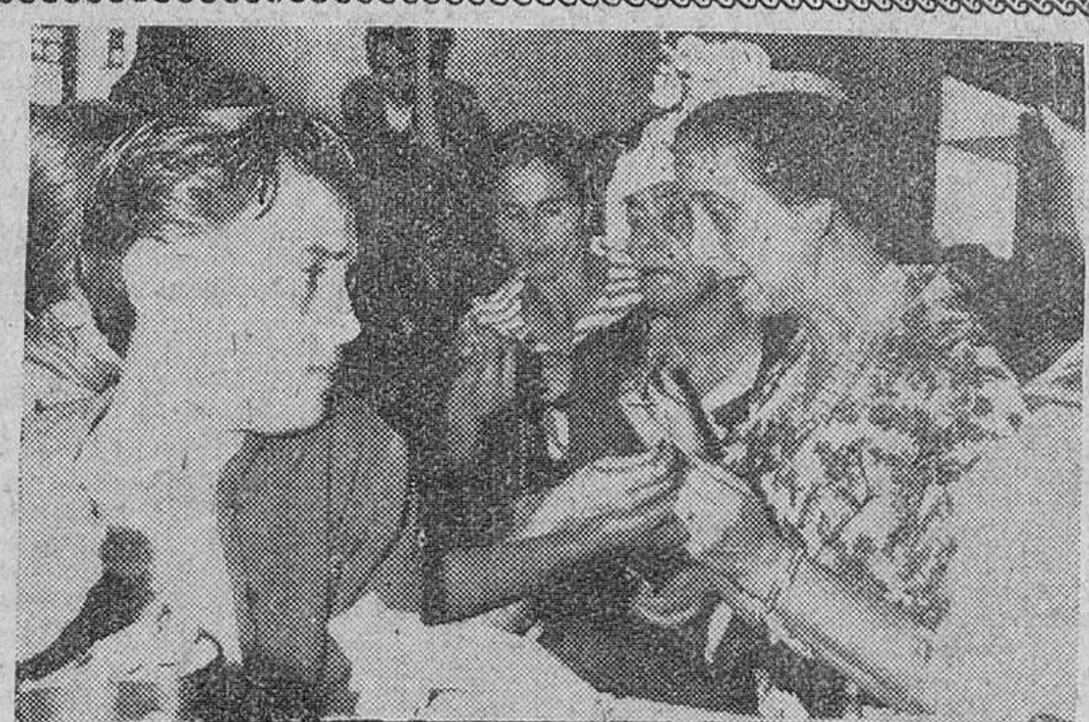
Doña Carmen Polo de Franco en la Tómbola de Caridad

Taipeh. — Un grupo de funcionarios de la China nacionalista declaró que existe una grave intranquilidad en la China roja y predicen que este invierno pueden producirse en aquel país levantamientos masivos.