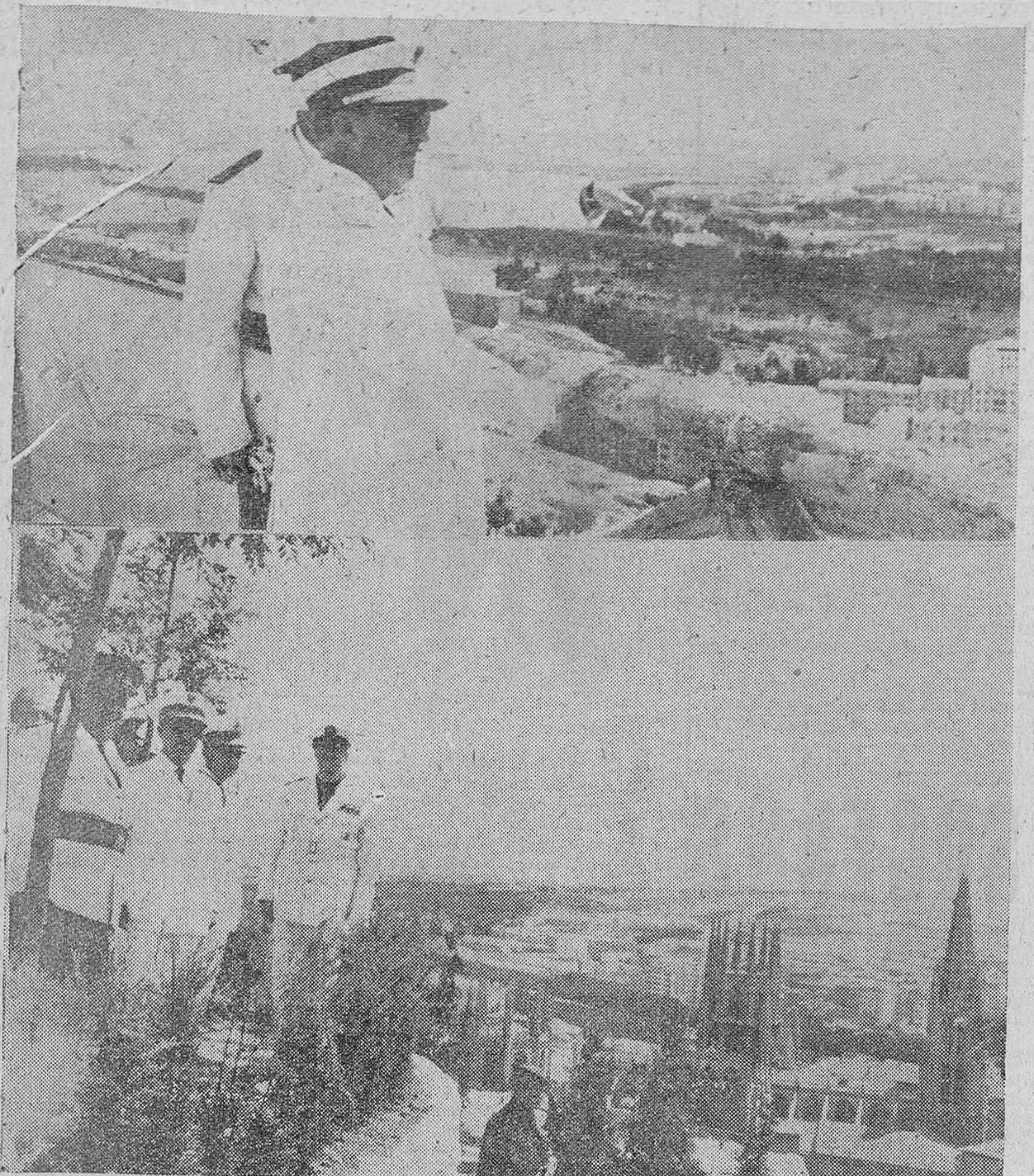
Franco admira Burgos desde los miradores del Parque Forestal

Burgos, S. E. el Jefe del Estado tuvo ocasión de admirar, desde los miradores del Parque Forestal construido en aquella zona y en la del Castillo, las soberbias perspectivas urbanas que nuestra ciudad ofrece desde lo alto. A tales visitas corresponden los precedentes grabados, en los que vemos al Caudillo, escuchando las explicaciones que le da el alcalde Sr. Jaquotot y en segundo término, acompañado del ministro de Obras Públicas, gobernador civil y alcalde de Burgos, en el mirador del Castillo.—(Fotos Fedé).