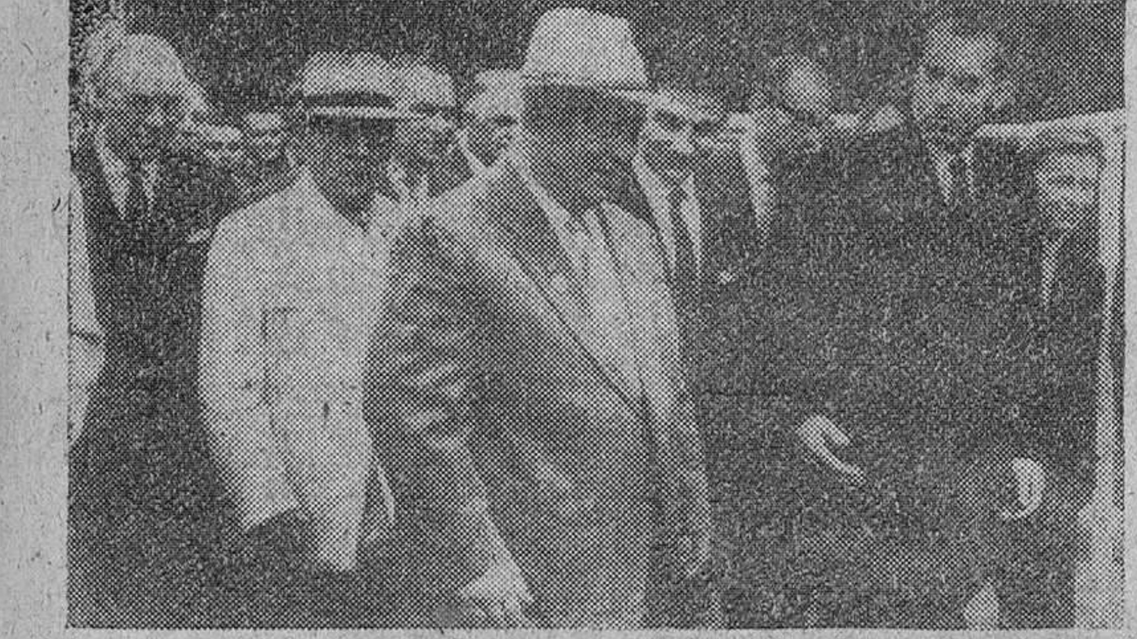
NIXON EN MOSCU durante la visita a la Exposición americana inaugurada ayer en esta capital.