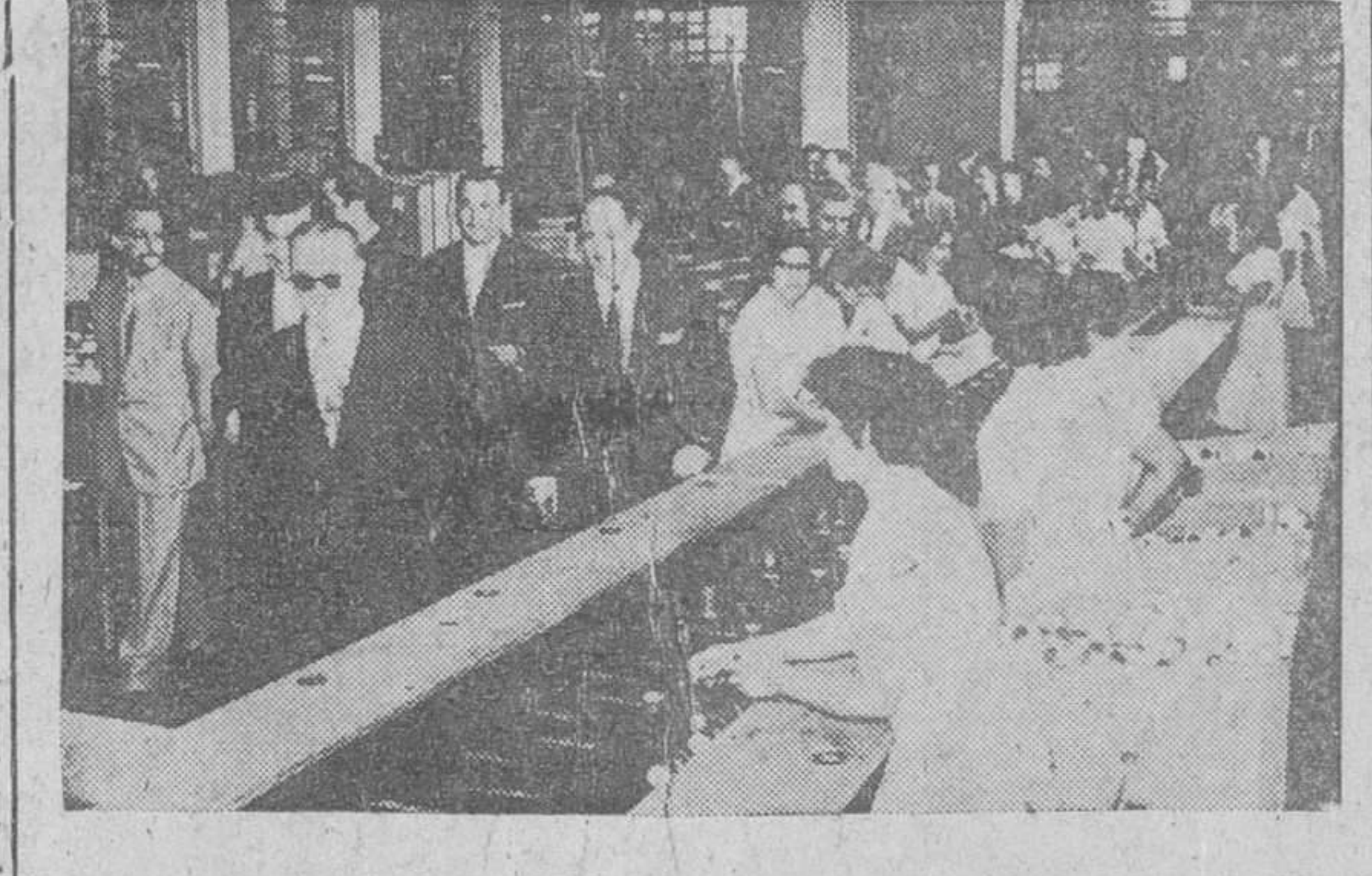
Alcira (Valencia).— El ministro de Trabajo, señor Sanz Orrio, con diversas jerarquías sindicales y autoridades valencianas, durante su visita a la empresa Cartonajes Suñer, de Alcira.

El ideal cristiano de la justicia social, reflejado en el Fuero del Trabajo, inspirará la política y las leyes. X. Se reconoce el trabajo como origen de jerarquía, deber y honor de los españoles y a la propiedad privada en todas sus formas, como derecho condicionado a su función social. La iniciativa privada, fundamento de la actividad económica, deberá ser estimulada, encauzada y, en su caso, suprida por la acción del Estado. XI. La empresa, asociación de hombres y medios ordenados a la producción, constituye una comunidad de intereses y una unidad de propósitos. Las relaciones entre los elementos de aquella deben basarse en la justicia y en la recíproca lealtad y los valores económicos estarán subordinados a los de orden humano y social. XII. El Estado procurará por todos los medios a su alcance perfeccionar la salud física y moral de los españoles y asegurarles las más dignas condiciones de trabajo; impulsar el progreso económico de la nación, con la mejora de la agricultura, la multiplicación de las obras de regadío y la reforma social del campo; orientar el más justo empleo y distribución del crédito público; salvaguardar y fomentar la prosperidad y explotación de las riquezas mineras; intensificar el proceso de industrialización, patronar la investigación científica y favorecer las actividades marítimas, respondiendo a la extensión de nuestra roblación marítima y a nuestra ejecutoria naval.