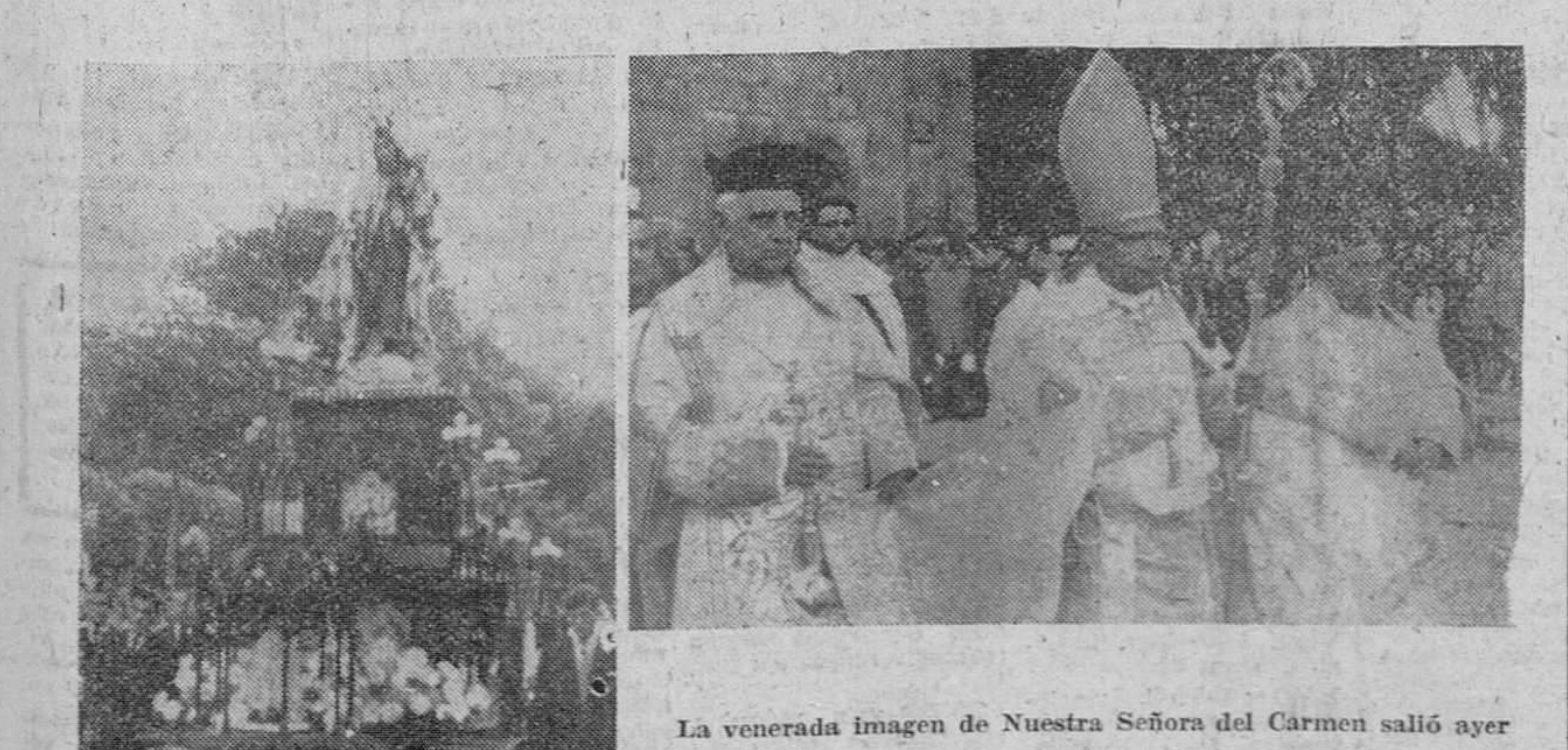
La venerada imagen de Nuestra Señora del Carmen salió ayer del convento de PP. Carmelitas, en solemne procesión, a la que pertenecían las presentes fotos de «Fed».—En la primera, la carroza durante su recorrido por las calles. Y en la segunda, el arzobispo de Verápoli presidiendo, de preste, el cortejo procesional.