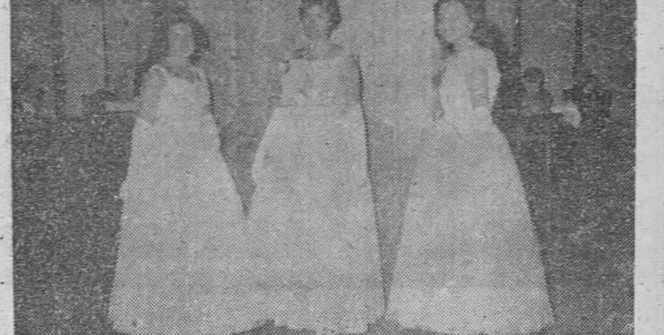
En el curso del baile de gala celebrado anteanoche en el Círculo de la Unión, se presentaron en sociedad varias señoritas burgalesas, entre ellas las tres que «Fada» captó en el curso de la selecta fiesta