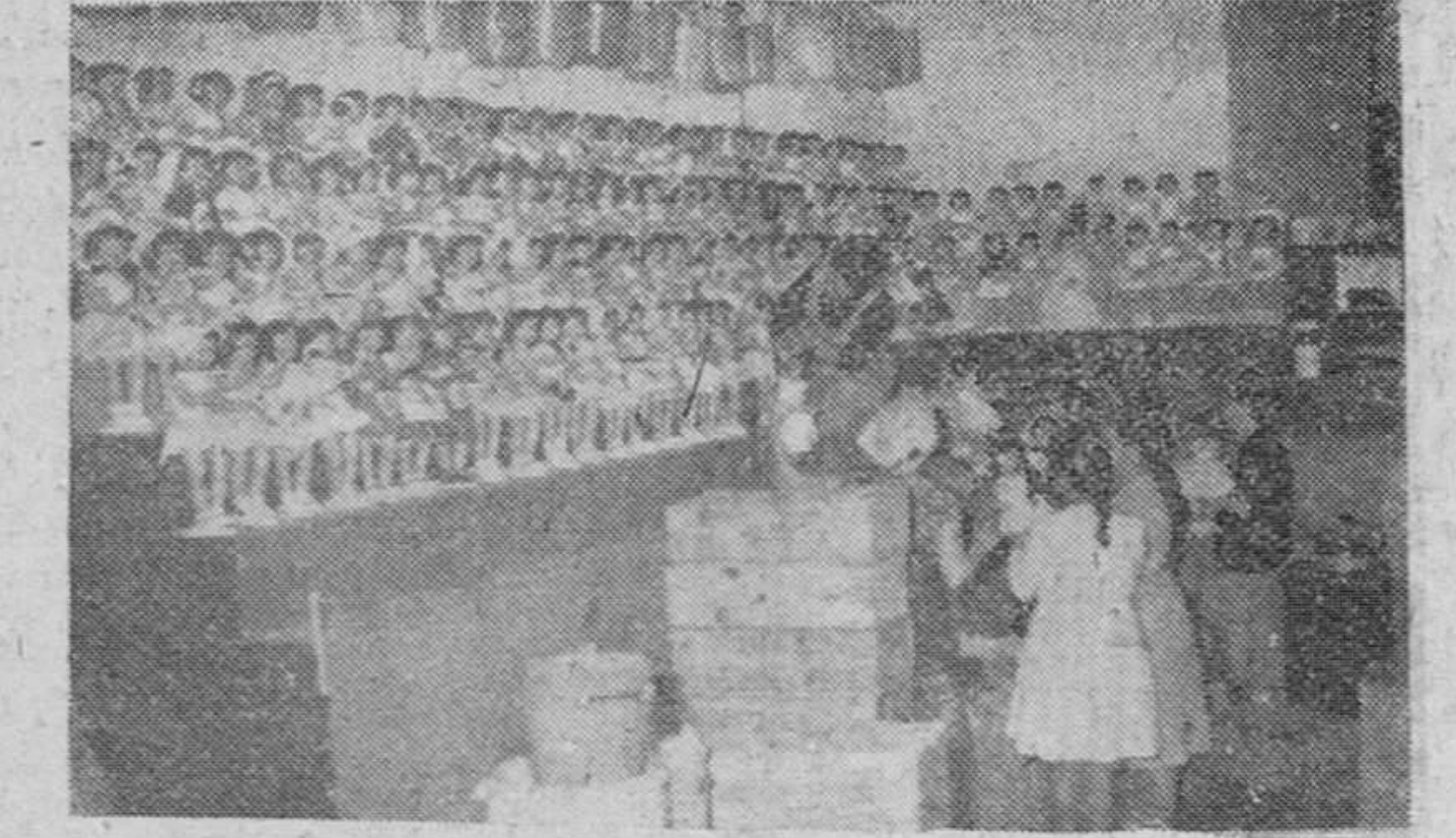
Esta tarde, a las ocho, nuestro Rvdo. Prelado bendicirá e inaugurará la Tómbola diocesana de Caridad, en solemne acto al que asistirán todas las autoridades, iniciándose seguidamente la expedición de boletos. En nuestro grabado, vista parcial de las instalaciones de dicha institución de caridad que hoy abrirá sus puertas para los burgaleses.