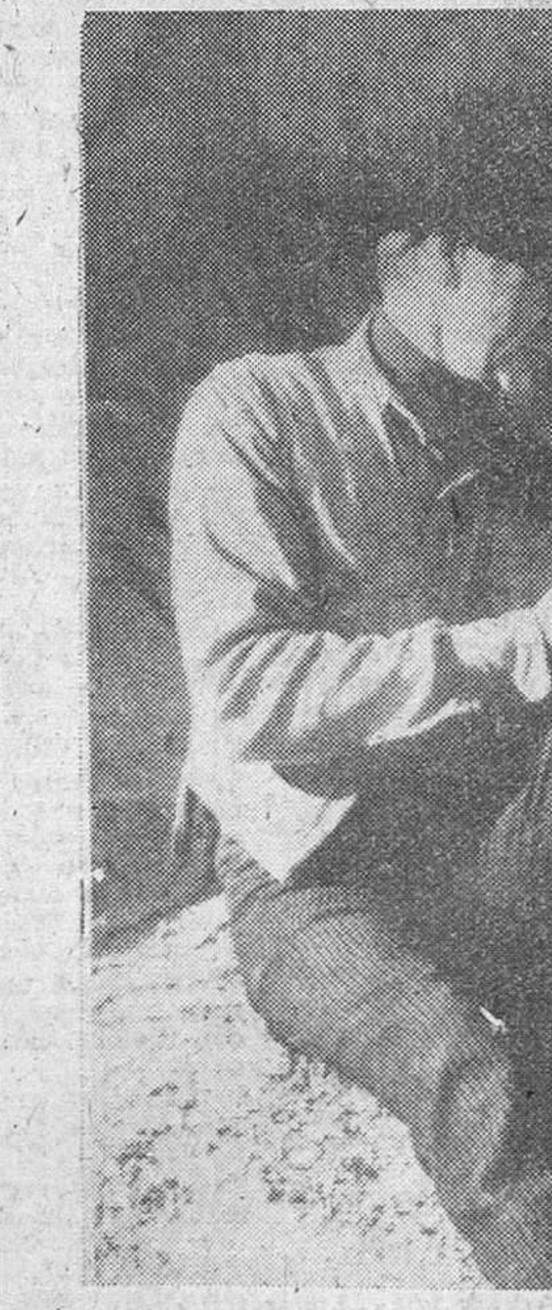
Aunque no se le conocían aficiones musicales y menos por el flamenco, aquí vemos a Gary Cooper aprendiendo a tocar las palmas con el ritmo peculiar en los bailes gitanos y andaluces, durante el rodaje de su última película, "Man of the West". La escena está tomada en el Cañón del Colorado. Y de profesora... nada menos que Sarita Montiel.