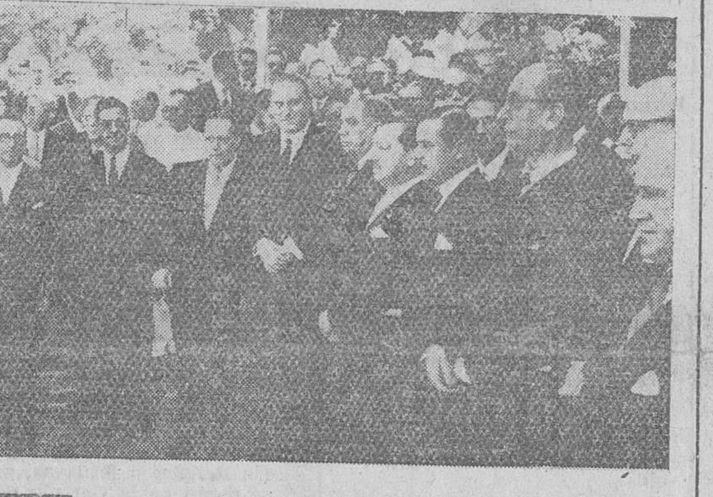
Las Palmas.—El ministro de Asuntos Exteriores, señor Castiella, acompañado de los embajadores hispanoamericanos acreditados en Madrid, durante el acto de la ofrenda floral ante el monumento a Cristóbal Colón.

Una misteriosa fuerza física está desviando al satélite ruso de su órbita Cambridge (Massachusetts, Estados Unidos).—Un grupo de astrólogos y físicos están tratando de averiguar hoy la naturaleza de una misteriosa fuerza física que, al parecer, está desviando al satélite artificial de su curso alrededor de la Tierra, sin responder "a las leyes de la gravedad". Al parecer otras fuerzas in-nuyen sobre él.