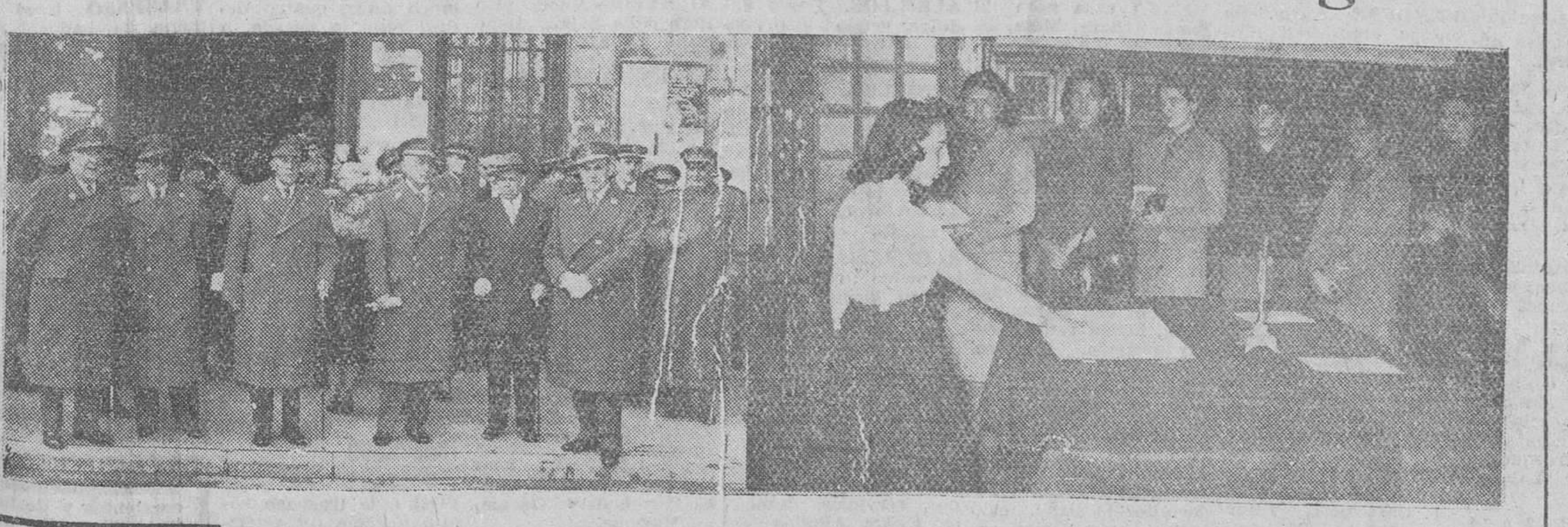
El Cuerpo de Intendencia y la Sección Femenina celebraron ayer las acostumbradas solemnidades, con motivo de la festividad de Santa Teresa, su Patrona. En el precedente grabado, figura, a la izquierda, un grupo de personalidades concurrentes a la fiesta castrense celebrada en el Carmen y, a la derecha, un momento del paso de Flechas a la Sección Femenina.