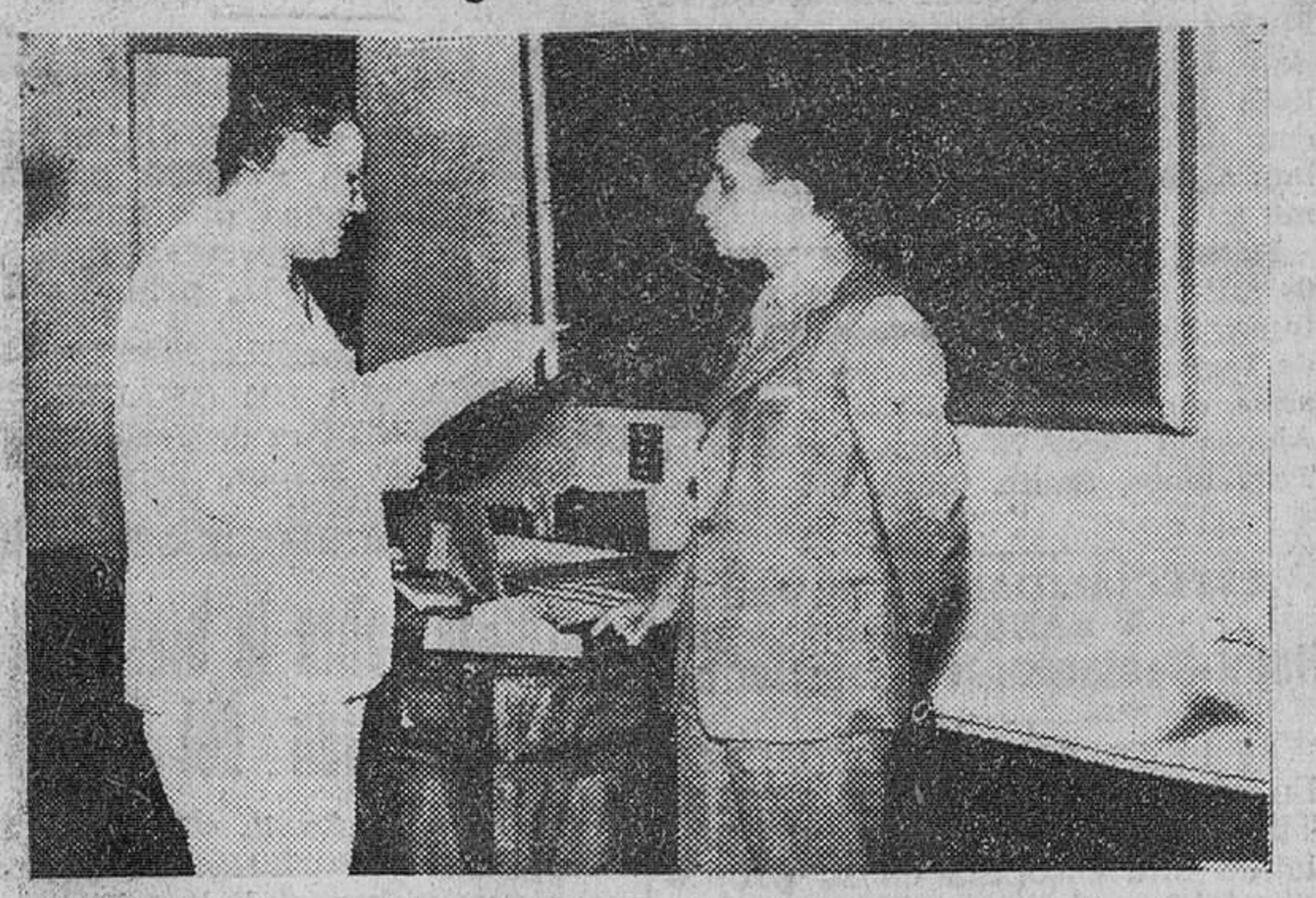
Bagdad. — El encargado de Negocios de la Embajada de España en Irak, don Rafael Godol, en el momento de hacer entrega al Rey Feisal II del Blason e Insignias de la ciudad de Córdoba, otorgados al monarca como recuerdo de su estancia en la capital andaluza.