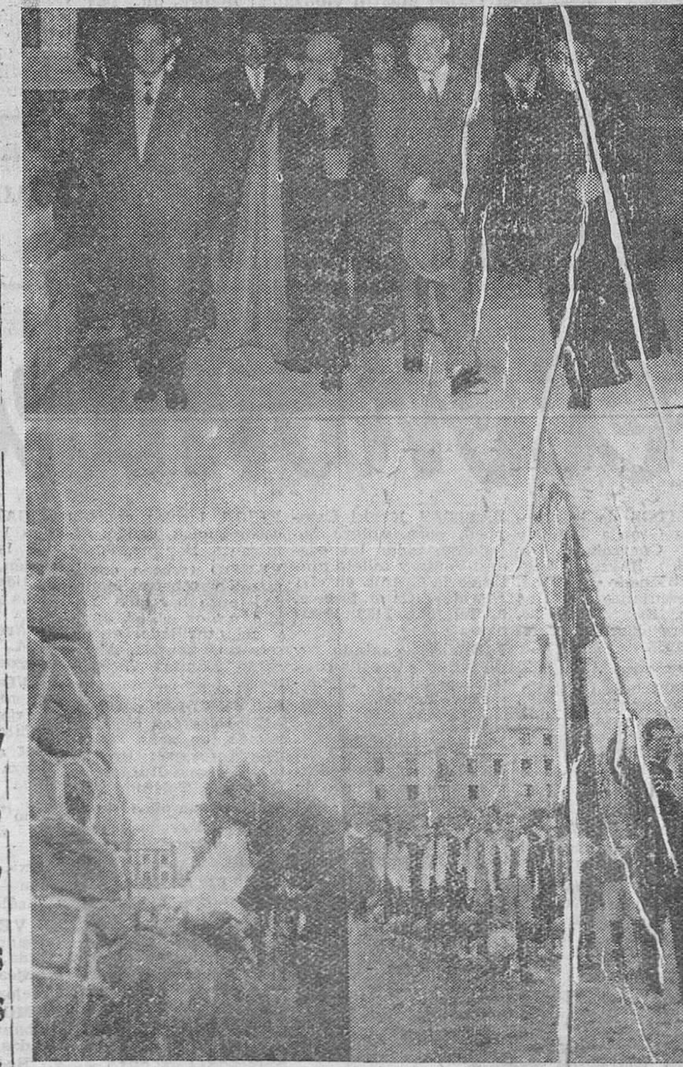
El domingo culminaron los actos de la "Pascua del Deportista" y tuvo lugar la clausura de los campeonatos de S.E.S.A. Nuestro gráfico recoge diversos momentos de tales conmemoraciones. En primer lugar la llegada de nuestro héroe. Preside a la Catedral y al pie, la ofrenda hecha ante el altar por el delegado a la memoria del Excmo. Sr. D. Juan Yagüe y una visita de la formación juvenil que encabezaba el desfile de los 39 equipos que han participado en las competiciones de S. E. S. A.