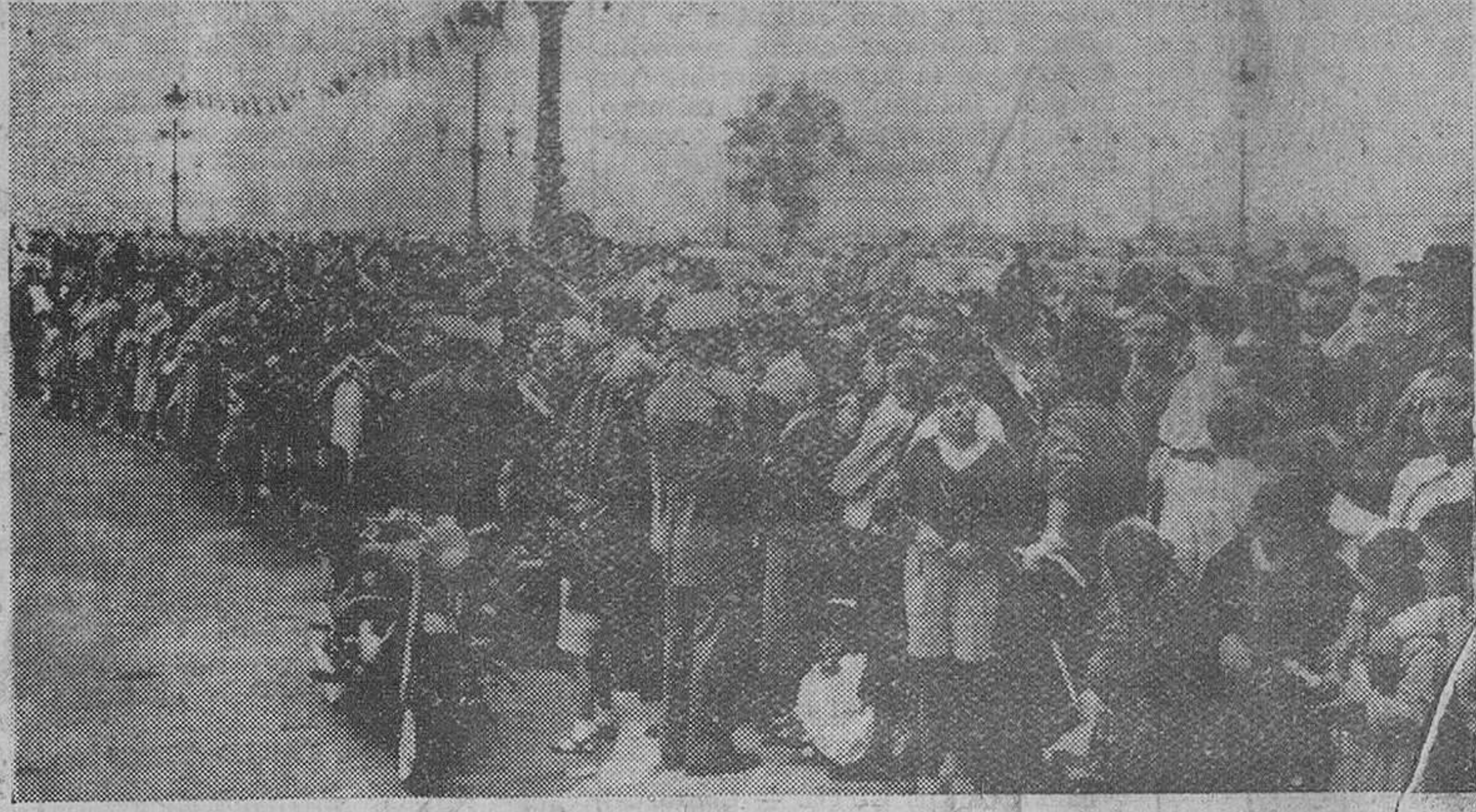
Barcelona. — La muchedumbre estacionada ante las puertas del palacio Real de Pedralbes, para aclamar a S. E. el jefe del Estado.