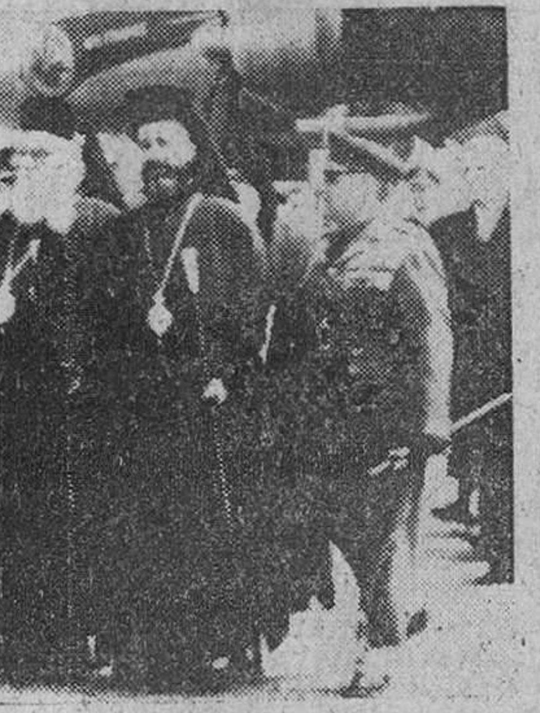
Atenas. — El arzobispo Makarios, de Chipre (a la derecha, con barba negra) a su llegada a Atenas, después de su exilio, acompañado del arzobispo Deroteles, de Atenas y las autoridades. Fuerzas militares le rindieron honores.

Washington. — Estados Unidos han anunciado que, durante la pasada semana comunicó a catorce naciones aliadas que está dispuesto a discutir "ciertas modificaciones" en las restricciones impuestas al comercio con la China roja.—Efe.