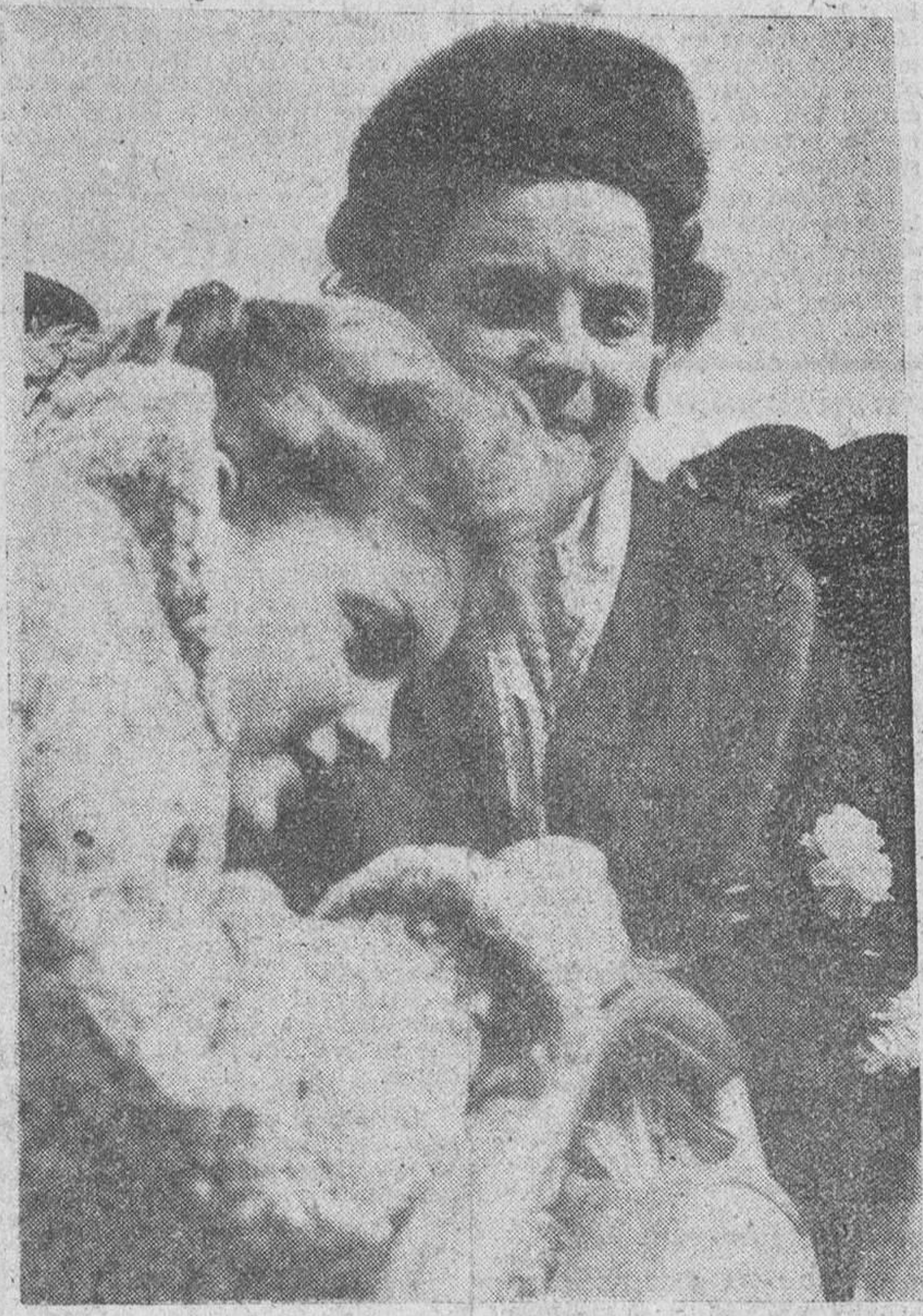
Madrid. — La célebre actriz alemana, Romy Schneider, intérprete de "Sissi", ha llegado a Madrid en el avión "Cine", Magda Schneider. —.