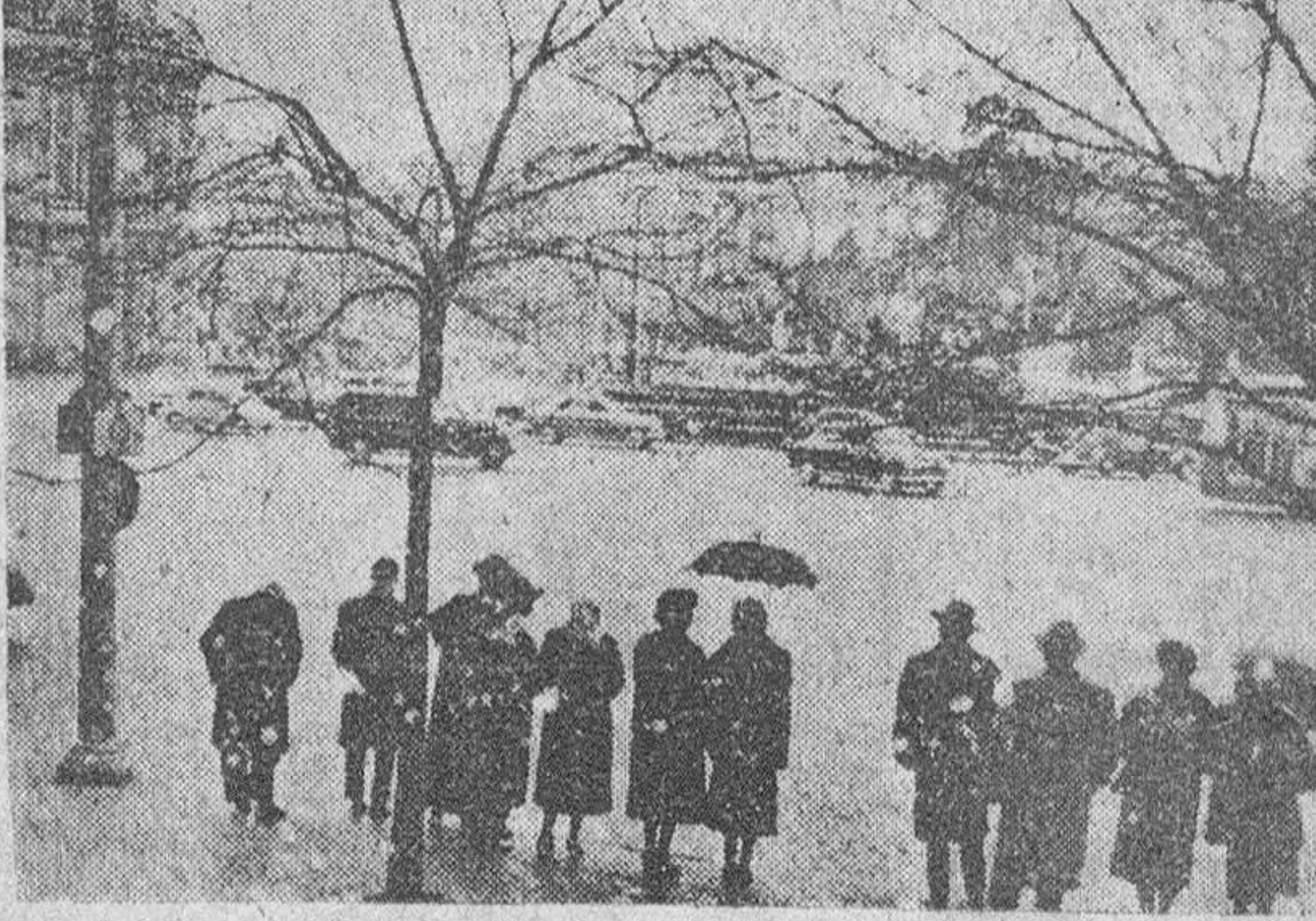
Madrid. — La primera nevada del invierno ha caído sobre Madrid, aunque el blanco manto no llegó a cuajar, cubriendo sólo los jardines. En la plaza de la Cibeles, la "cola" del autobús soporta estoicamente la nevada.