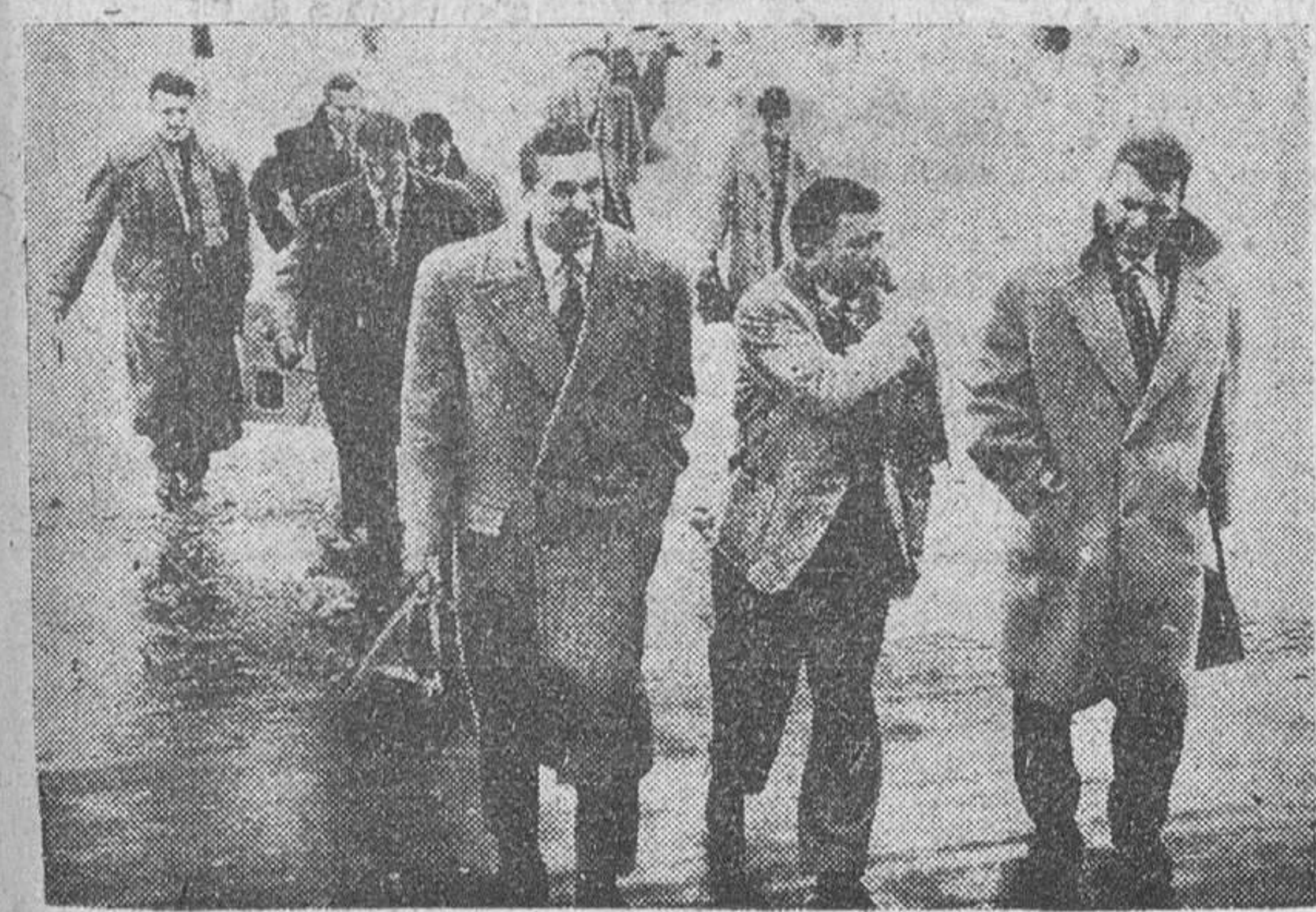
Zurich. — Los jugadores del equipo húngaro del Honved, con su capitán Ferenc Puskas al frente, en el aeródromo de Kloten, procedentes de Milán y con rumbo a la América del Sur, donde tratan de jugar una serie de partidos que ya tenían contratados antes de que la Federación de su país les prohibiera el viaje. La F.I.F.A. también ha prohibido a su vez que ningún equipo juegue con el Honved.