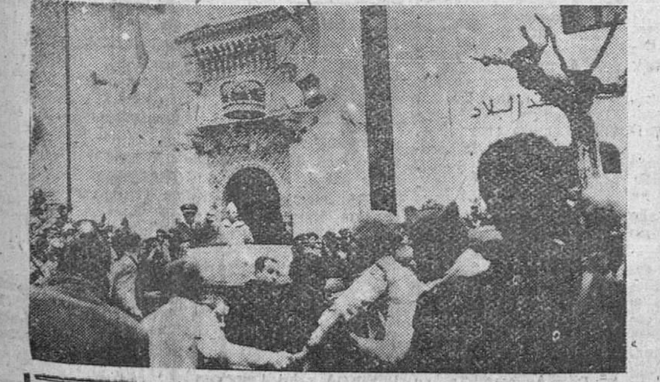
Tetuan. — S. M. I. Mohammed V abandona el palacio del Mexuar para proseguir su viaje de regreso a Rabat, a través de la zona Norte de influencia española.