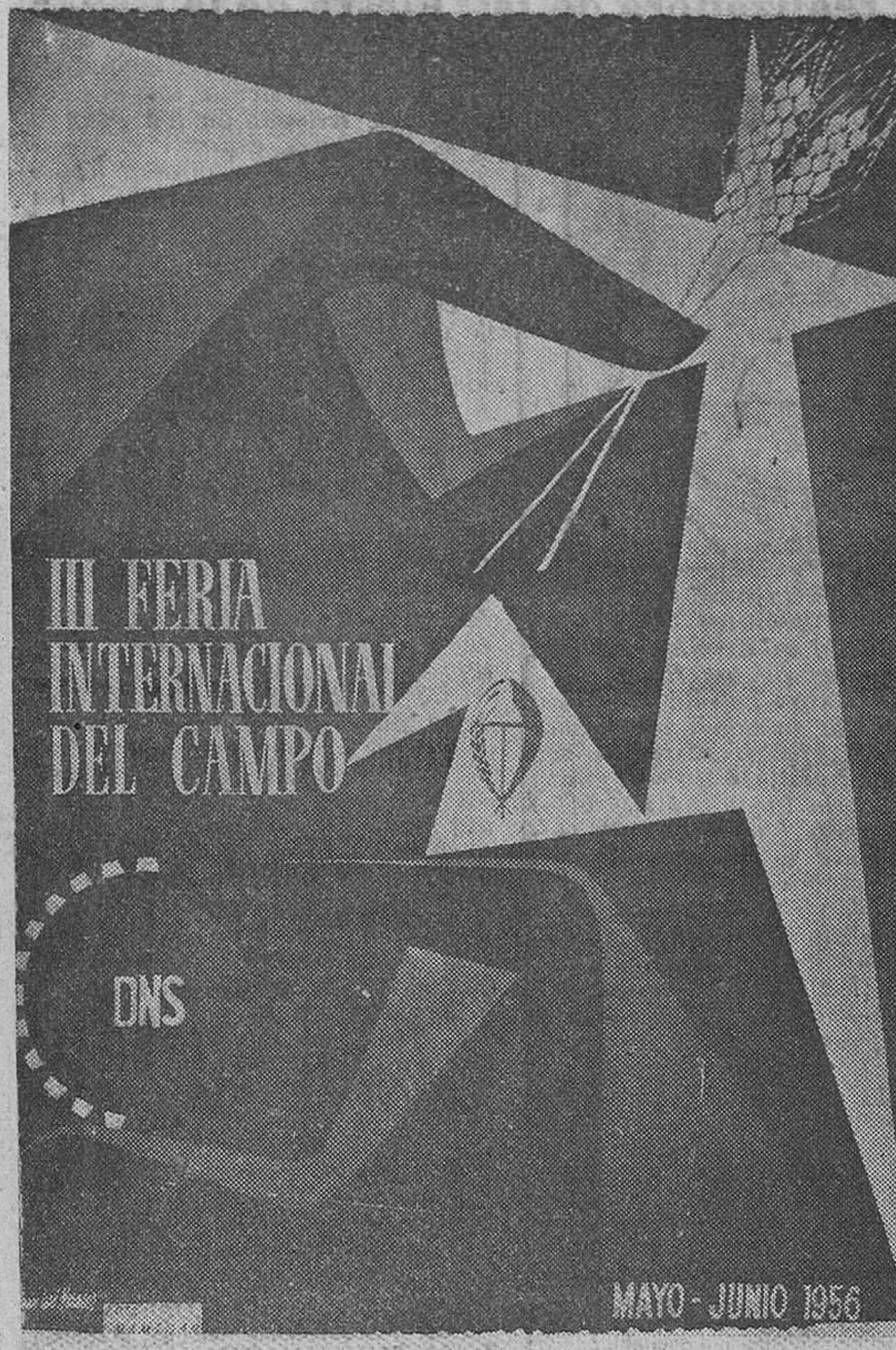
Primer premio de carteles anunciadores de la III FERIA INTERNACIONAL DEL CAMPO. Autor: Don Juan José Morales.

La III FERIA INTERNACIONAL DEL CAMPO va a abrirse, pues, para acoger a millones de españoles y extranjeros, en la más auténtica y maravillosa exhibición del engrandecimiento de la ganadería y la agricultura nacionales.