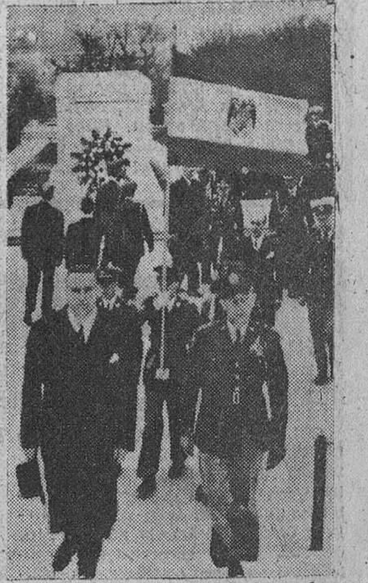
Washington. — El Sr. Martín Artajo, acompañado del mayor general John G. Van Outen, comandante del Distrito militar de Washington, a la salida del cementerio nacional de Arlington, después de colocar una corona de flores ante la tumba al Soldado Desconocido.

El piloto del helicóptero llevó a éste hasta el pequeño helipuerto (Pasa a última página).