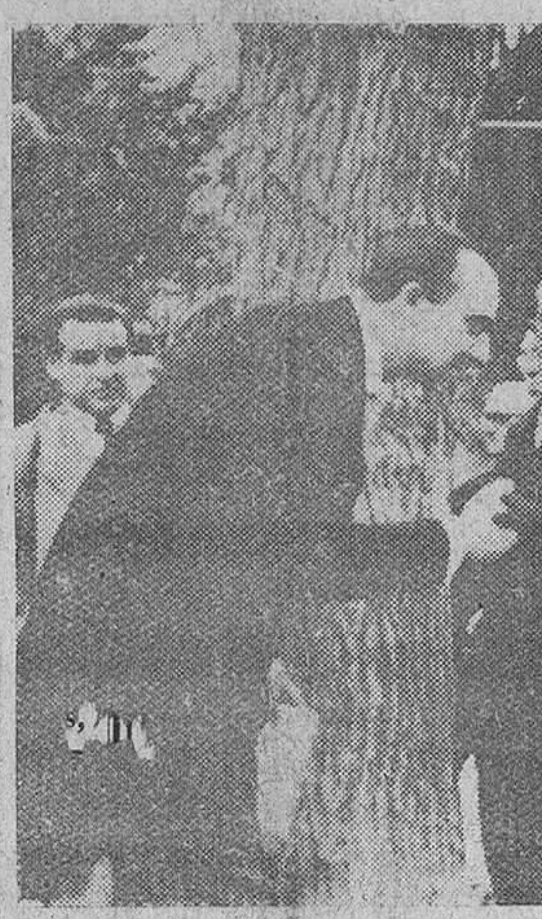
Murcia. — El subsecretario de Comercio, marqués de Miralrio, que presidió la inauguración de la III Feria Regional de Muestras celebrada en esta ciudad, saludando a la venerable madre del ingeniero La Cierza Codorniu, con ocasión del acto del descubrimiento de un busto a la memoria del inventor del autogiro.

Inauguración de la III Feria Regional de Muestras de Murcia