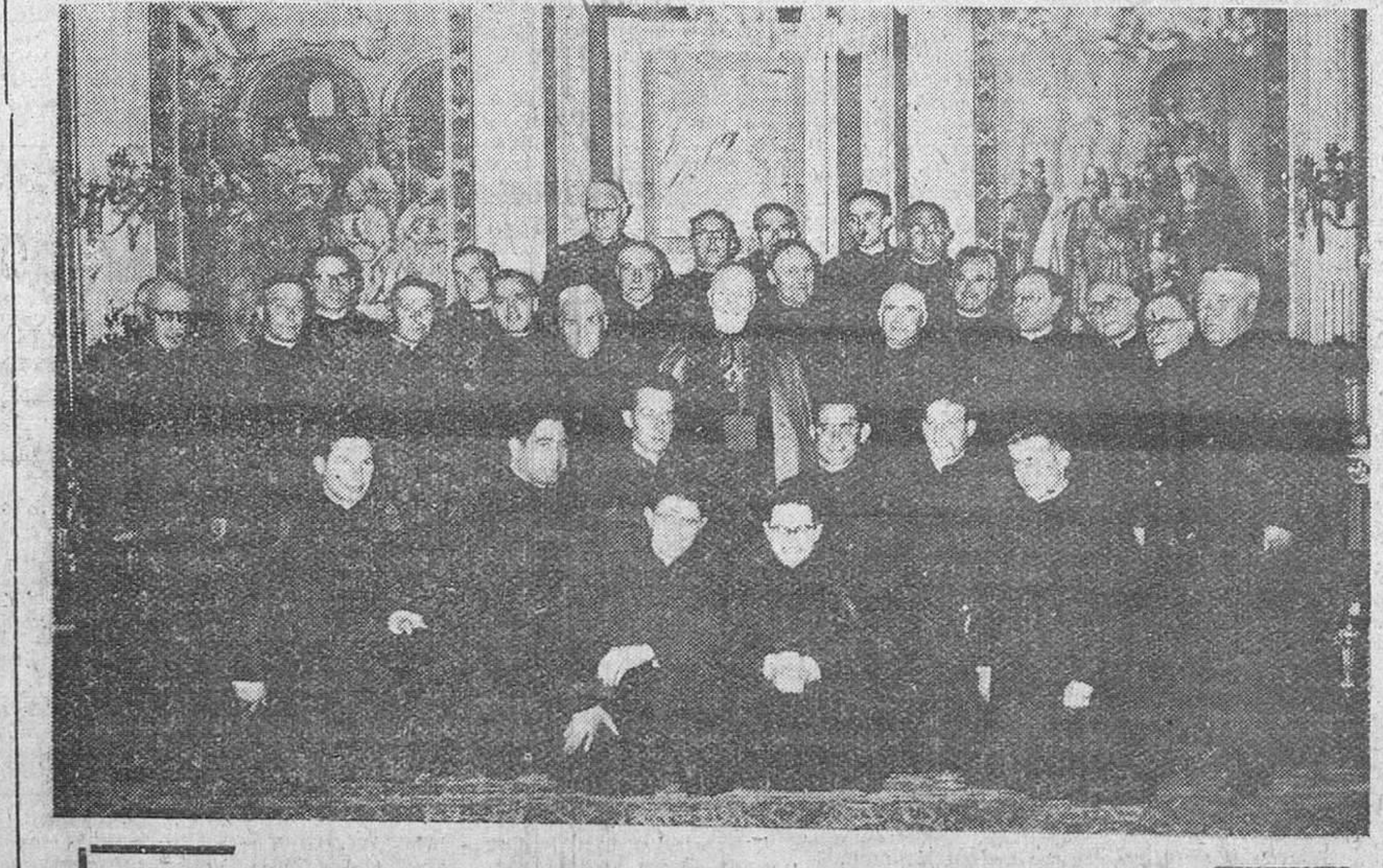
Grupo de sacerdotes que ayer acudieron a saludar al Excmo. Sr. Arzobispo de Burgos, para despedirse de él, al pasar a la Diócesis de Santander.

Dice Eisenhower que los jefes soviéticos de hoy piensan como cuando Stalin estaba en el Poder