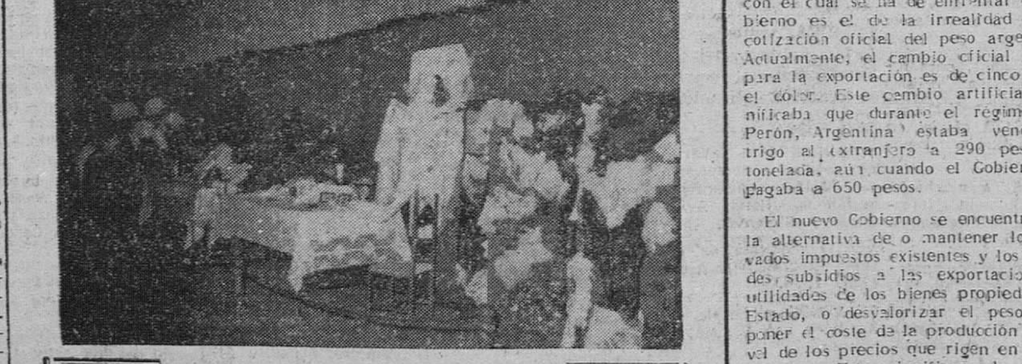
Montada por la Sección Femenina ha quedado inaugurada en la Sala de Arte del Teatro Principal una interesante exposición de labores de artesanía, denominada "Ayuda al hogar" y en la que se exhiben magníficos y acabados trabajos artesanos de todas las regiones españolas. En la foto de "Fede", uno de los rincones de la exposición.