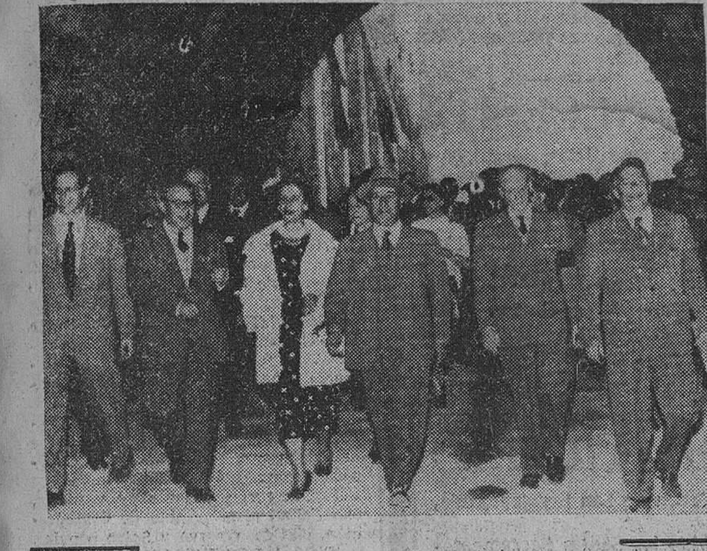
Pont de Suert. — S. E. el jefe del Estado, acompañado de su esposa, doña Carmen Polo de Franco, de varios ministros y personalidades de su séquito, hace su entrada en la central subterránea de Escales, para proceder a su inauguración.