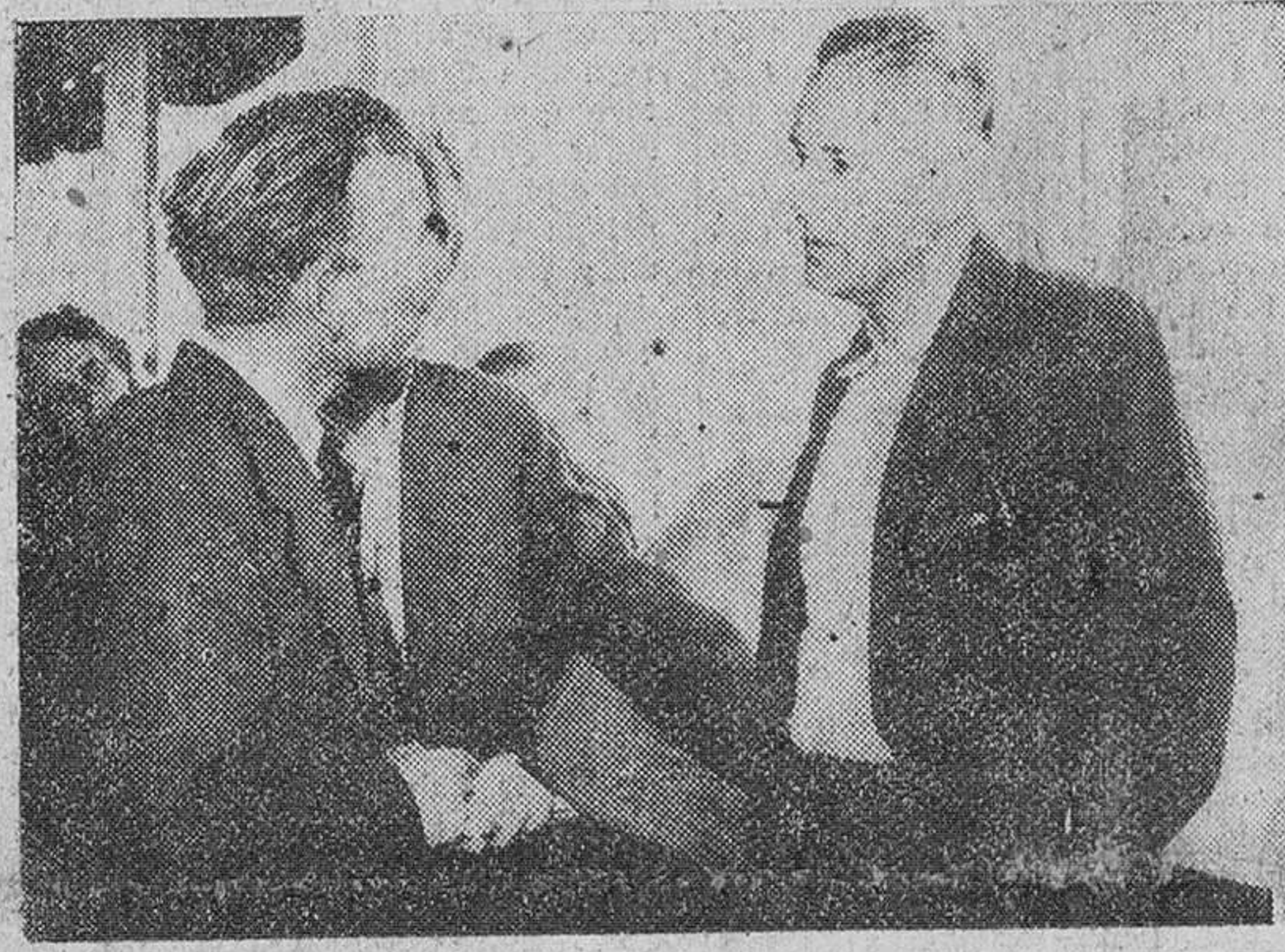
Plymouth. — Fotografiado a bordo del vapor "Italia", el antiguo espía alemán Erich Gimpel...