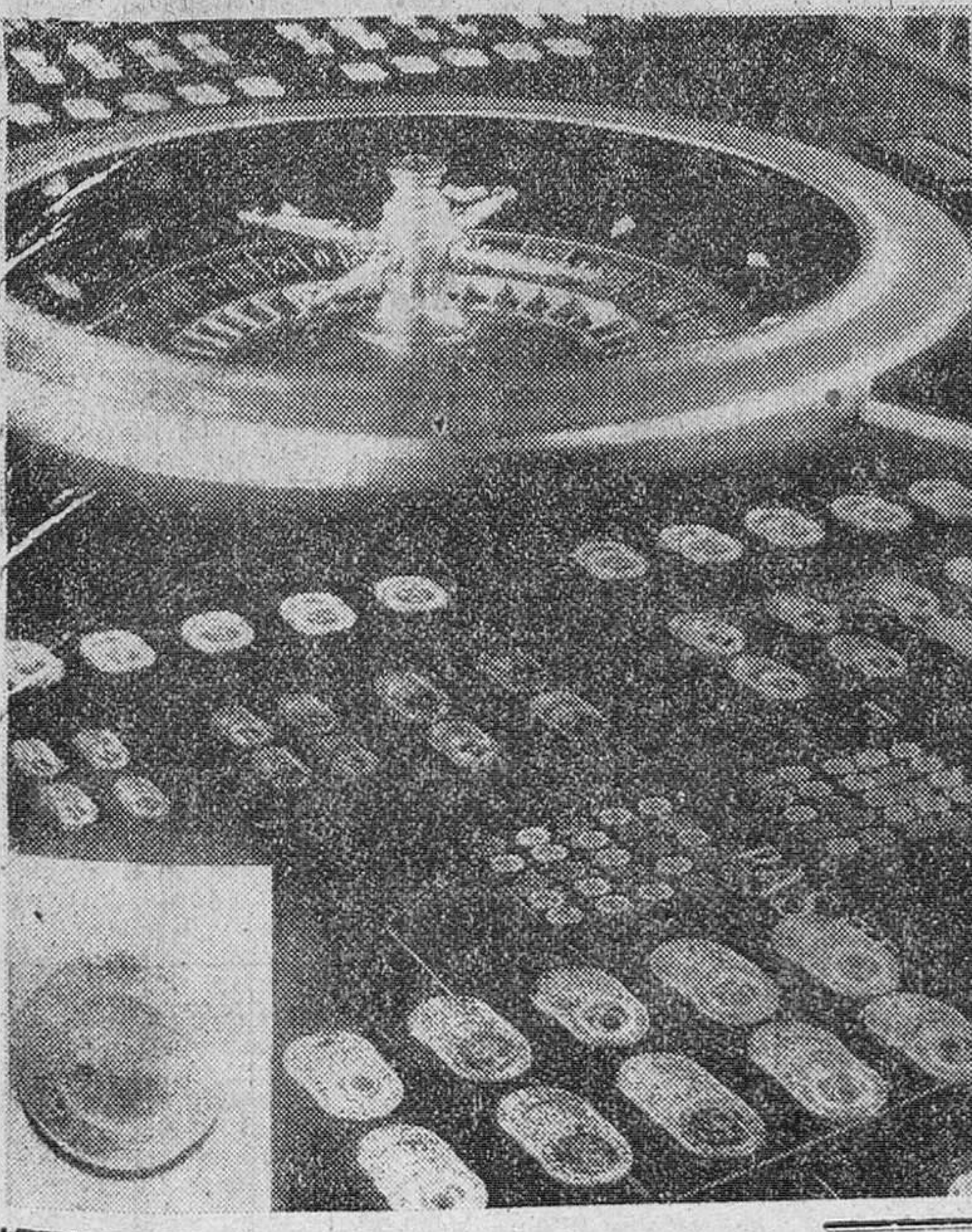
Con motivo de celebrarse las bodas de oro del gran casino de Baden Baden, se ha inaugurado la nueva sala de juego adornada con monedas de oro y plata...